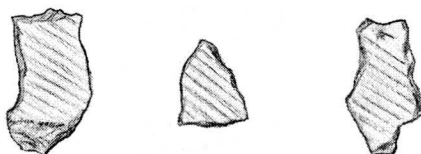
T. T. -04