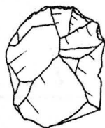
T. T. -04