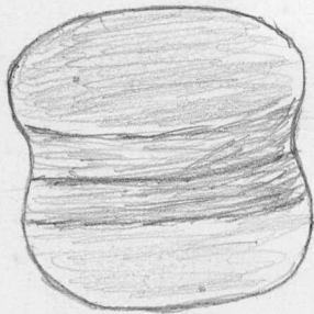
1. ca 1/2.