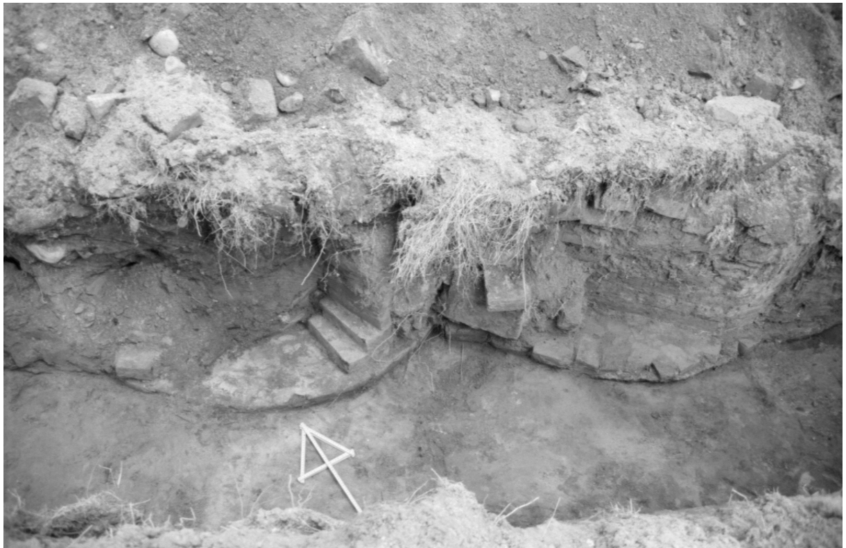
Kuva 2. Koeoja B, tiilirakenne SE-päädystä ruuduissa 2006-2010/2016. f. 140846