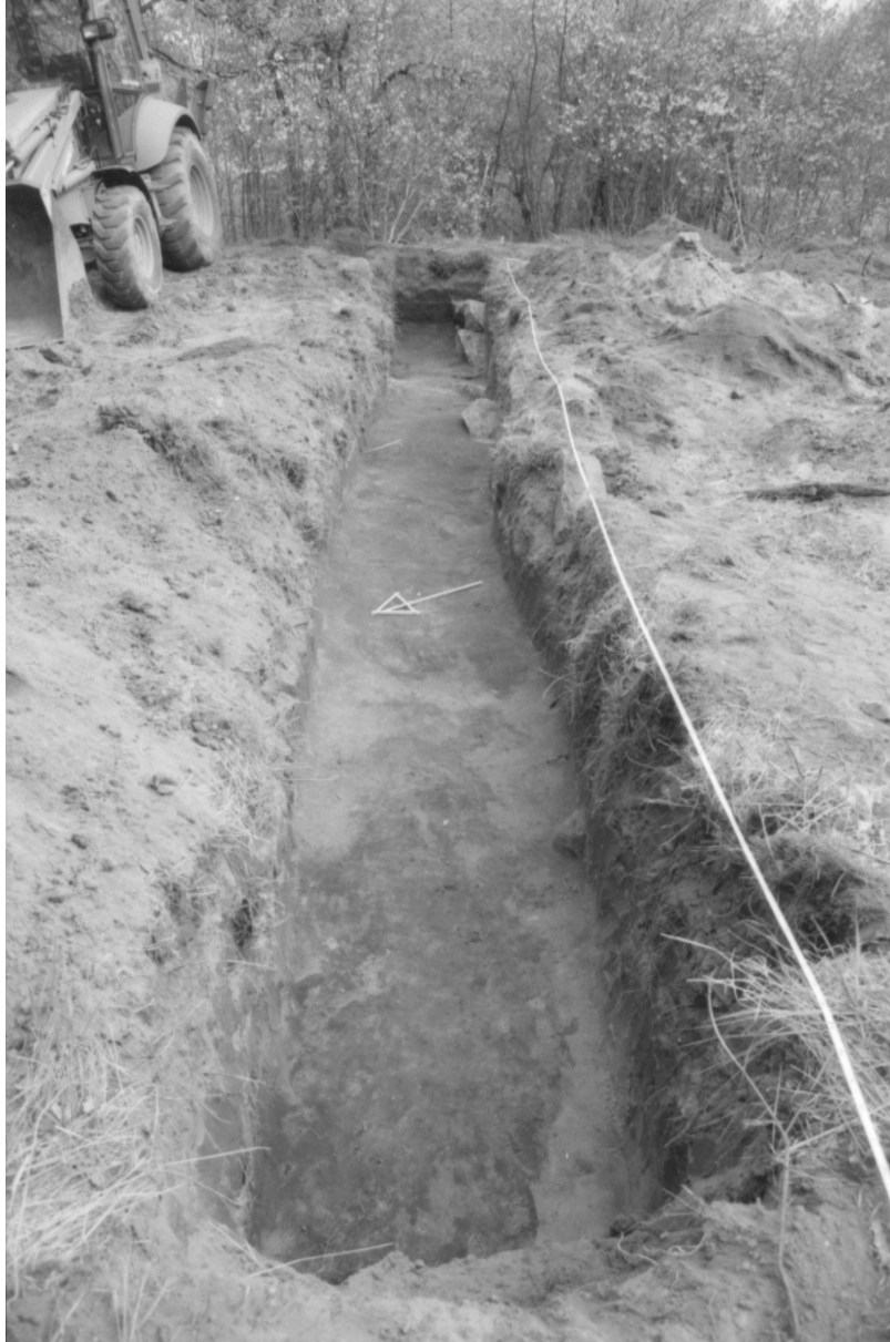
Kuva 3. Koeoja E, taso 2. konekaivuukerroksen jälkeen: kulttuurimaa paikoin näkyvissä. f. 140866.