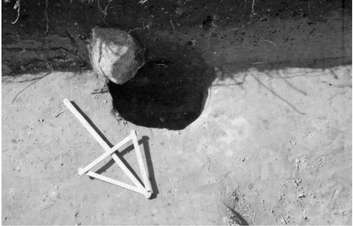
Kuva 4. Koeoja E, mahdollinen paalunjälki kaivettuna ruudussa 2008/2034. f. 140871