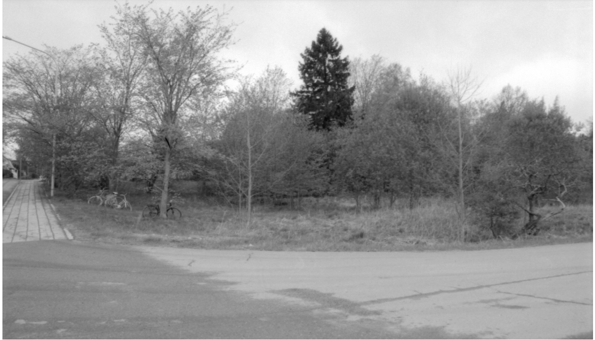
Kuva 1. Yleiskuva Tengströminkatu 2:n tontista. f. 140837