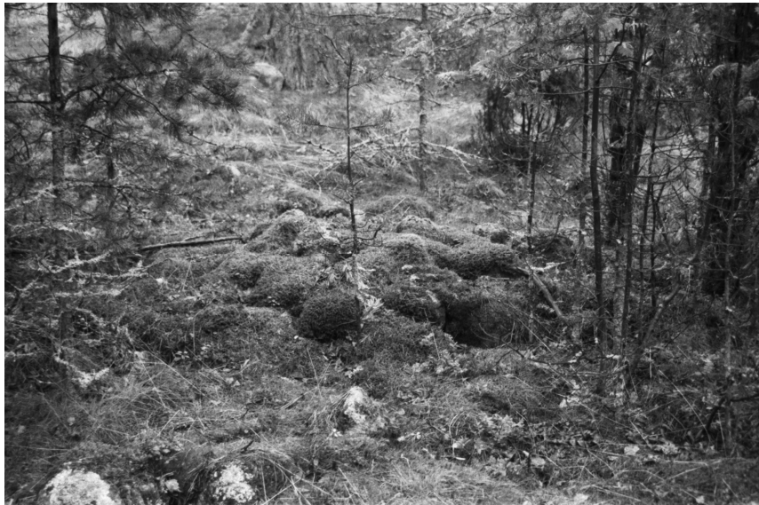
f. 140627 Vehkaluoto, röykkiö 6700952 / 3493281. Länestä. Kuv. K. Vuoristo.