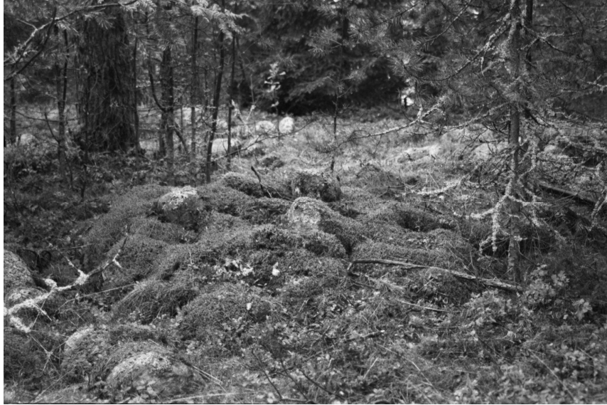
f. 140626 Vehkaluoto, röykkiö 6700952 / 3493281. Idästä.