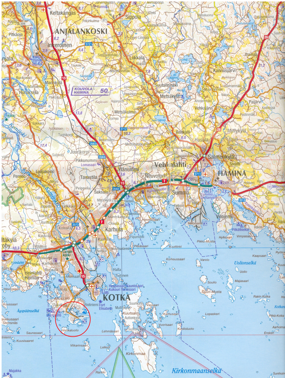
Ote GT 3-tiekartasta (Lahti – Lappeenranta), inventoitu alue merkitty punaisella.