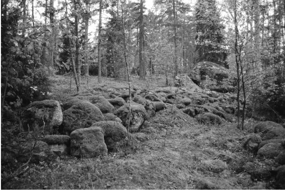
f. 140624 Santalahti, historiallisen ajan kivimuri (6700854 / 3493321). Eteläkaakosta. Kuv. K. Vuoristo.