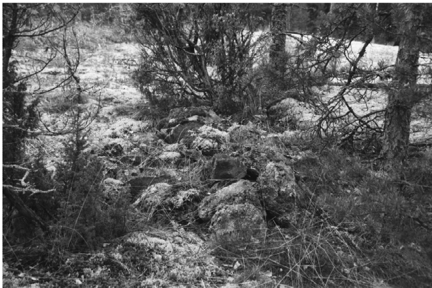
f. 140623 Tökkerin kivirökkiö. Idästä. Kuv. K. Vuoristo

Mussalon sataman eri laajennusvaihtoehdot jäävät Jänskätien etelä- ja lounaispuolelle, jolloin rökkiö sijaitsee hieman laajennussuunnitelmien ulkopuolella. Kohdetta ei tarvitse tutkia, mikäli sataman rakennustyöt eivät laajene kyseiselle alueelle.