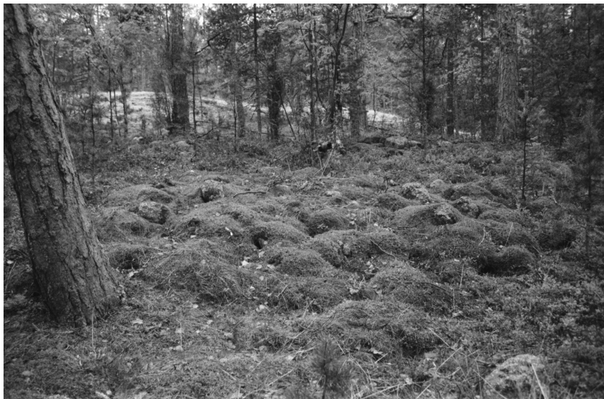
f. 140628 Vehkaluoto, röykkiö 6700955 / 3493310. Pohjoisesta. Kuv. K. Vuoristo.