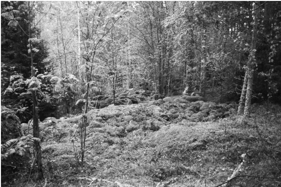
f. 140625 Santalahti, historiallisen ajan kivimuri ( 6700871 / 3493321). Luoteesta.