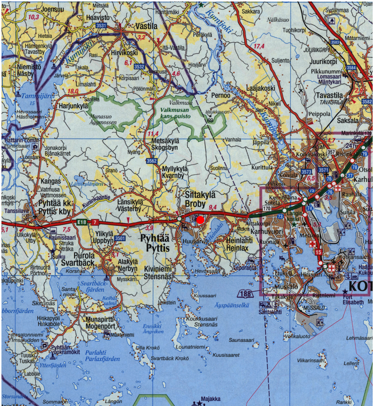
GT-karttaote, tarkastetun paikan sijainti merkitty punaisella pisteellä.