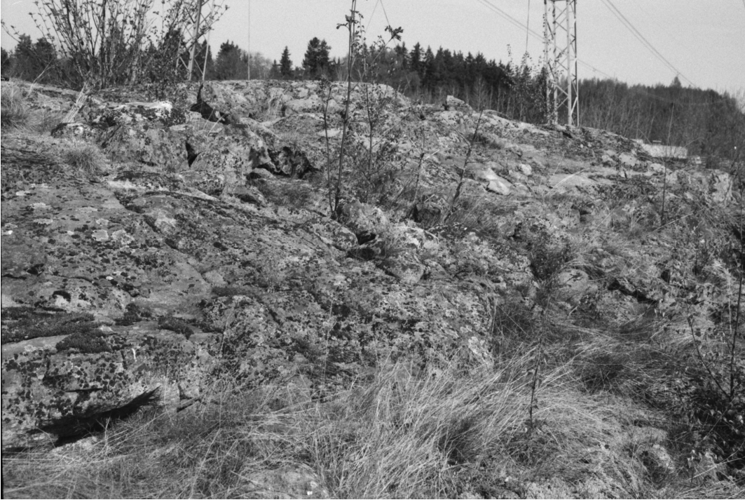
Stormossen 1. Röykkiön lähellä olevan kallion korkein kohta, jossa mahdollisesti jäänteitä röykkiöstä. S-N