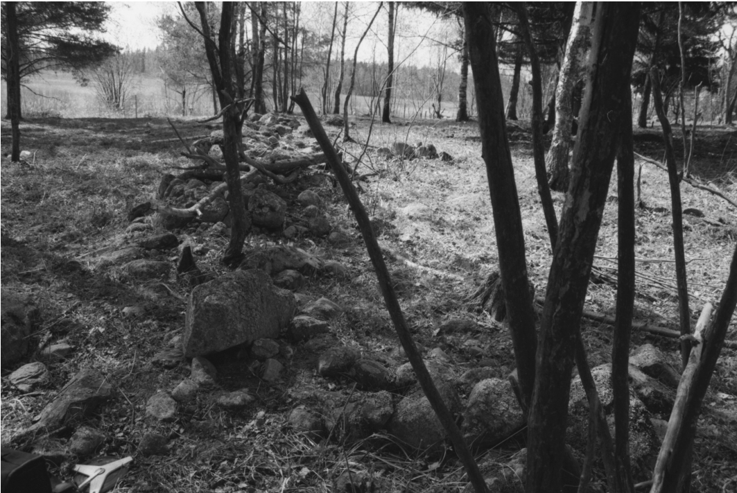
Stormossen 1. Röykkiön lähellä oleva kivrakennelma toisesta suunnasta. NE-SW.