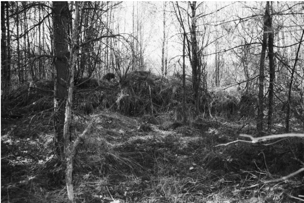
Stormossen 2. Mahdollisen röykkiön lähellä oleva peltoraunio. NNE-SSW.