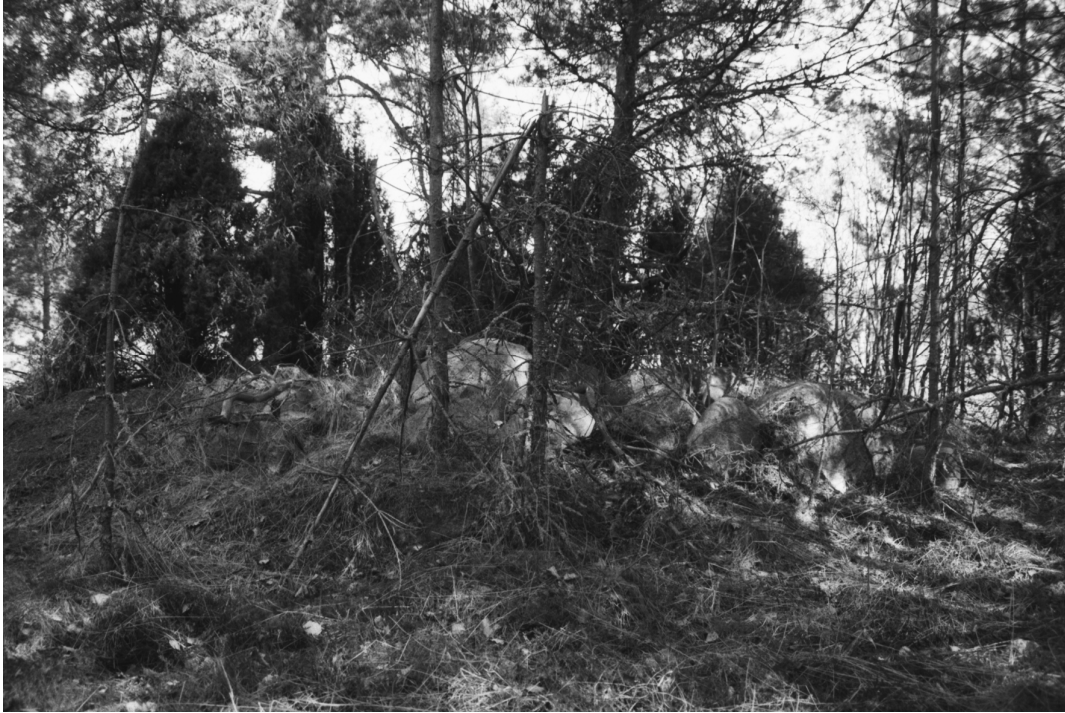
Stormossen 2. Mahdollinen röykkiö. S-N.