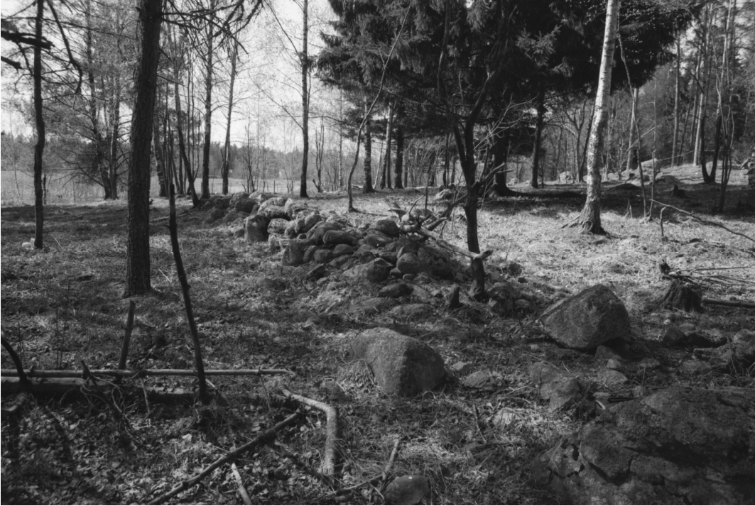
Stormossen 1. Röykkiön lähellä oleva kivrakennelma. E-W.