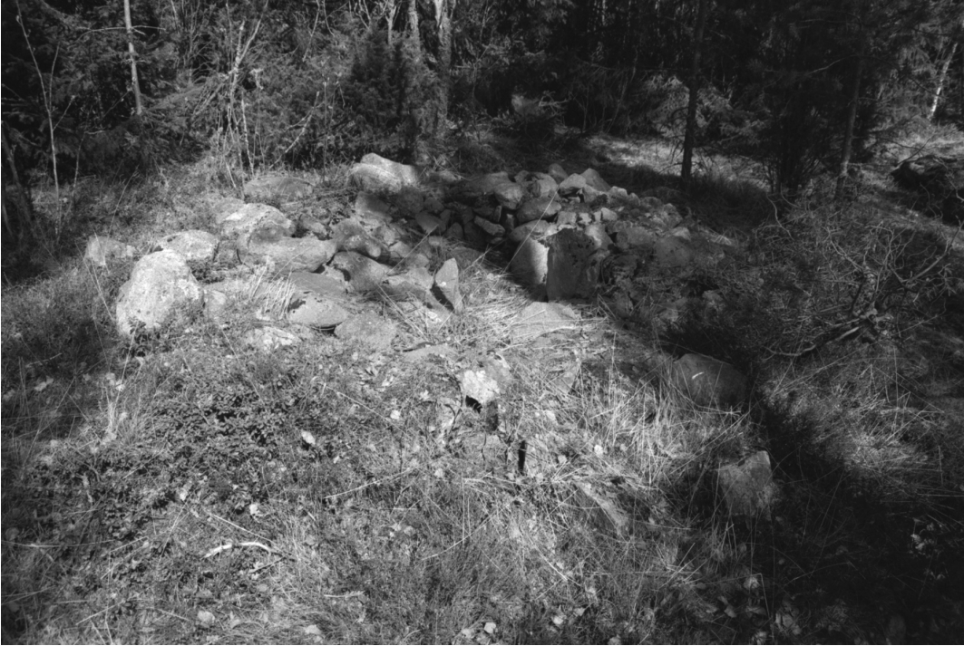
Stormossen 1. Röykkiön keskellä näkyy painauma. SSW-NNE.