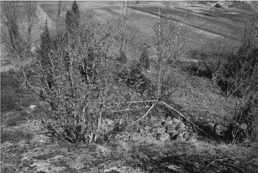
Stormossen 1. Rinne, joka on kallion korkeimman kohdan alapuolella. Rinteessä näkyy kivikasa. S-N.