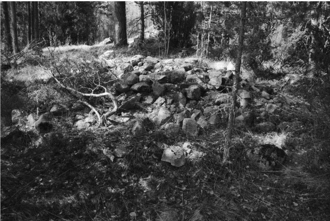
Stormossen 1. Röykkiö kuvattuna toiselta suunnalta. E-W.