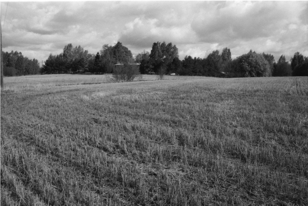
Kaava-alueen peltoja. Keskellä näkyy punatiilinen rakennus. Etelästä pohjoiseen.