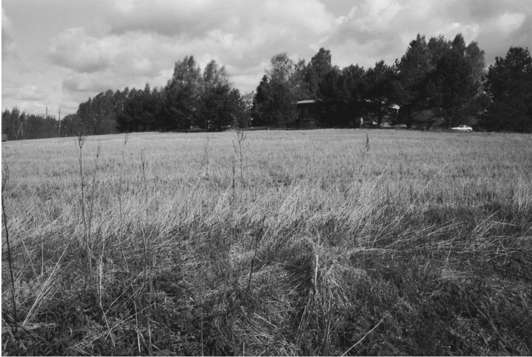
Kaava-alueeseen kuuluvia Mätäojan lähellä olevia peltoja. Peltojen keskellä näkyy tiilitalo, joka jää kehä II:n alle. Etelästä pohjoiseen.