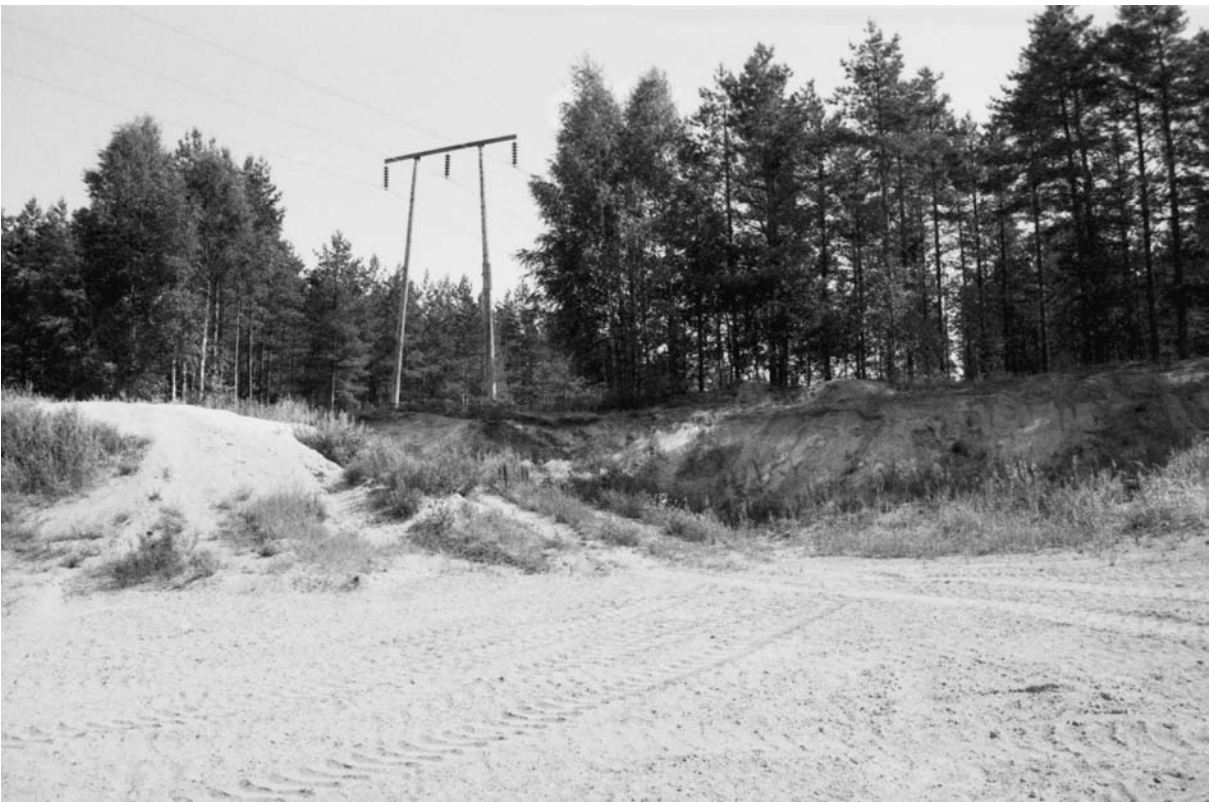
F. 142673. Yleiskuva Isojoen Sarvikankaan asuinpaikasta hiekkakuopan puolelta. Lännestä.