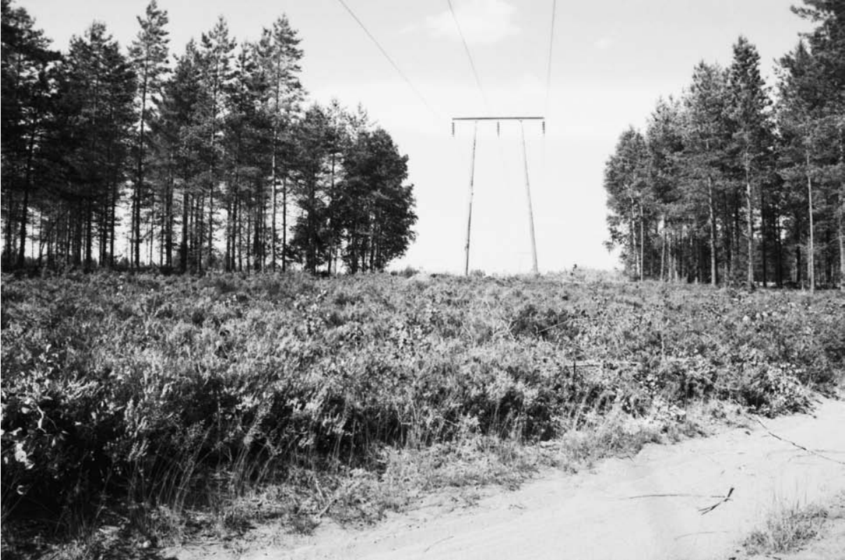
F. 142672. Yleiskuva Isojoen Sarvikankaan asuinpaikasta linjan kohdalla. Kaakosta.