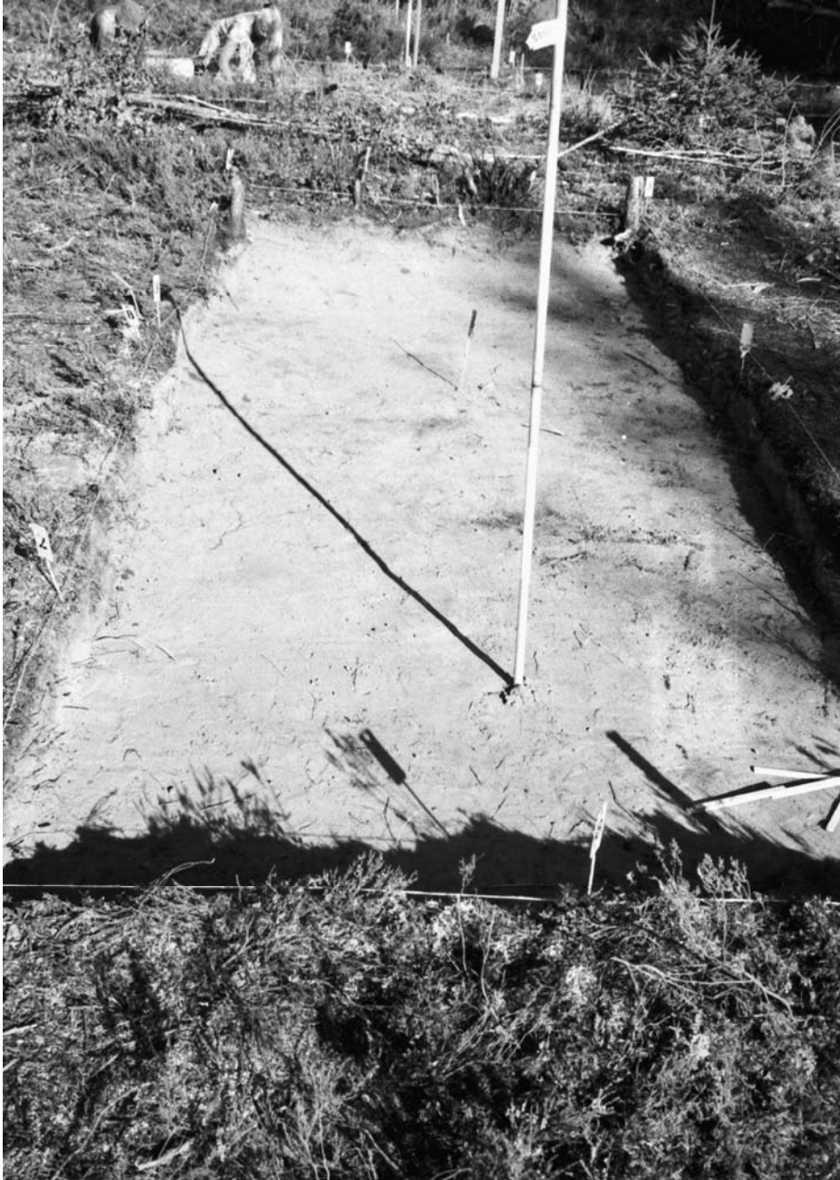
F. 142675. Kaivausalue 2 tasossa 2. Pylvään harjuksen kohdalle on tehty kaivausalue. Länsiluoteesta.