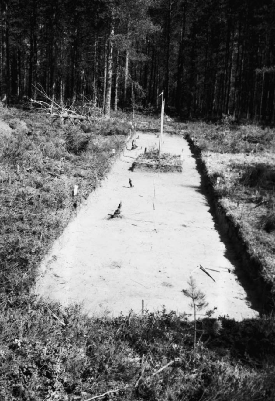
F. 142674. Kaivausalue 1 tasossa 2. Pylvään jalkojen kohdalle on tehty kaivausalue. Etelälounaasta.