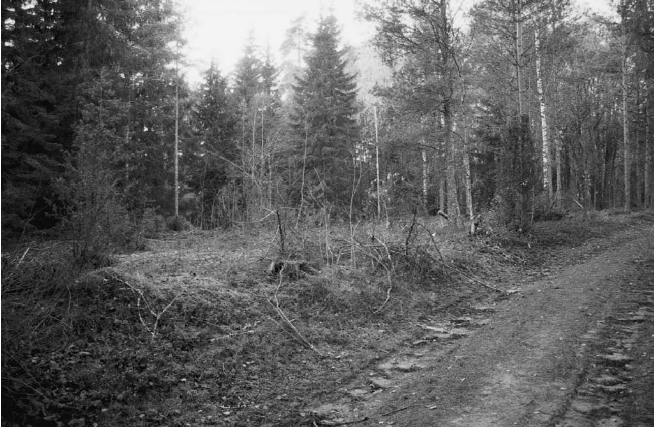
143218 Sikaoja, yleiskuva. Idästä.