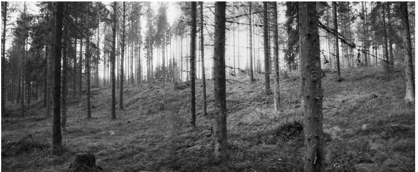
143221–143222 Madossuon terassitörmä, panoraama. Painanteet sijaitsevat terassin päällä. Koillisesta / idästä.