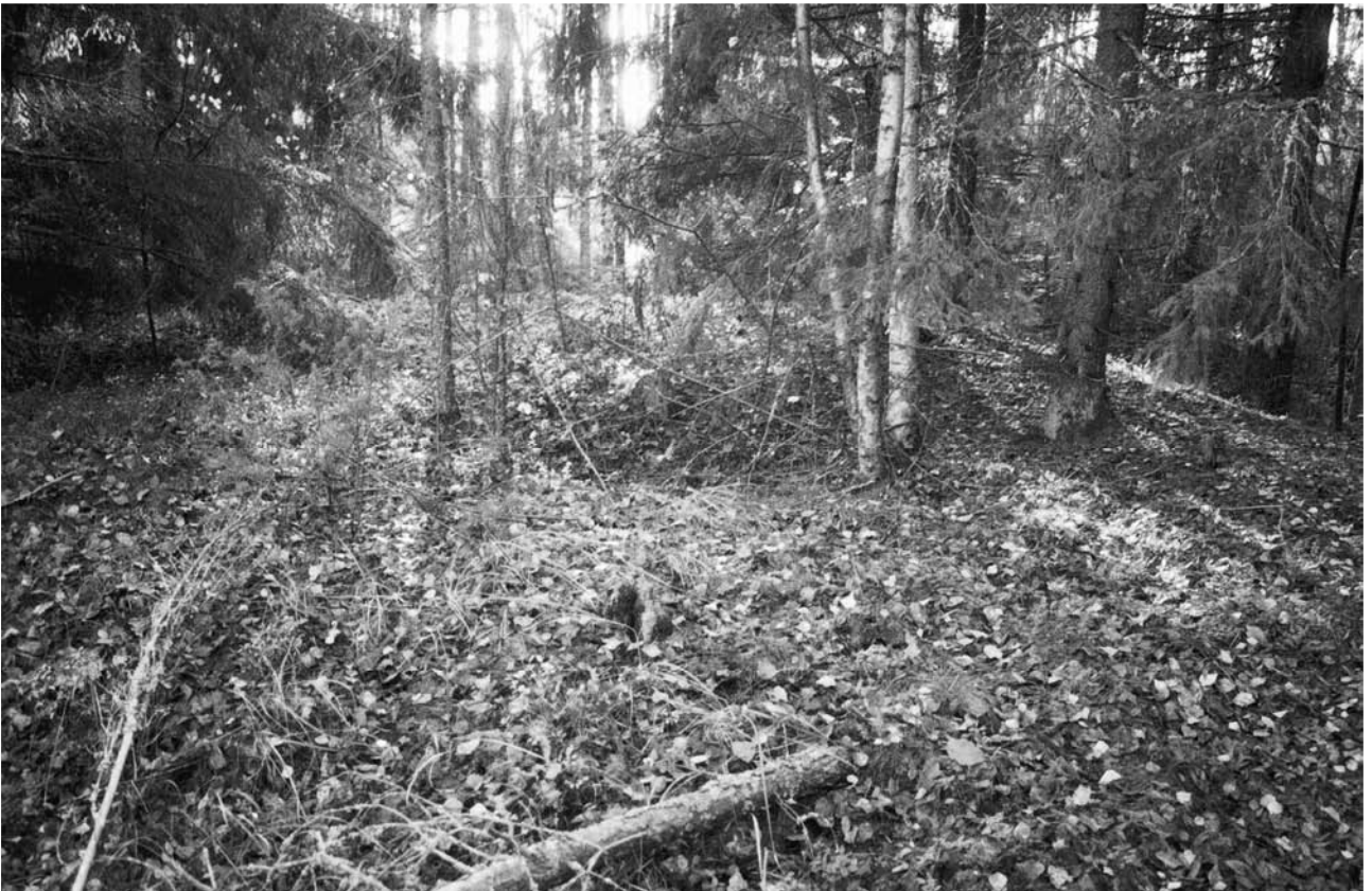
143219 Sikaoja, soikea painanne ojanpenkan koillispuolella. Pohjoisesta.