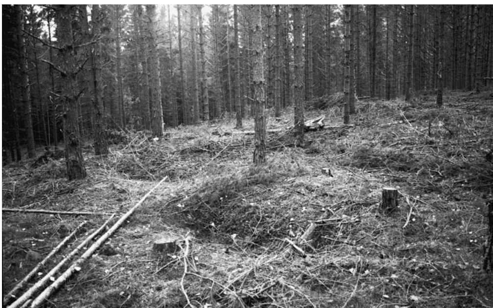
143223 Madossuo, pitkulaisia painanteita terassitasanteella. Luoteesta.