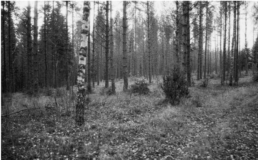
143220 Madossuo, yleiskuva. Pohjoisesta.