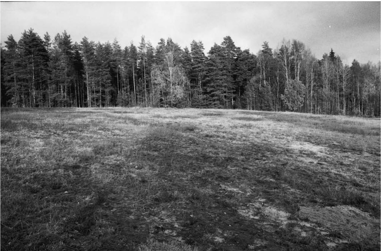
143217 Kettuojan pellon kivikautinen asuinpaikka. Lounaasta.