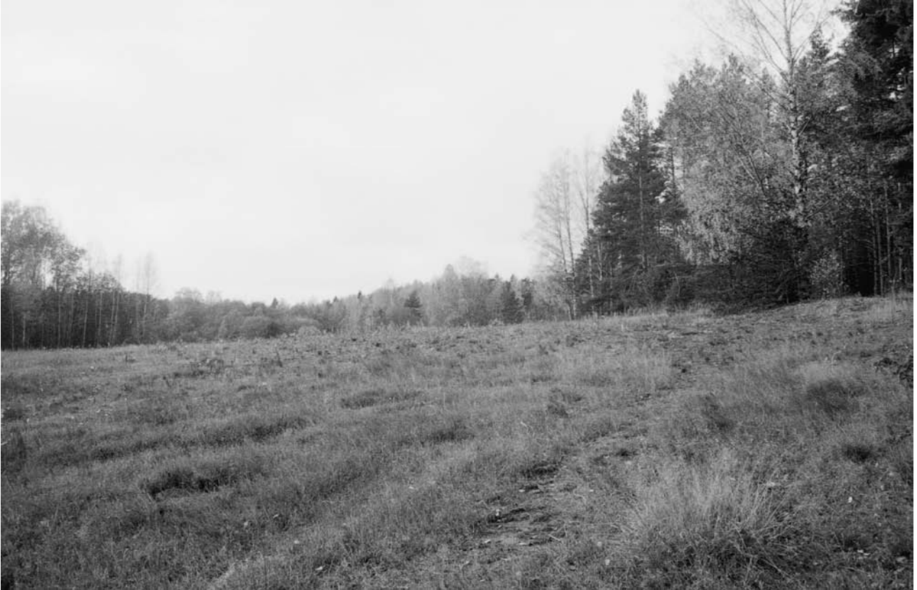
143216 Kettuojan pellon kivikautinen asuinpaikka. Kaakosta.