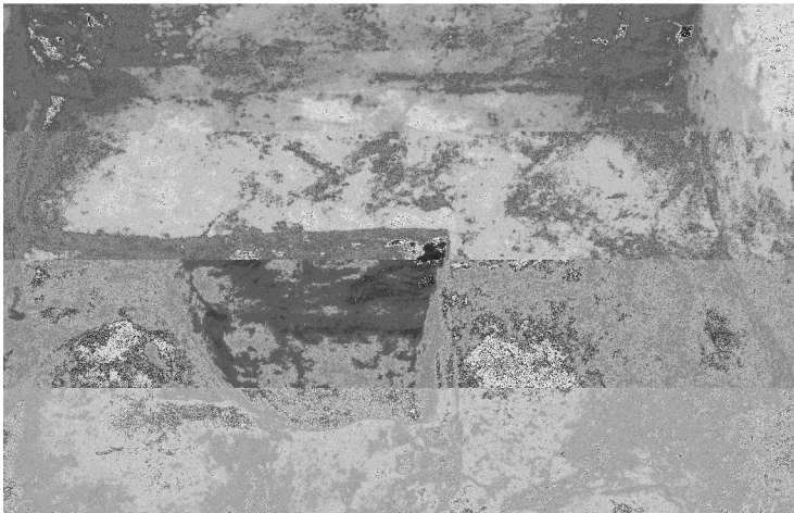
F.142411 Koekuoppa 520/270, kaivettu noin 35 cm, kuvattu idästä