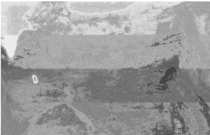
F.142410 Koekuoppa 520/270, länsiprofiili, sekoittunut kohta kaivettu pois, kuvattu idästä