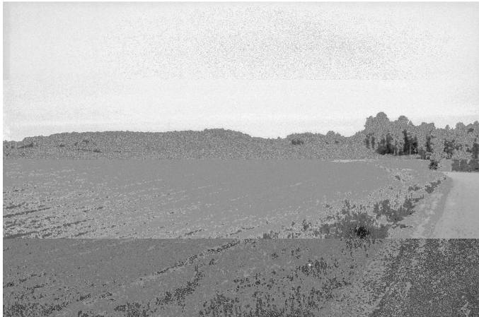
F.142408 Yleiskuva tutkimusalueelle, taustalla, pellon keskivaiheilla Laahus 2, kuvattu Laasolantieltä, koillisesta