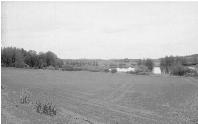
F.142407 Yleiskuva tutkimusalueelle, Laahus taustalla, pellon keskivaiheilla kohde Laahus 1, kuvattu luoteesta