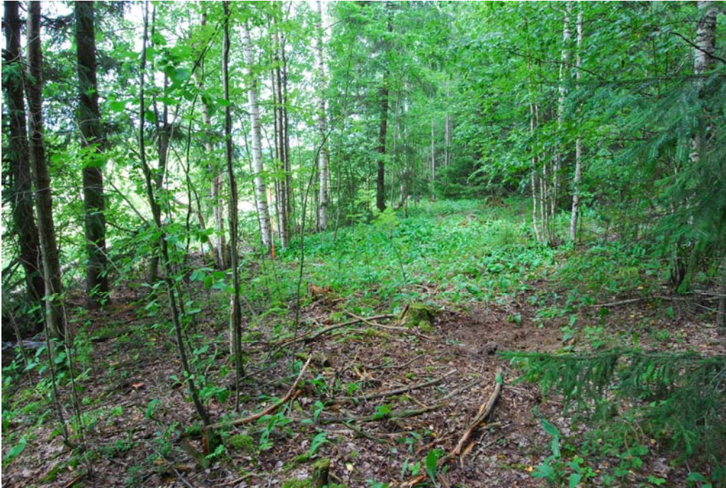
Kuva 3 (dia 60436). Asuinpaikkaa metsässä. Kuvattu itäkaakosta.