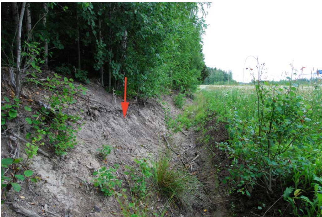
Kuva 2 (dia 603434). Kivikirves ja kvartsi-iskoksia löytyi kuvassa näkyvän ojan leikkauksesta noin 50 metrin matkalta. Kirveen löytöpaikka merkitty nuolella. Kuvattu luoteesta.