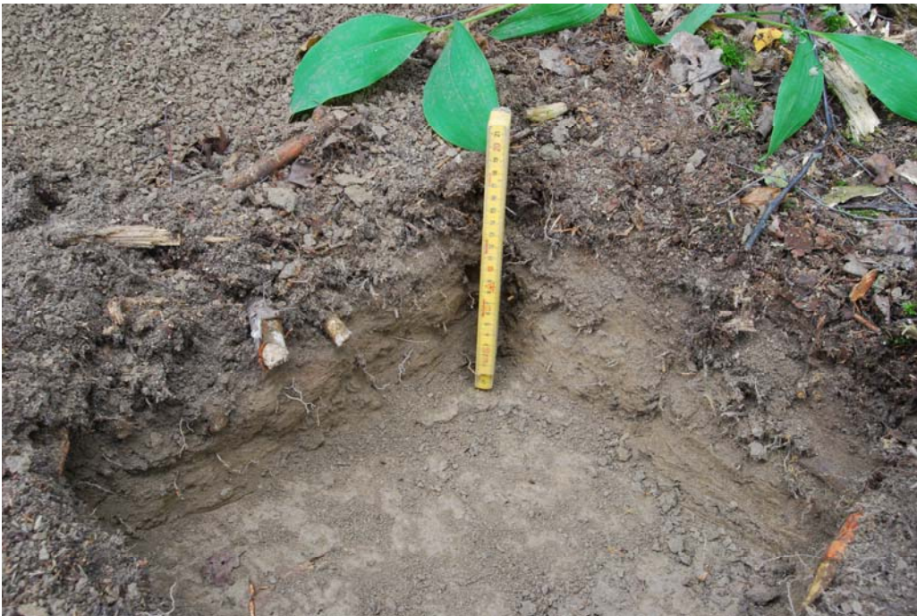
Kuva 5 (dia 60436). Koekuoppa 8. Maaperä on harmaan ruskeaa hiesua/savea.