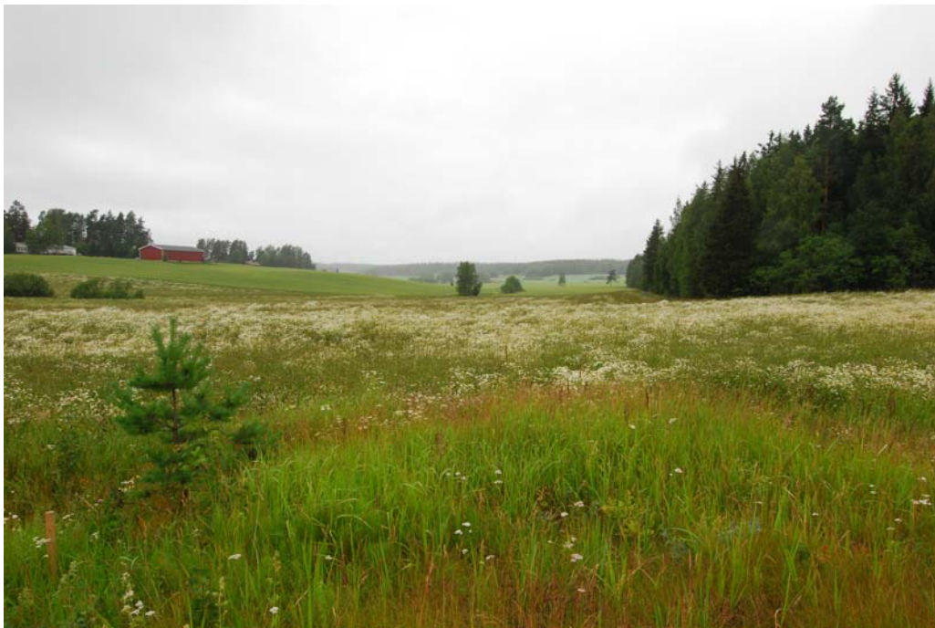
Kuva 1 (dia 60433). Männistön kivikautinen asuinpaikka sijaitsee kuvan oikeassa laidassa olevassa metsässä ja sen viereisellä pellolla. Kuvattu idästä, Hämeenlinnantieltä.