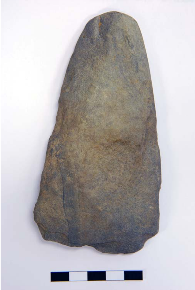
Kuva 5. Männistöstä löytynyt kivikirves (KM 36725:3)