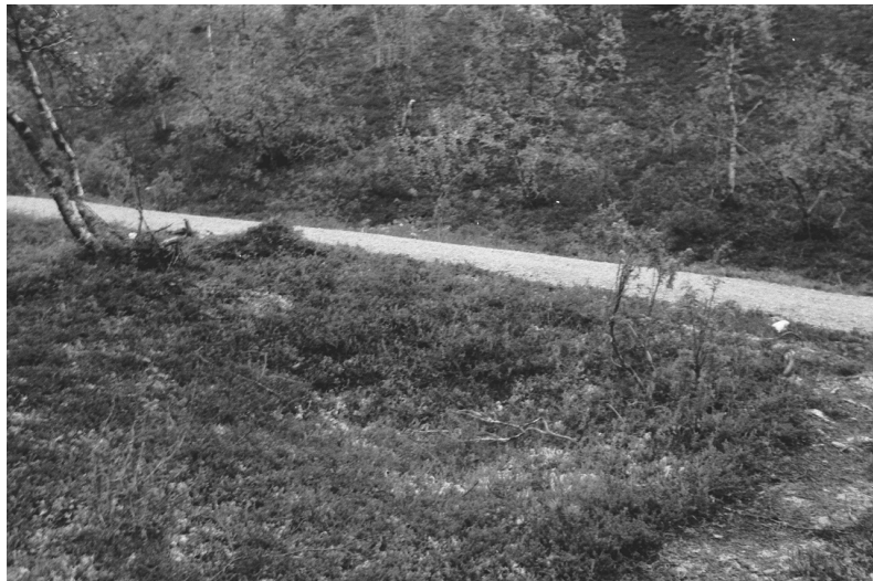
Kuva 26. Inari Luttojoki Kansallispuistoon 4. Pyyntikuoppa. Kuvattu lännestä. Neg. 136284