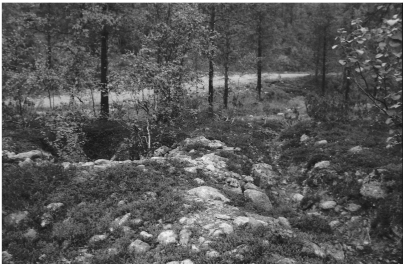
Kuva 24. Inari Luttojoki Kansallispuisto 3. Kullankaivuun liittyvä kuoppa ja oja. Kuvattu luoteesta. Neg. 136285