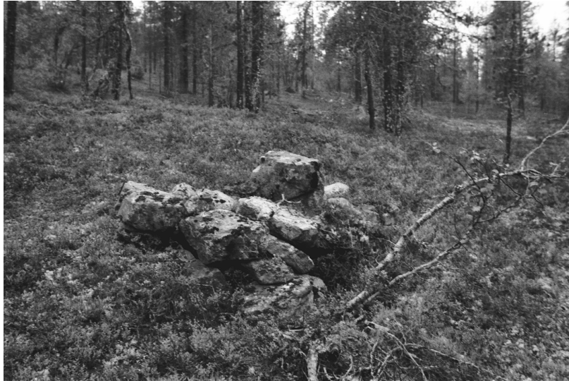
Kuva 8. Inari Luttojoki Laanilan tutkimusalue 8. Kullankaivuun liittyvä valtausmerkki. Kuvattu pohjoisesta. Neg. 136282