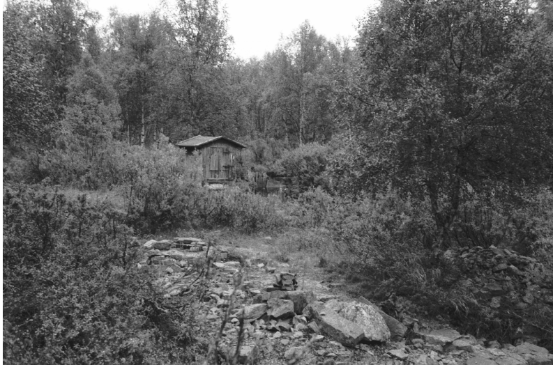
Kuva 20. Inari Luttojoki Saariselkä 4. Kullankaivuun liittyvä rakennelma. Kuvattu lounaasta. Neg. 136270