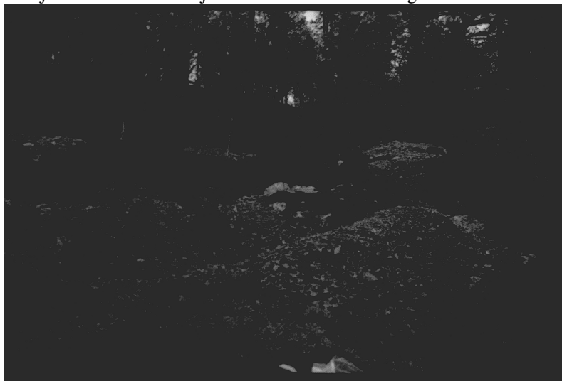
Kuva 12. Inari Luttojoki Kansallispuisto 1. Kullankaivuun liittyvä huuhdontakasa vastapäätä kämppää Luttojoen toisella puolella. Kuvattu luoteesta. Neg. 136262