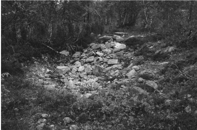
Kuva 5. Inari Luttojoki Laanilan tutkimusalue 5. Kullankaivuun liittyvä huuhtontakasa. Kuvattu idästä. Neg. 136279