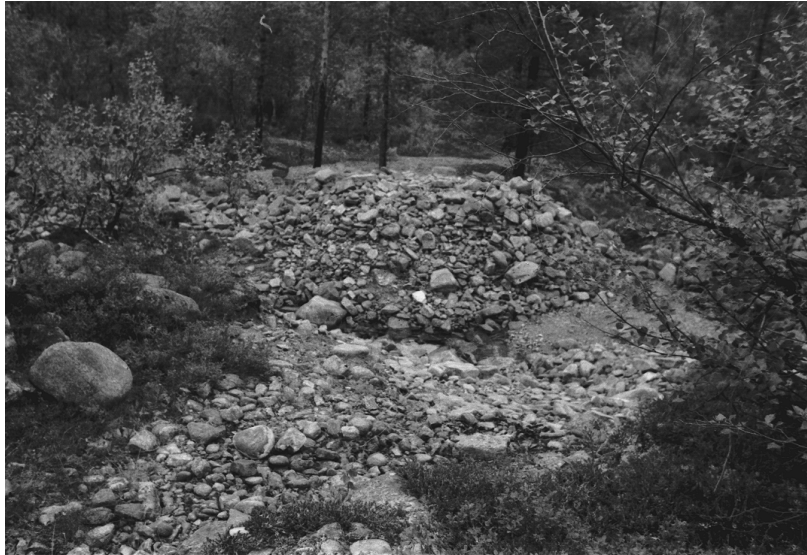
Kuva 25. Inari Luttojoki Kansallispuisto 3. Kullankaivuun liittyvä huuhtontakasa. Kuvattu luoteesta. Neg. 136286