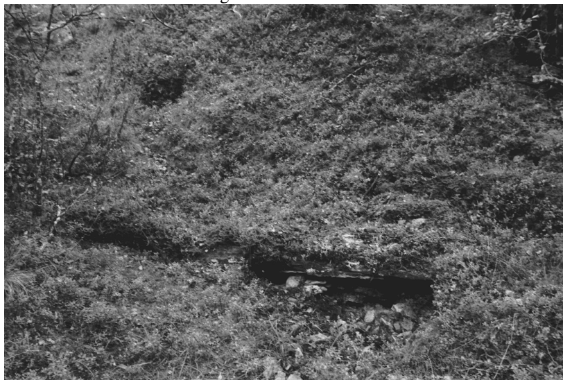
Kuva 6. Inari Luttojoki Laanilan tutkimusalue 6. Kullankaivuun liittyvä puinen patorakenne. Kuvattu luoteesta. Neg. 136280