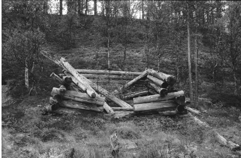
Kuva 11. Inari Luttojoki Kansallispuisto 1. Hirsikämpän jäänteet. Rakennus on todennäköisesti liittynyt kullankaivajien toimintaan Luttojoella. Kuvattu etelästä. Neg. 136261