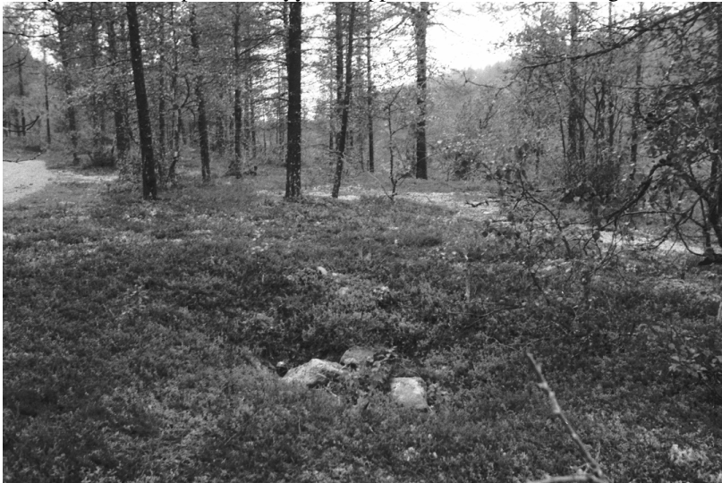
Kuva 23. Inari Luttojoki Kansallispuisto 2. Pyyntikuoppa, joka on täytetty isoilla lohkeilla. Kuvattu koillisesta. Neg. 136282