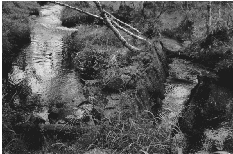
Kuva 17. Inari Luttojoki Saariselkä 2. Kullankaivuun liittyvä puurakenteinen pato. Kuvattu lounaasta. Neg. 136267