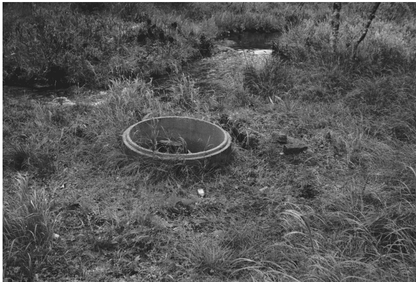
Kuva 18. Inari Luttojoki Saariselkä 3. Kullankaivuun rakenteen jäännös. Kuvattu lännestä. Neg. 136268