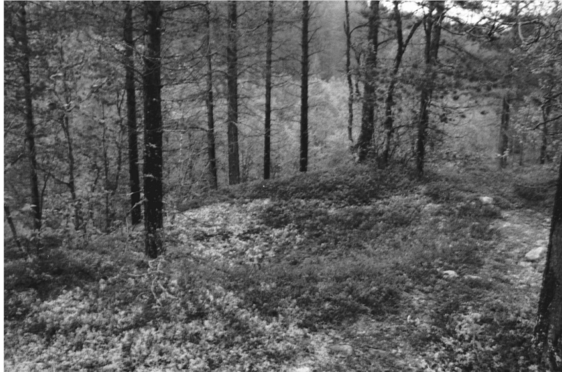
Kuva 22. Inari Luttojoki Kansallispuisto 2. Pyyntikuoppa. Kuvattu etelästä. Neg. 136283