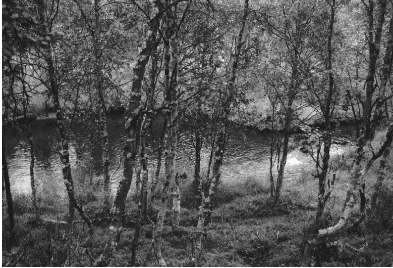
Kuva 19. Inari Luttojoki Saariselkä 3. Kullankaivuun liittyviä hajonneita puurakenteita joessa. Kuvattu lännestä. Neg. 136269