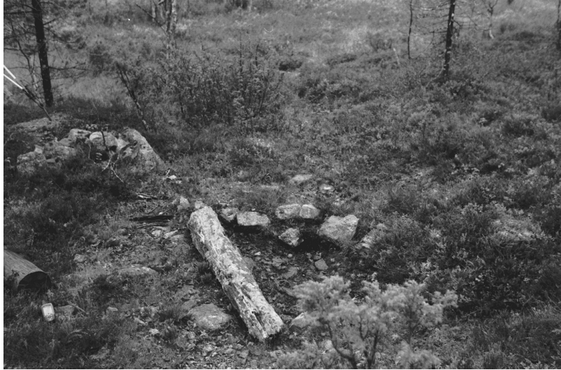
Kuva 7. Inari Luttojoki Laanilan tutkimusalue 7. Kullankaivuun liittyvä, kivistä ladottu patorakenne. Kuvattu pohjoisesta. Neg. 136281