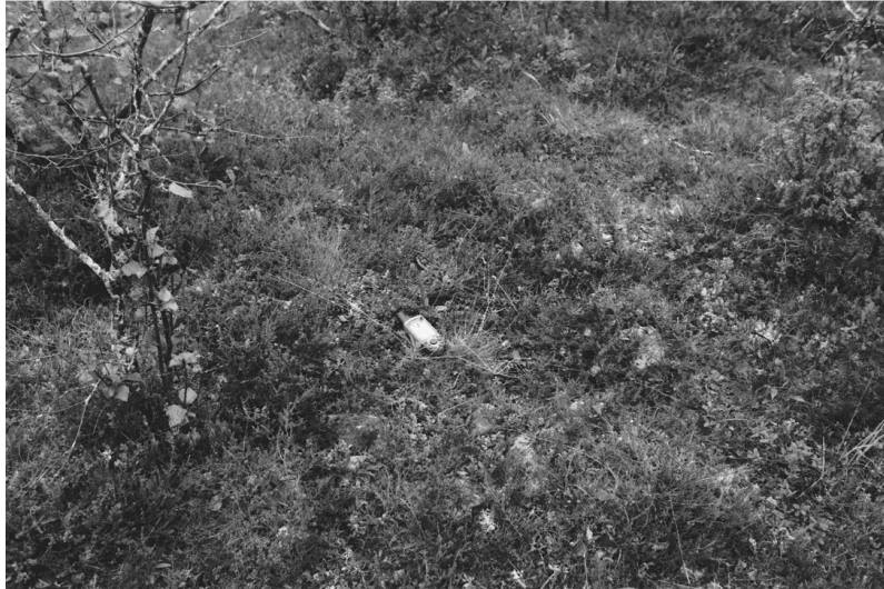
Kuva 4. Luttojoki Laanilan tutkimusalue 4. Soikeanmallinen kivikehä, mahdollinen liesi. Kuvattu lounaasta. Neg. 13627