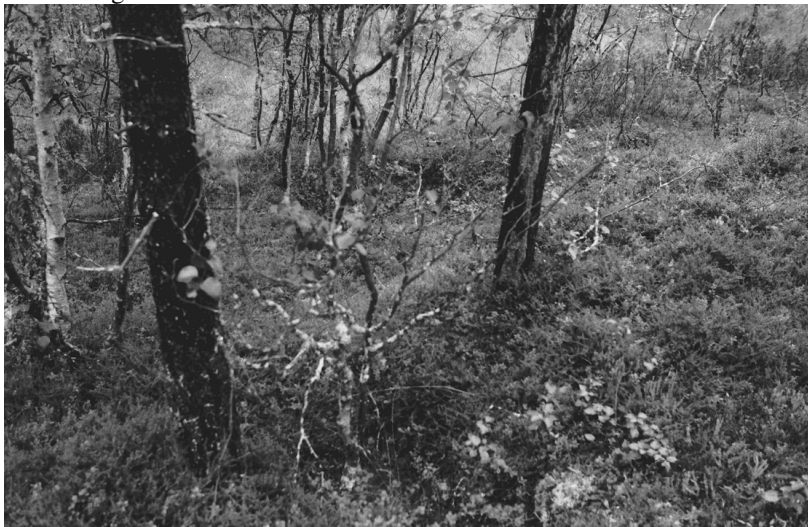
Kuva 3. Luttojoki Laanilan tutkimusalue 3. Kullankaivuun liittyvät kuopat. Kuvattu etelästä. Neg.136277