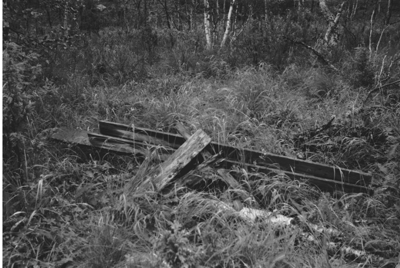
Kuva 10. Inari Luttojoki Laanilan tutkimusalue 10. Kullankaivuun liittyvä huuhdontakouru. Kuvattu etelästä. Neg. 136275