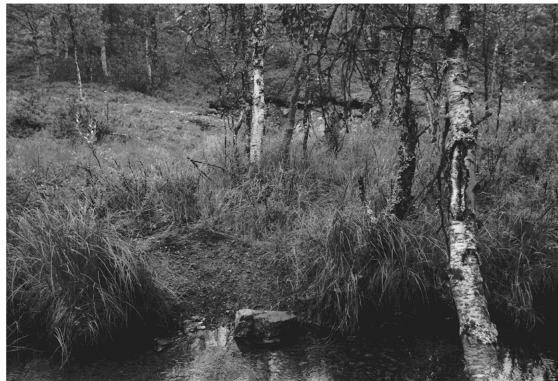
Kuva 21. Inari Luttojoki Laanilan tutkimusalue 11. Kullankaivuun liittyvä huuhdontakasa. Kuvattu luoteesta. Neg. 136271