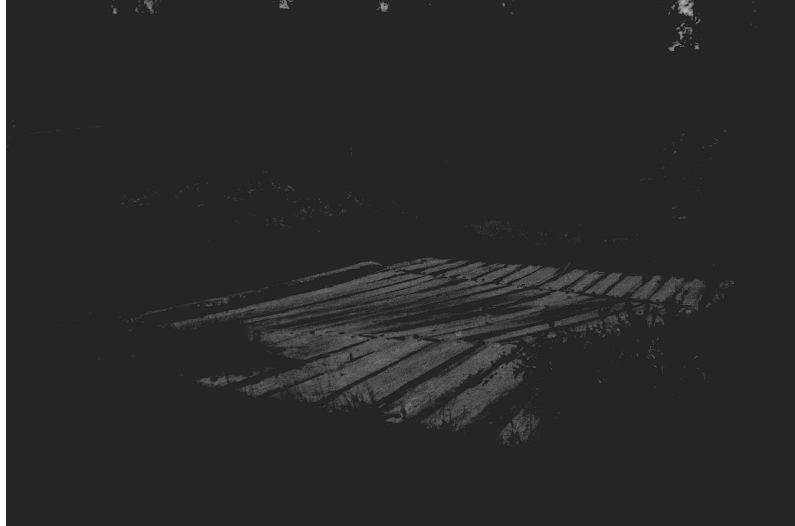
Kuva 13. Inari Luttojoki Inari Luttojoki Kansallispuisto 1. Silta joka menee Luttojoen yli. Silta saattaa liittyä kullankaivajien toimintaan paikalla. Kuvattu idästä. Neg. 136263