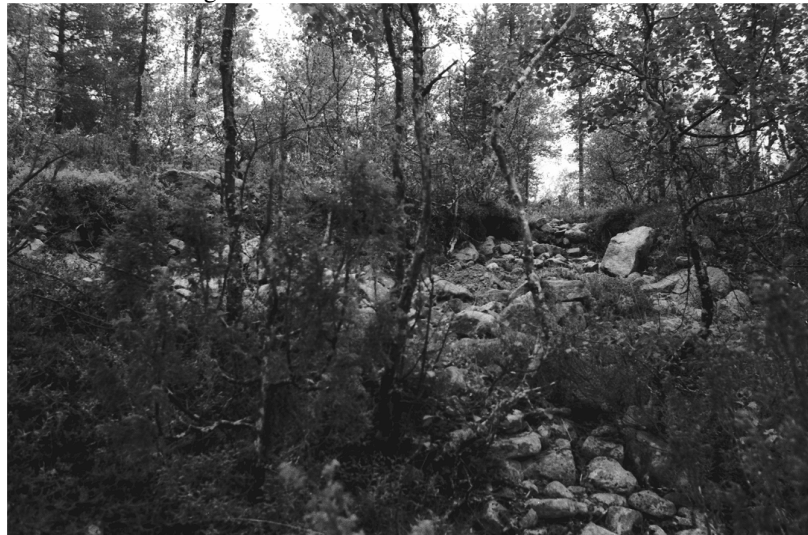
Kuva 2. Luttojoki Laanilan tutkimusalue 2. Kullankaivuun liittyvä huuhdontakasa. Kuvattu koillisesta. Neg. 136276