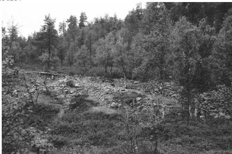
Kuva 15. Inari Luttojoki Saariselkä 1. Toinen kullankaivuun liittyvä Huuhdontakasa. Kuvattu koillisesta. Neg. 136265