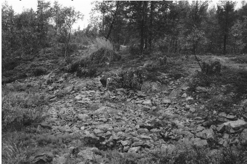
Kuva 14. Inari Luttojoki Saariselkä 1. Kullankaivuun liittyvä huuhtontakasa. Kuvattu etelästä. Neg. 136264