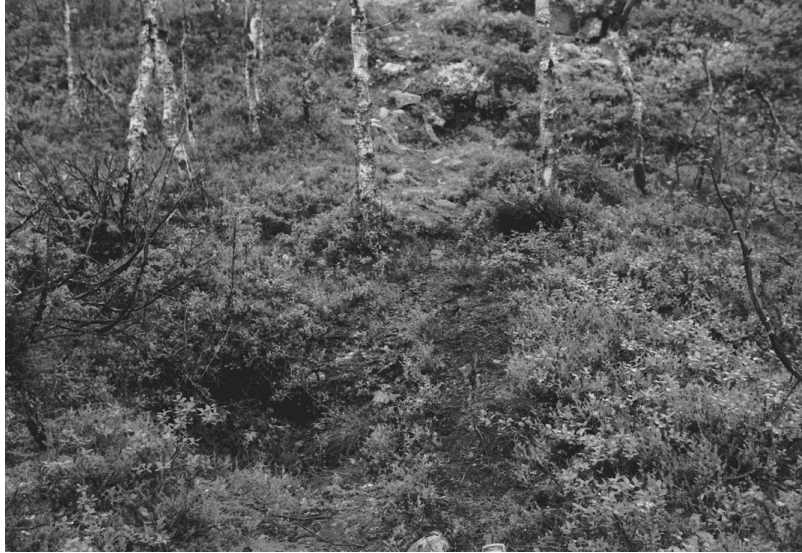
Kuva 16. Inari Luttojoki Saariselkä 2. Kullankaivuun liittyvät kuopat. Kuvattu koillisesta. Neg. 136266