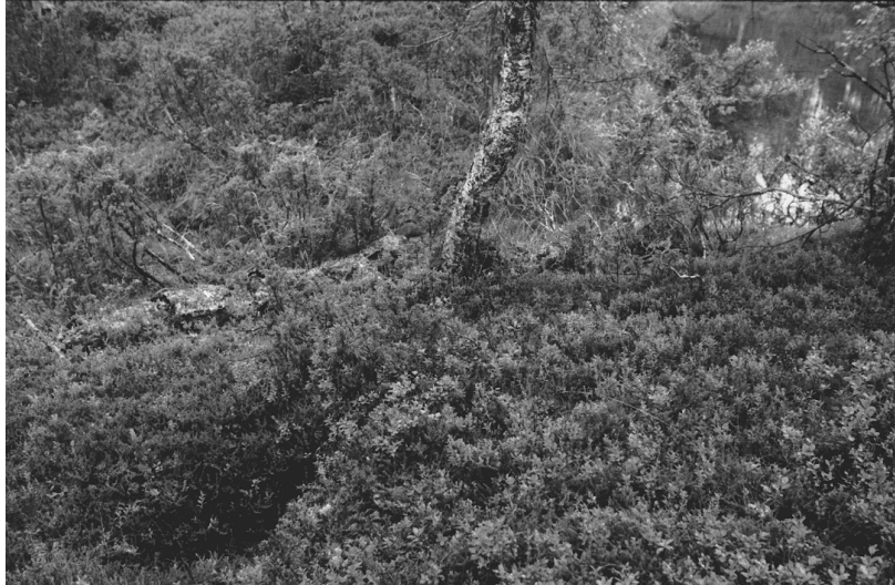
Kuva 1. Luttojoki Laanilan tutkimusalue 1. Kullankaivuun liittyvä pato purossa koivun vasemmalla puolella. Padon edessä toimintaan liittyvä kuoppa. Kuvattu koillisesta. Neg. 136272