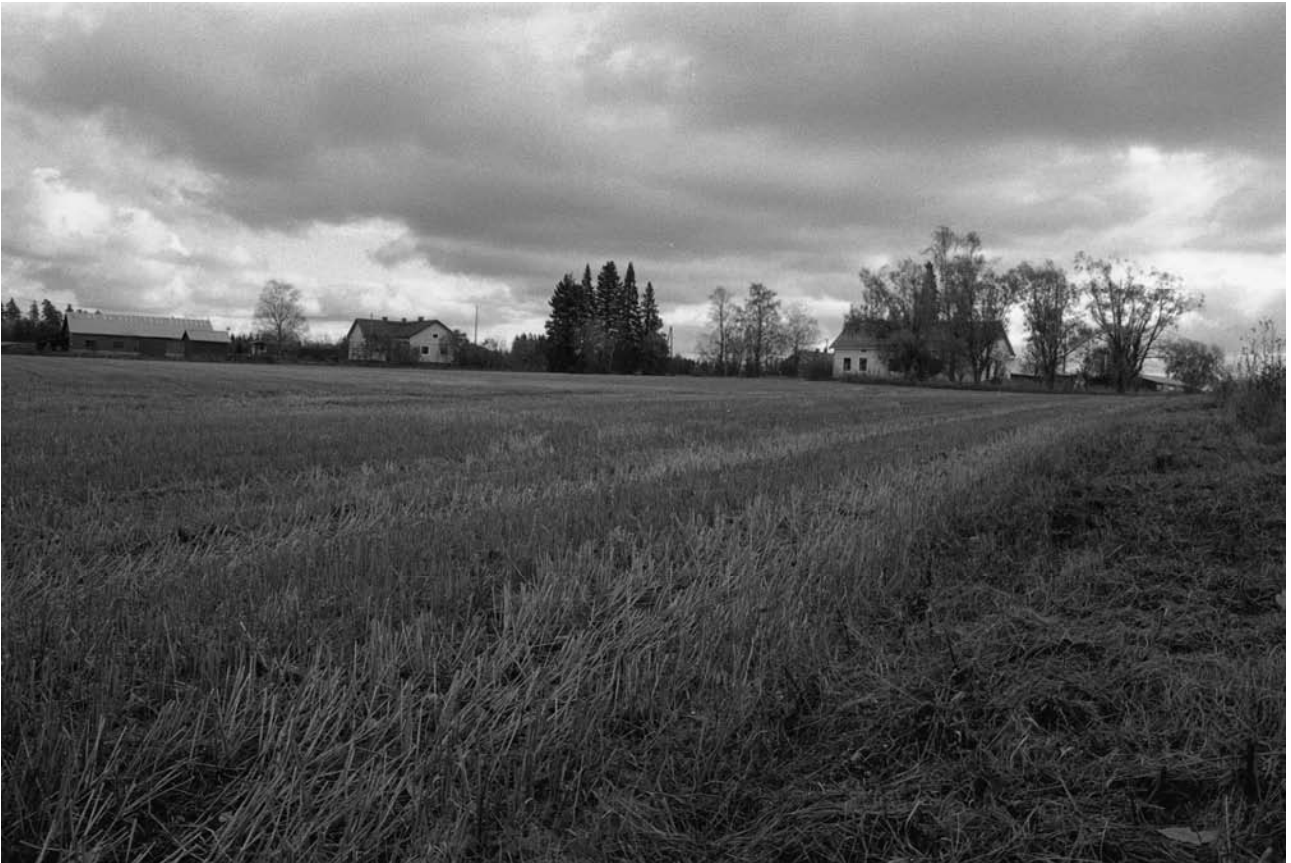
Janakkala Rastila. Keski aikaista kylää voi olla vielä jäljellä pellolla talojen läheisyydessä ja talojen piholla. Luoteesta.