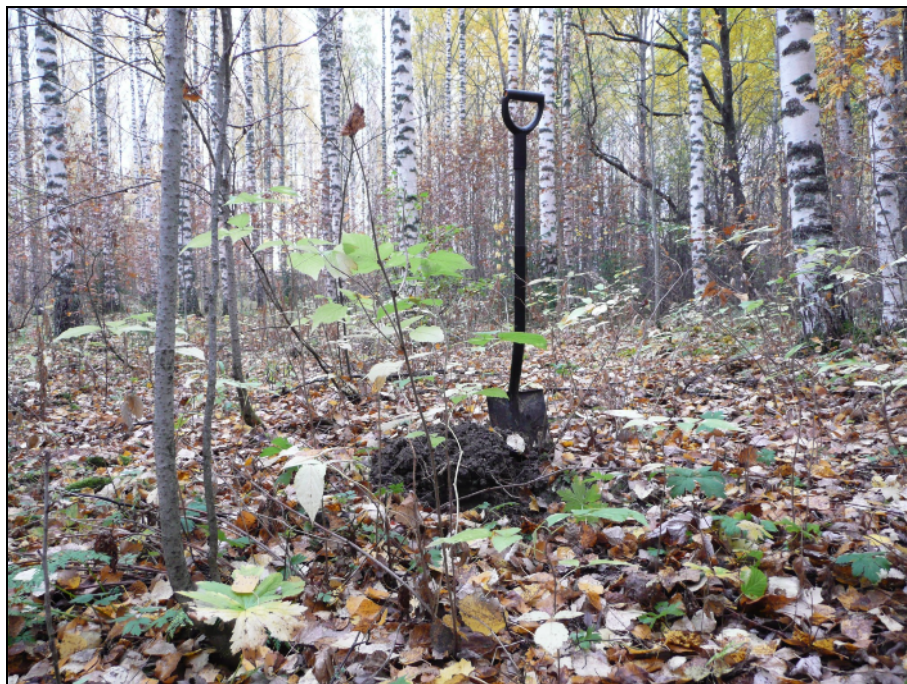
Metsittyntä peltoa venesataman ja sahan välisellä alueella. Ennen Kyrösjärven laskua paikalla on ollut järvelle pistävä niemi. Maalaji alueella savimultaa.