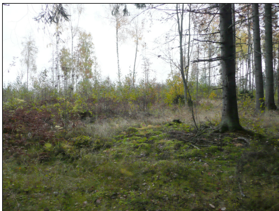
Kyröskoskenharjun alarinteiden kuusikkoa ja pusikoitunutta hakkuualuetta kaava-alueen keskivaiheilla.