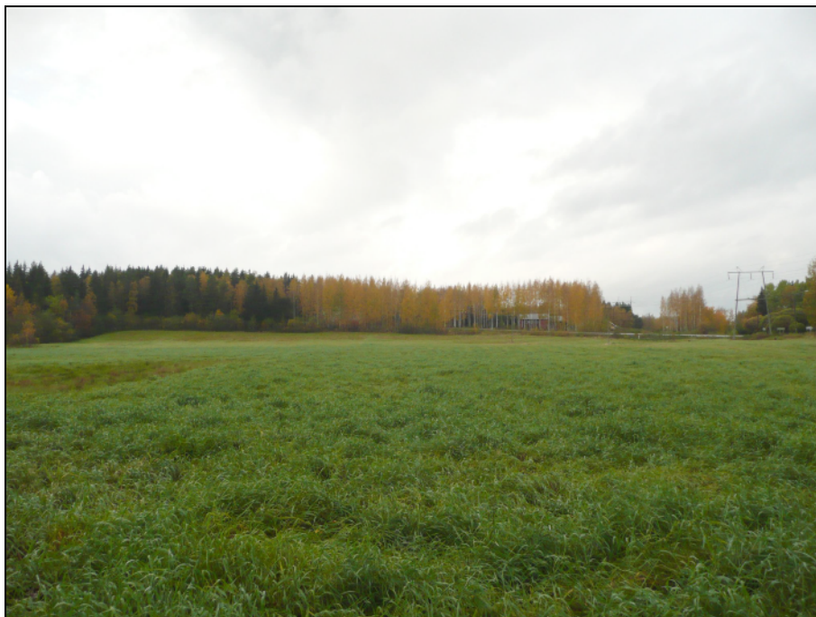
Kaava-alueen luoteisosassa oleva pelto on nurmella