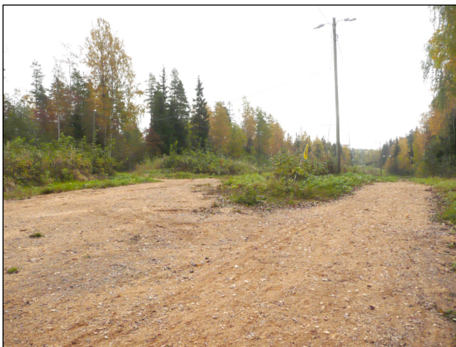
Kaava-alueen vielä rakentamattomilla alueilla risteilee ulkoilureitti