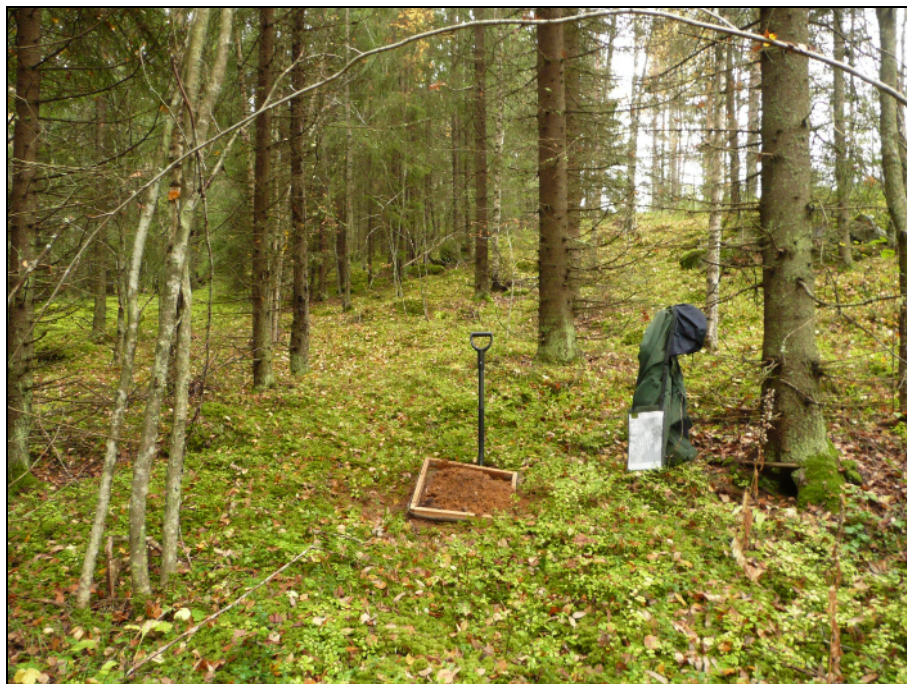
Kyröskosken harjun lakialue ja ylärinne on lajittunutta hiekkaa 3-tien vieressä kaava-alueen länsiosassa. Kuvassa koekuoppa josta otettu maa seulottiin.