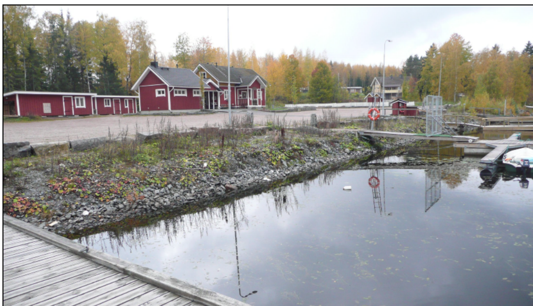
Venesatama kaava-alueen pohjoisosassa Kyrösjärven rannalla