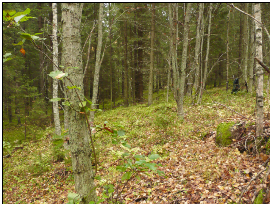
Kyröskoskenharjun muinainen Ancyclusjärven rantaterassi.