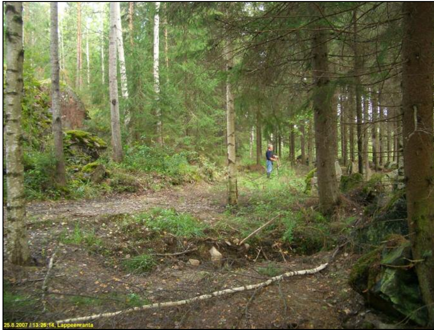
Panssariesteen pohjoispäätä oikealla, kuvattu pohjoiseen, vas. kalliorinteessä pieni louhos.