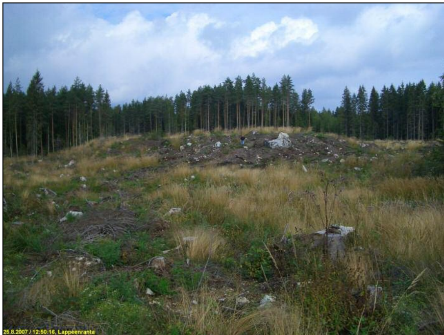
Alueen tyypillinen pinnanmuoto ja maaperä näkyy hyvin hakkuuaukealla.