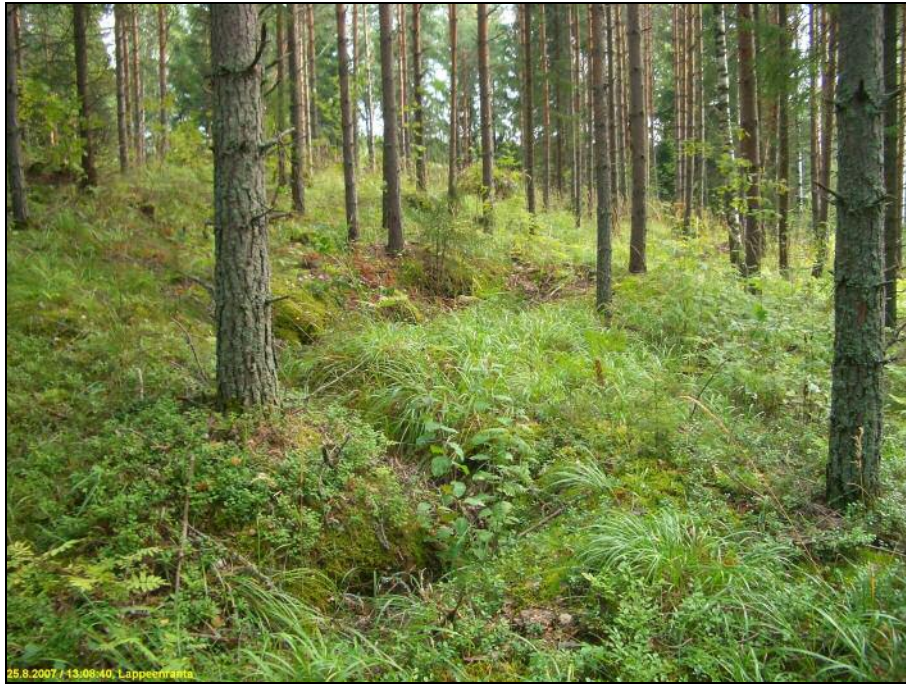
Sortunut juoksuhauda ja sen päässä (kauempana) oleva pesäke, Kuvattu itään Märkäläntien laidalta.