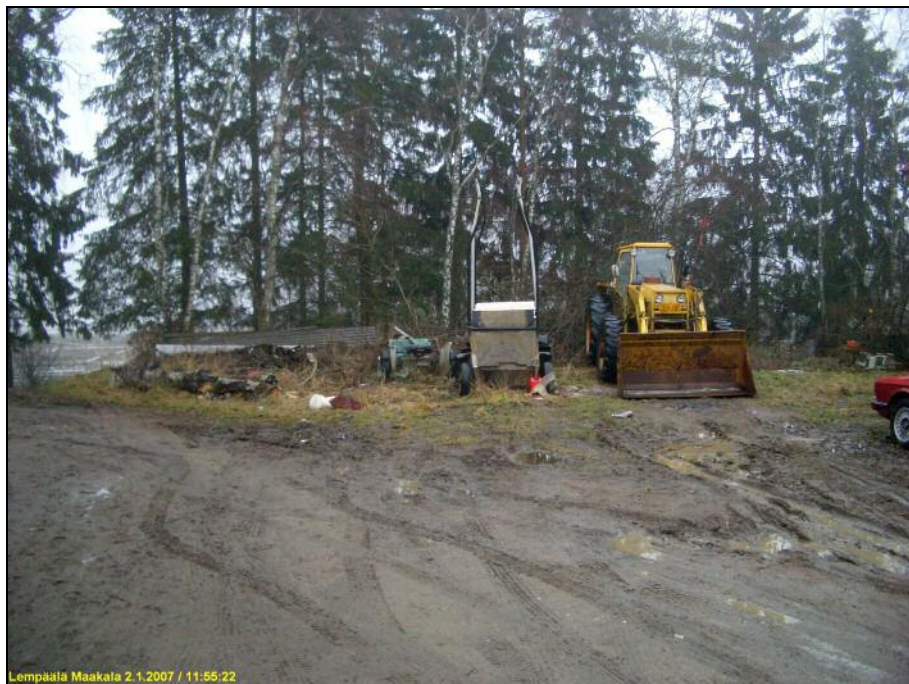
Koekuoppa asuinrakennusten välisellä alueella, kuvassa keskellä olevien rattaiden takana