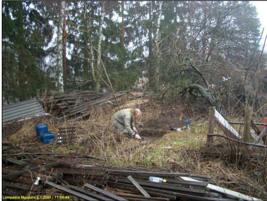
Koekuoppa kaivetaan pihamaalla, päärakennuksen kaakkoispuolella. taustan puut ovat vanhalla rantatörmällä. Kuopan sijainti: y 2487 466 x 6799 686.