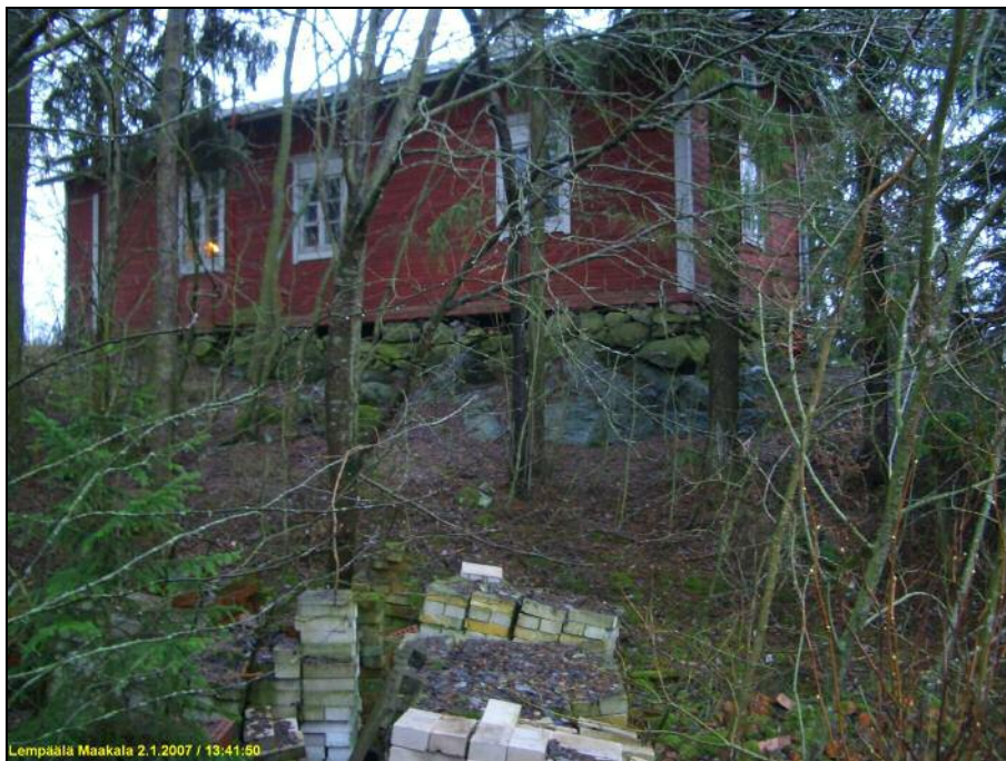
Kumpulan talon länsipuoli ja kallionnurkka. Alla Kumpulan talon itäpuoli, pengerretty laki.