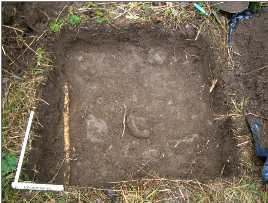
Koekuoppa, jossa on kaivettu pois pinnassa ollut löytökerros, sen alla vanhemman ajan sekoituneen kerroksen pinta

Koekuoppa, puhdas ja koskematon pohjamaa on kaivettu esille.