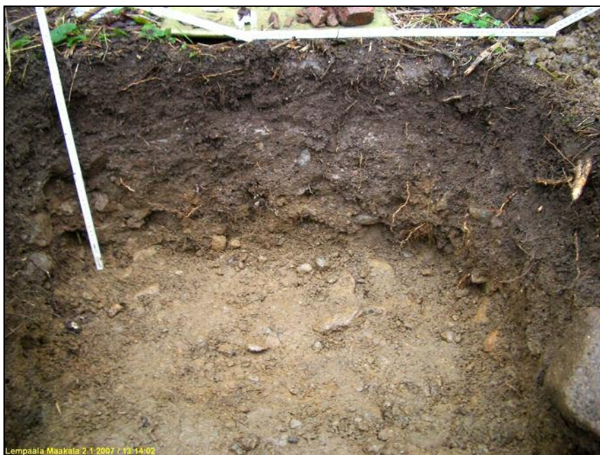
Koekuopan itäseinämä. Ei merkkejä vanhemmasta kulttuurikerroksesta. Alla eteläseinämä.