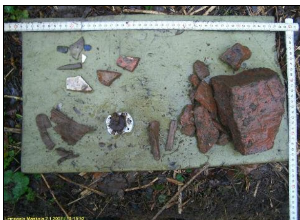
Kuopan pintaosan antia.