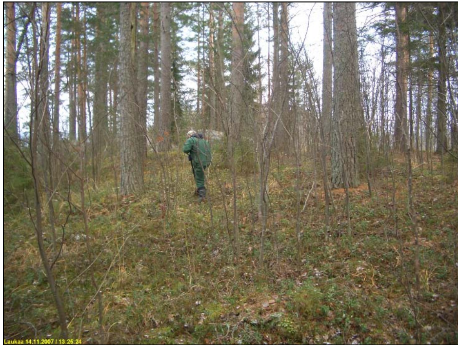
Asuinpaikkaa kuvan alalla lakitasanteen länsireunalla. Kuvattu Pohjoiseen. Ks. myös kansikuva.