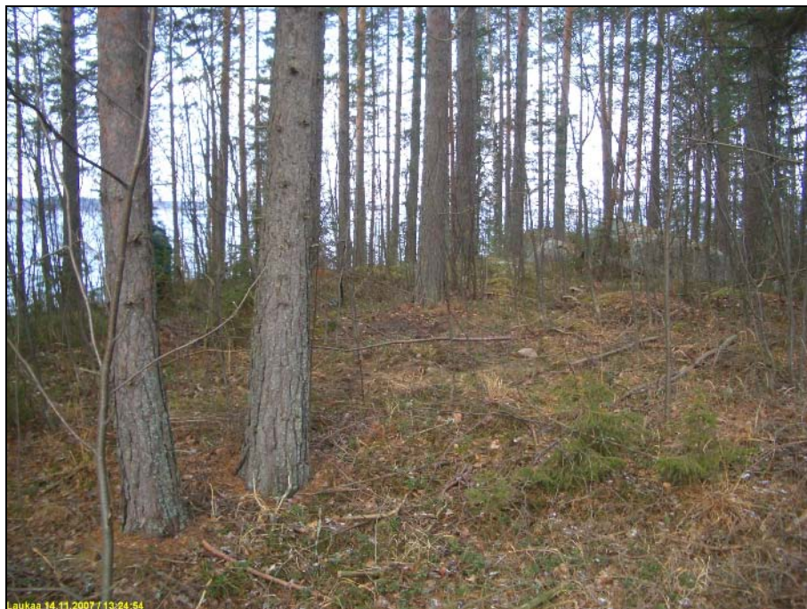
Asuinpaikan lounaisosaa, mistä löydöt, kuvattu pohjoisluoteeseen.