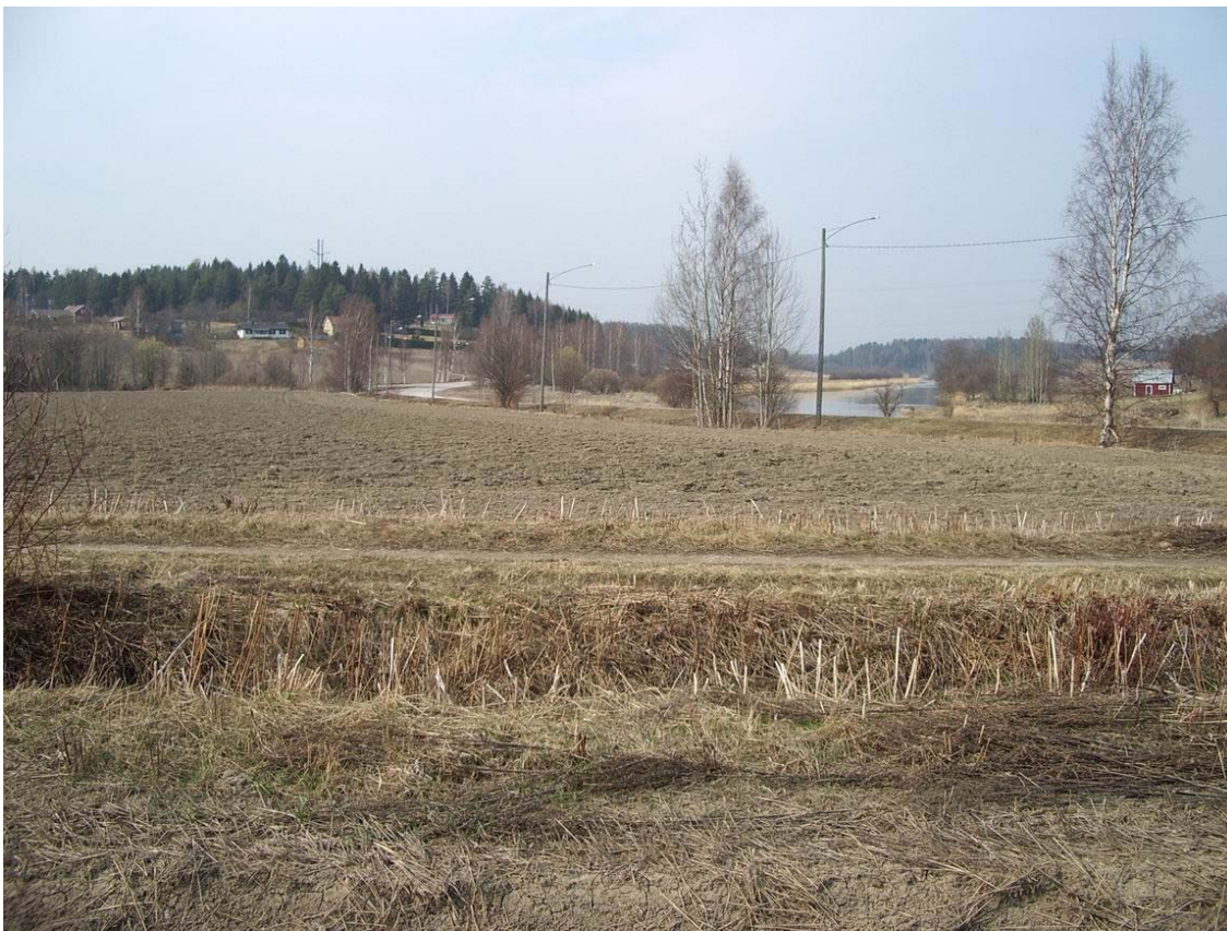
Kuva 3. Kuva on otettu löytöpaikalta 2 luoteeseen. Vastapäätä näkyy Blåkullan mäki ja Krogarsin talo.