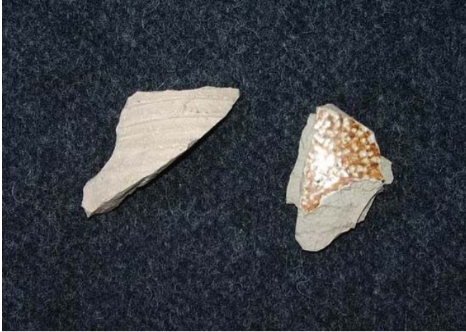
Kuva 2. 1300-luvun Siegburg- kannun pala ja 1500- luvulle ajoitettava parta- miehen kannun pala löytöpaikalta 2. KM 2006098:1 ja 2.