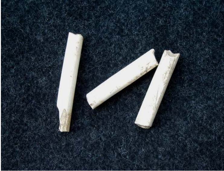
Kuva 4. Kolme liitupiipun varren katkelmaa löytöpaikalta 3.

Veli-Pekka Suhosen inventointikertomuksen (2003) mukaan markkinapaikan on arveltu sijainneen paikassa, jossa puro laskee Porvoonjokeen ja joki tekee mutkan. Puron varresta Saksalaan johtavan tienhaaran eteläpuolelta löytyi kolme koristelematonta liitupiipun varren pätkää (kuvat 4 ja 5), muttei muita markkinapaikkaa mahdollisesti indikoivia löytöjä. Piipunvarsia ei talletettu. Pelto on ko. kohdalla melko alavaa, eikä kohde vaikuta erityisen sovelialta markkinapaikaksi. Löytöpaikka on merkitty karttaan 3 numerolla 3.