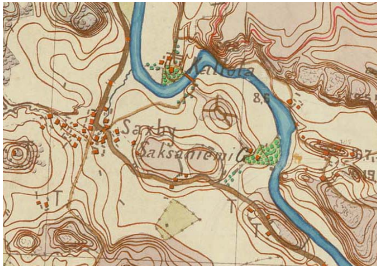
Porvoon Saksala senaatinkartassa vuonna 1873.