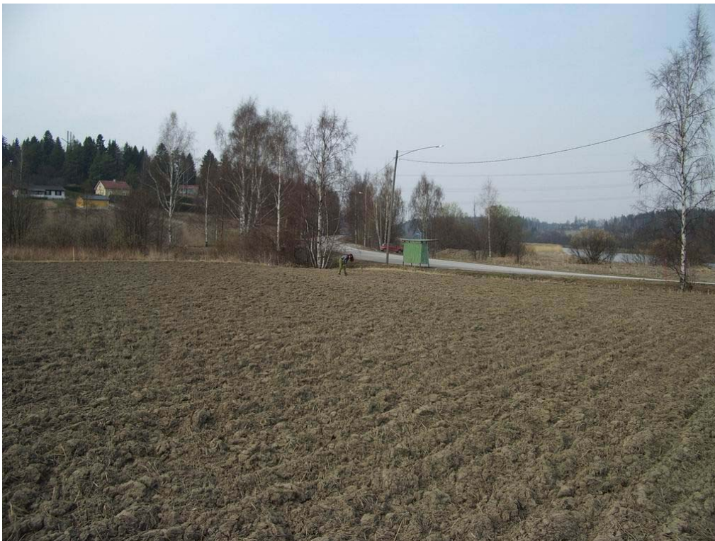
Kuva 5. Löytöpaikka 3, kuva pohjoiseen. Porvoonjokeen laskeva puro virtaa pellon takana olevien koivujen luona.