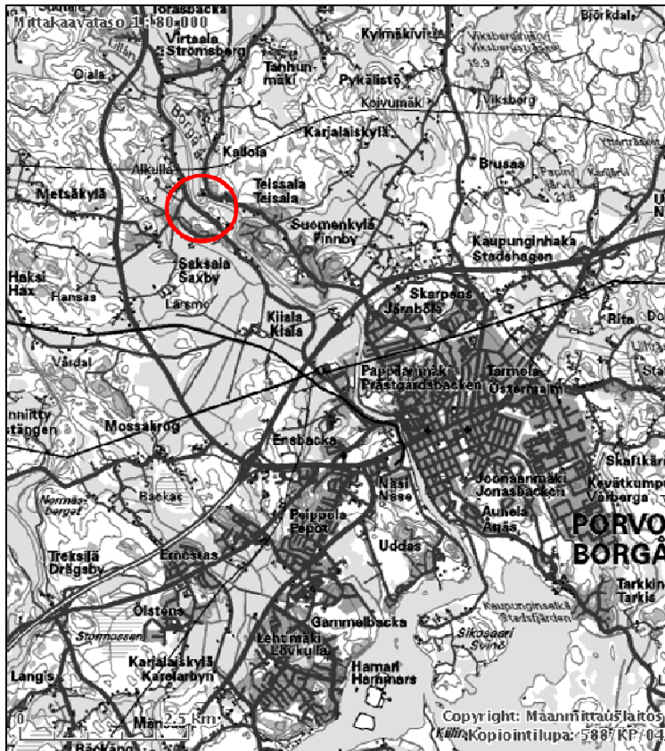
Kartta 1. Tutkimusalueen sijainti Porvoonjoen varressa Saksalan kylän kohdalla.