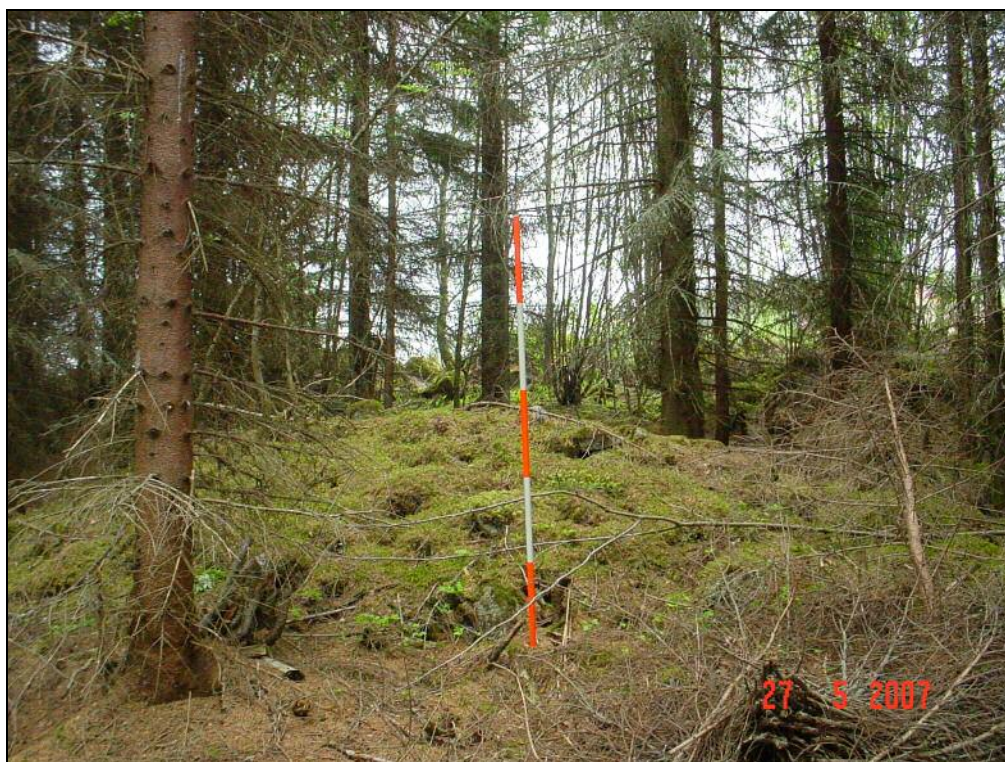
Viljelyröykkiö B (2)