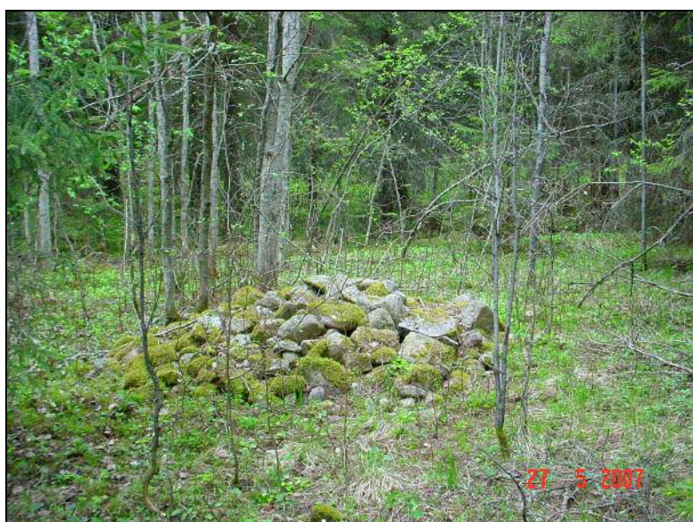
Viljelyröykkiö A (1)