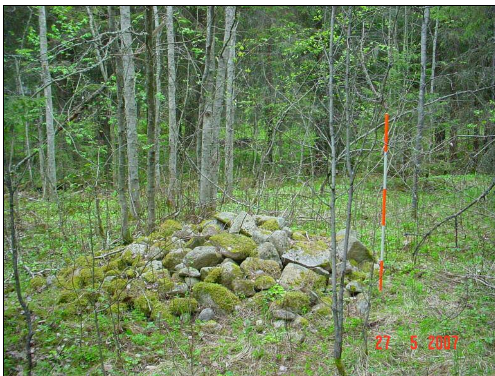
Viljelyröykkiö A (3)