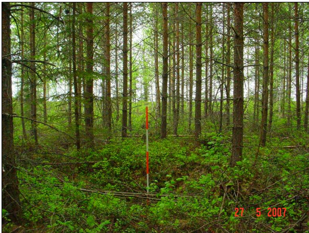
Hiilimiilun jääne C