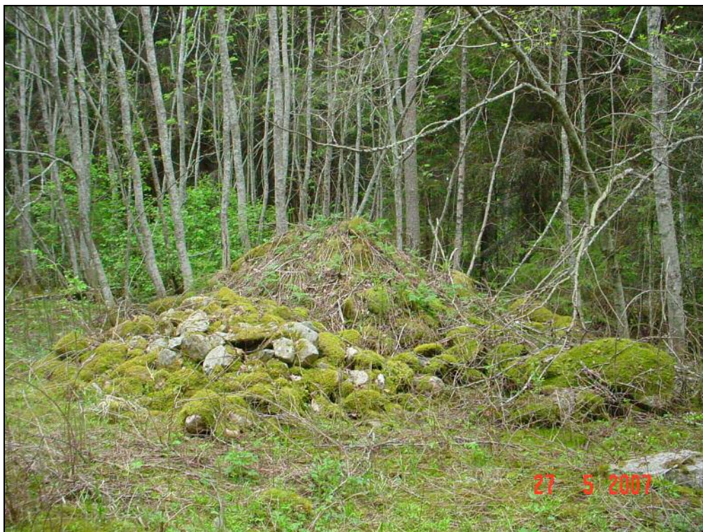
Viljelyröykkiö A (2)