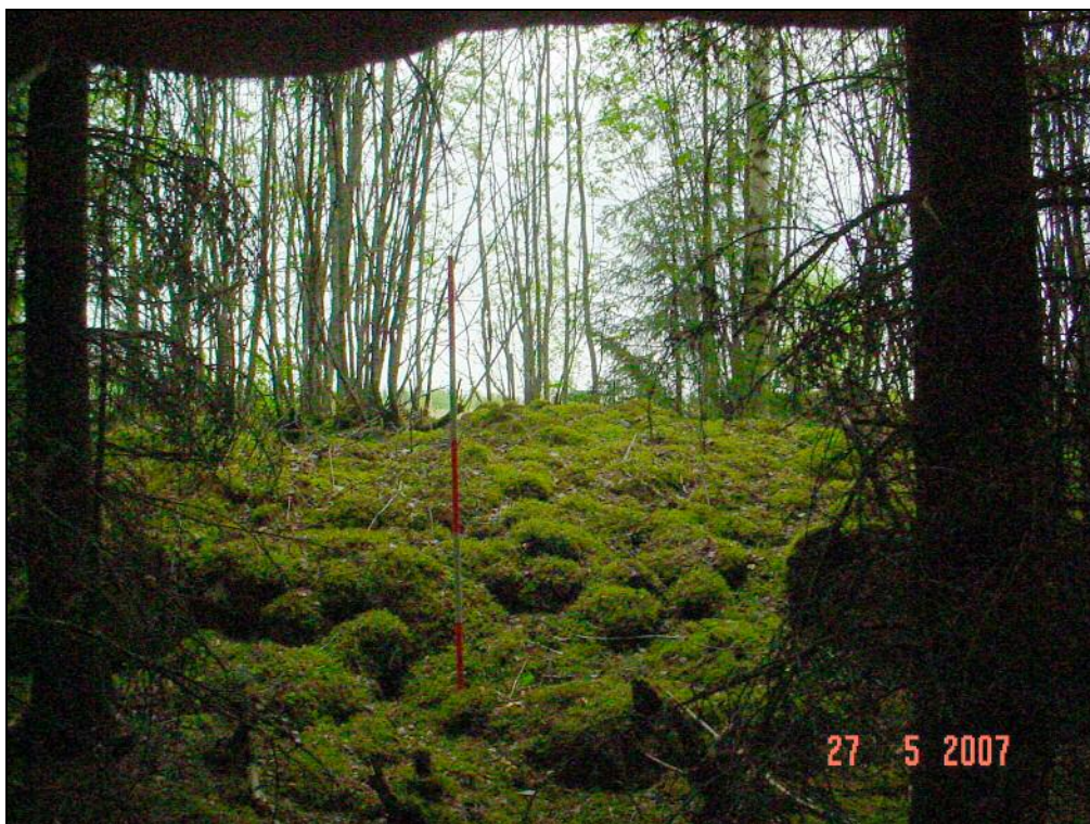
Viljelyröykkiö B (1)