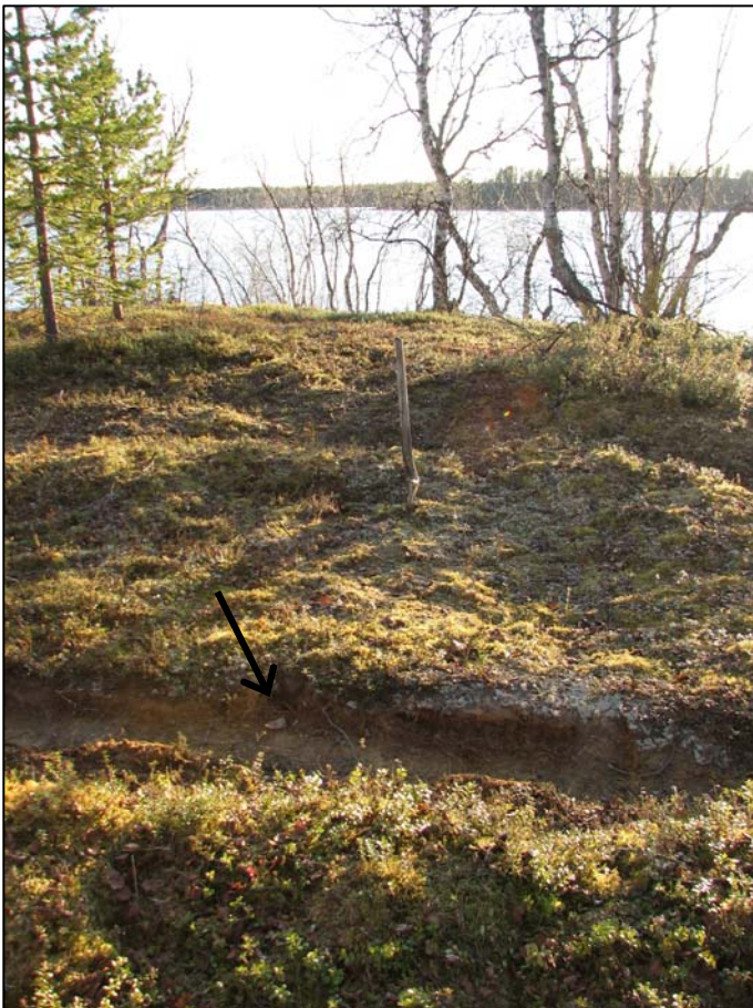
Kuva 2. Kuvassa näkyy puhdistettua polun pintaa ja taustalla lapiolla merkitty koekuopan paikka sekä rantaterassin reunaa (kuvaussuunta 275°). Nuoli osoittaa kahta palanutta kiveä. Niiden oikealla eli pohjoispuolella polun profiilissa näkyy tummaa kulttuurikerrosta ja hiiltä vajaan metrin matkalla.