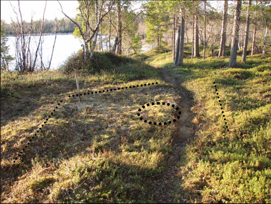
Kuva 3. Lapiro on pystyssä koekuopan kohdalla. Koekuopasta löytyi hiiltä ja kulttuurimaaläikkiä (kuvaussuunta 10°). Liesikiveyksen sijainti on merkitty kuvan keskelle paksulla katkoviivalla. Matalat vallit on merkitty pienemmällä katkoviivalla.