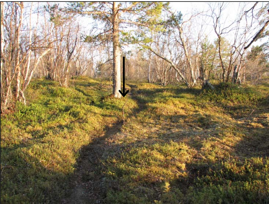
Kuva 4. Liesikiveys on merkitty maastoon oksalla (kuvaussuunta 185°). Yöauringon alhaalta paistavassa valossa kiveystä ympäröivät matalat vallit näkyvät selvästi. Kuva E. Ojanlatva