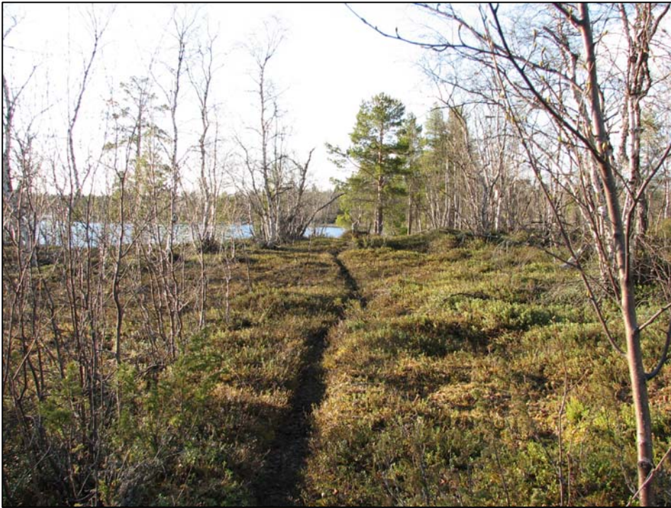
Kuva 1. Käyräniemen asuinpaikka kuvattuna samalta paikalta kuin vuonna 1983, (kuvaussuunta 355°). Puustoa on huomattavasti harvennettu. Polun mutkan jälkeen on tasanne, johon tehtiin koekuoppa ja joka kairattiin 50x50 cm verkolla.