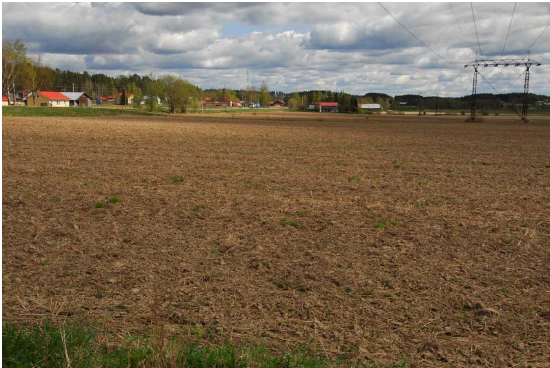
Tammela, Portaan kylä. Voimalinja kulkee kylän eteläpuoleisella peltoaukealla. Kuvattu lännestä. (DG146)

Voimajohto kulkee Portaan suojelualueen läpi, mutta kuitenkin siinä määrin etelämpänä pellolla, että siellä tuskin on keskiaikaan tai historialliseen aikaan liittyviä jäännöksiä, ainakaan niistä ei ole merkintään kartta-aineistossa eikä mitään siihen viittaavaa myöskään löydetty inventoinnin yhteydessä.