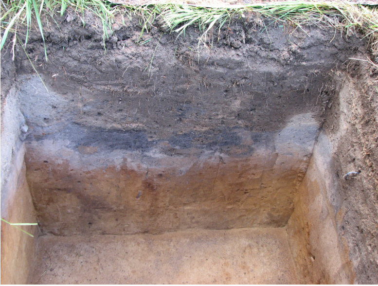
DG339:6 Koekuoppa 500/95, kaivettu n. 80 cm kyntökerroksen alapuolelle, kuvattu luoteesta