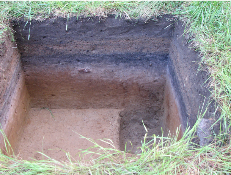
DG339:9 Koekuoppa 500/100, kaivettu 80 cm Kuvattu luoteesta