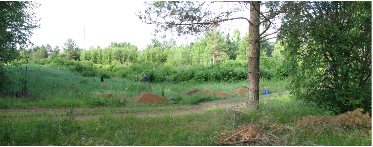
DG339:2 Tutkimusalue ja koeoja sekä niiden pohjoispuolinen, entinen kantamaantie, pohjoisesta