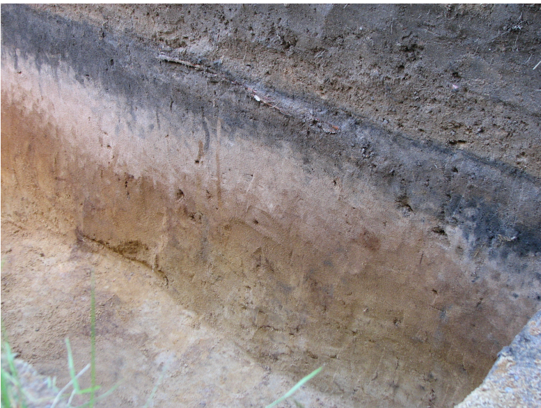
DG339:11 Koeojan profiili linjalta x = 500, Ruuduista y = 98-99, idästä