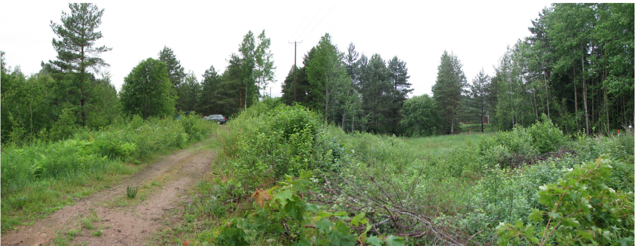
DG339:1 Tutkimusalue oikealla, pensaikon takana olevalla pellolla, vasemmalla tien kohdalla ollut entinen ratalinja, kuvattu etelästä.