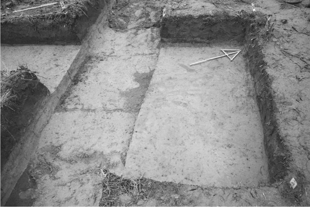
Pylväs 124, kaivausalueen II laajennukset, taso 1. Kuvattu eteläkaakosta