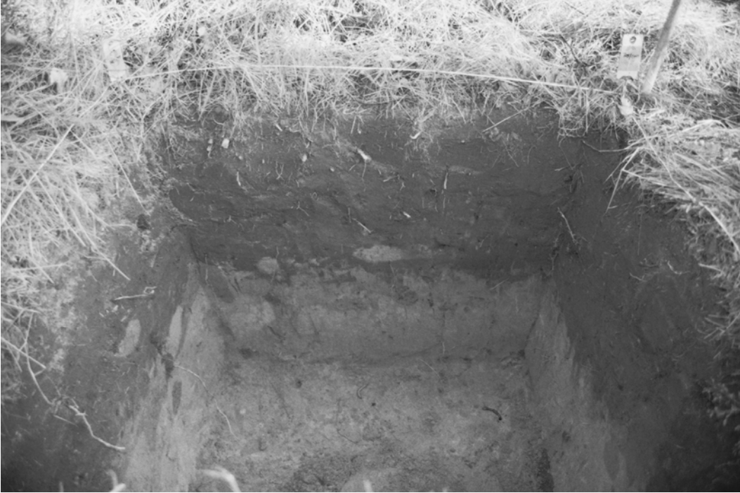
Pylväs 124, koekuoppa 705 / 299. Koillisprofiili lounaasta päin nähtynä.