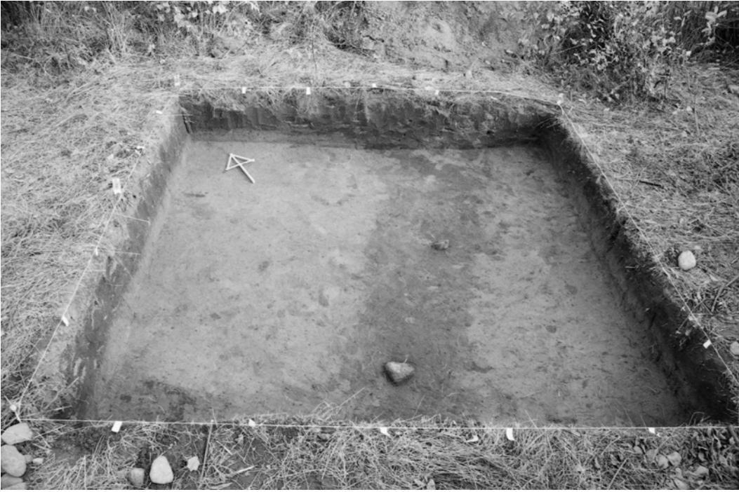
Pylväs 124, kaivausalue I, taso 2. Kuvattu lounaasta.