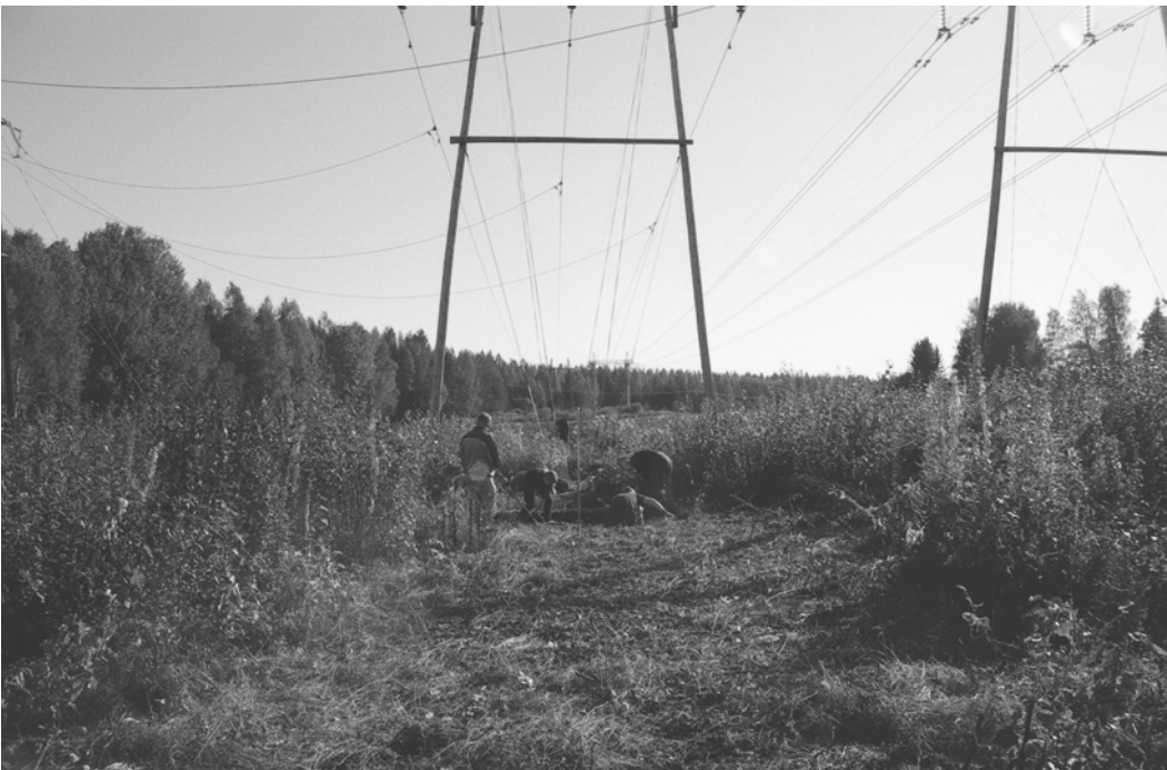
Pylväs 124, kaivausalue I, peltokerroksen poisto. Kuvattu länsiluoteesta.