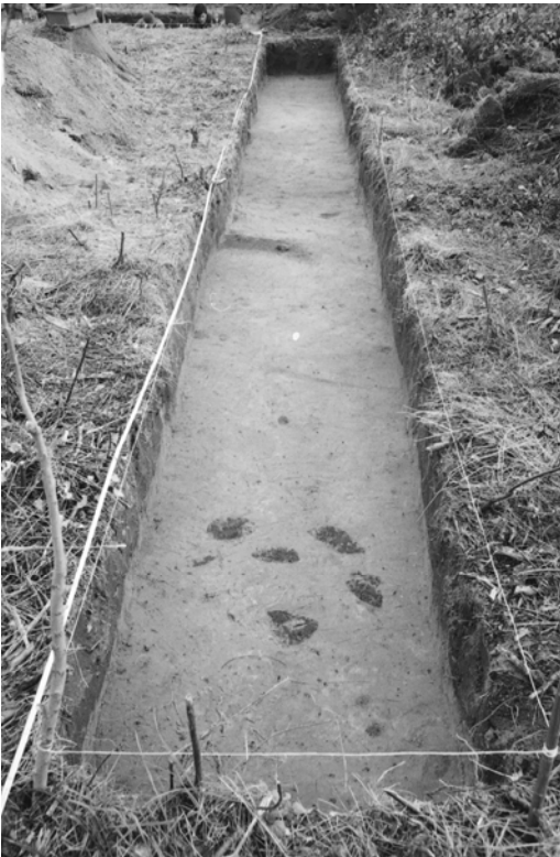
Pylväs 124, kaivausalue II, taso 0. Multaisia läikkiä vaaleassa hiekassa. Kuvattu luoteesta.