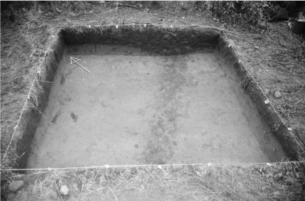
Pylväs 124, kaivausalue I, taso 4. Kuvattu lounaasta.