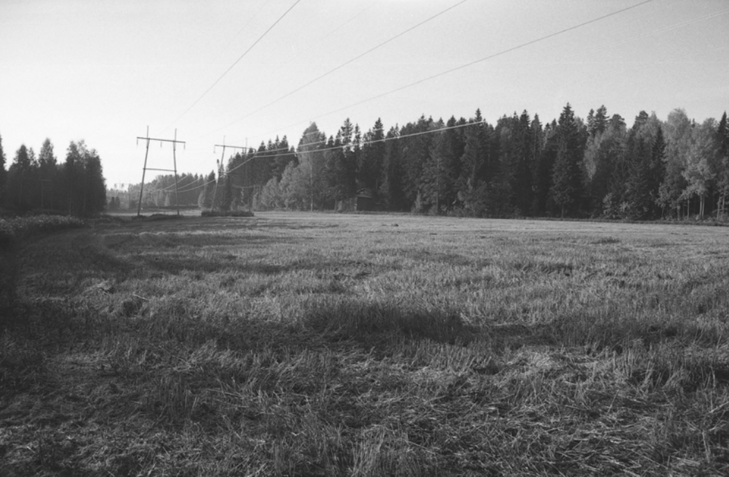
Pylväs 122 sekä peltoaluetta. Kuvattu pohjoiskoillisesta.