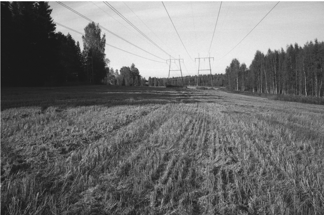
Pylväs 122 sekä peltoaluetta. Kuvattu etelästä.