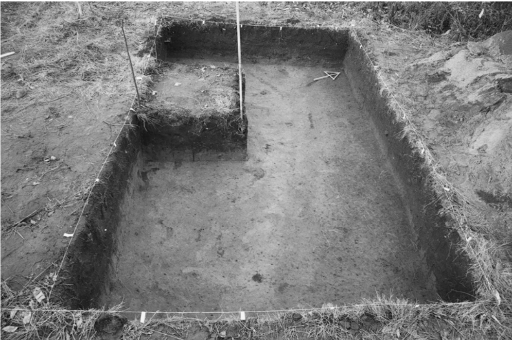
Pylväs 124, kaivausalue III, taso 3. Toisen kuonanpalan löytymisen jälkeen. Kuvattu kaakosta.