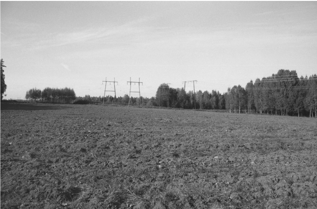
Pylväs 124. Katselusuunta kaakosta.