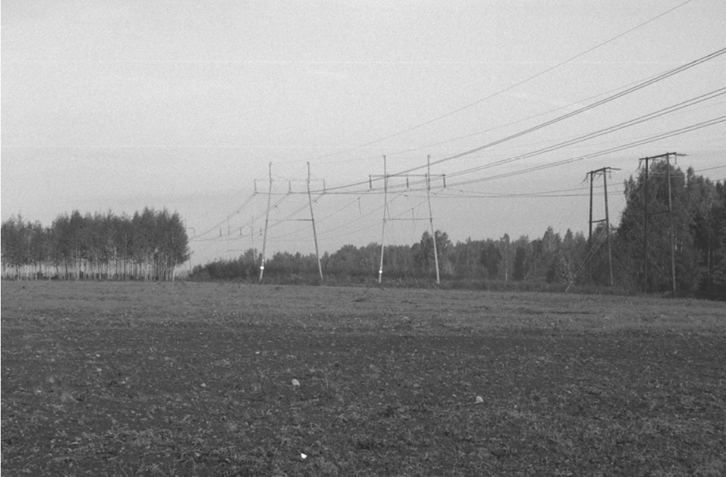
Pylväs 124 sekä irtolöytöalue etualalla. Katselusuunta kaakosta.