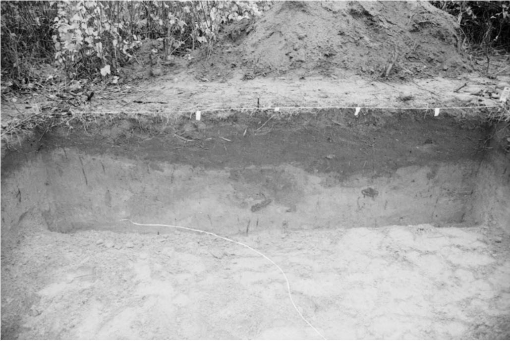
Pylväs 124, kaivausalue I, lounaisprofiili. Kuvattu koillisesta.