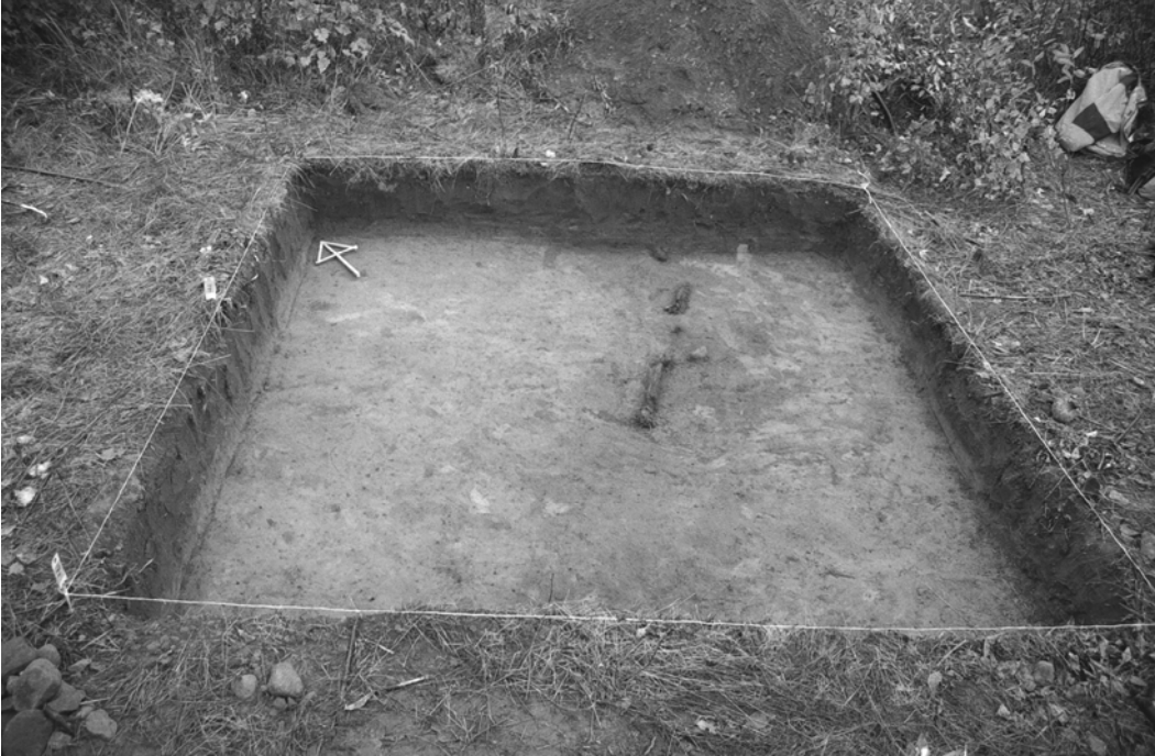
Pylväs 124, kaivausalue I, taso 1. Näkyvissä oja puunjäänteineen. Kuvattu lounaasta.