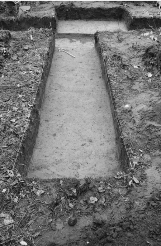
Pylväs 124, kaivausalueen II laajennukset, taso 1. Kuvattu lounaasta.