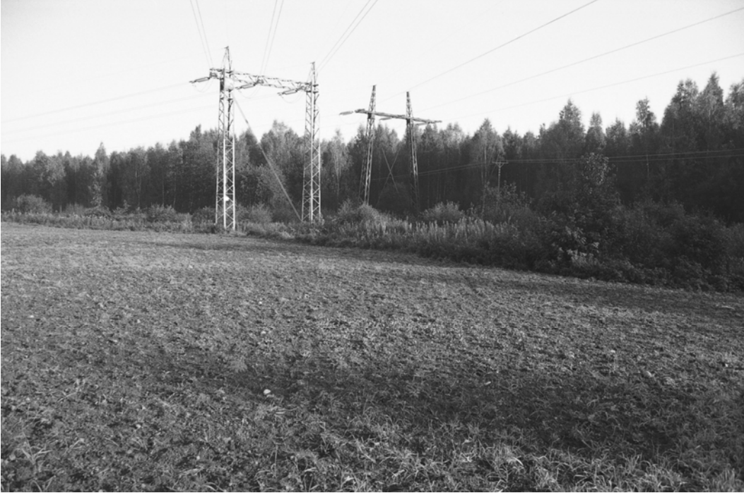
Yleiskuva, pylväs 123. Kuvaussuunta lounaasta.