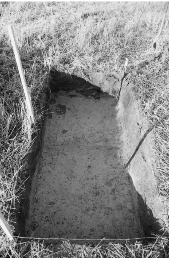
Pylväs 122, koekuoppa 1092 / 299-300. Peltokerroksen alainen pohjamaa. Kuvattu idästä.