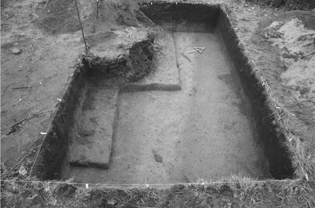
Pylväs 124, kaivausalue III, taso 4. Harmaa hiekka näkyy hyvin. Kuvattu kaakosta.