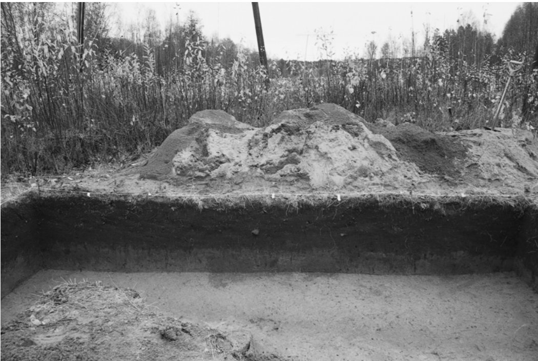
Pylväs 124, kaivausalue III, koillisprofiili. Kuvattu lounaasta.