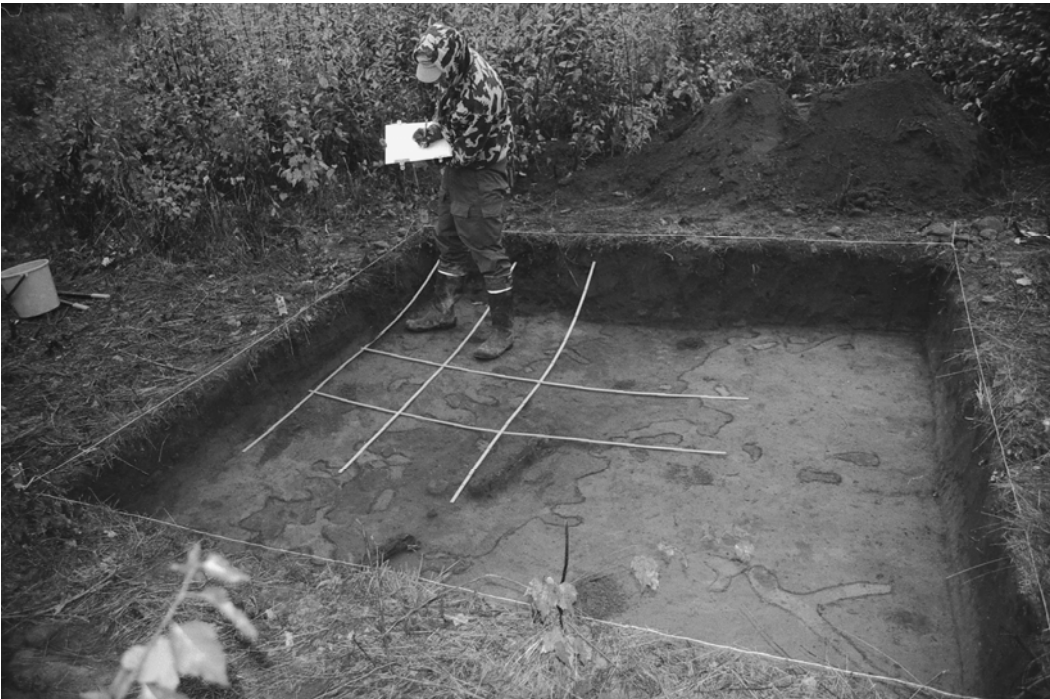
Pylväs 124, kaivausalue I, taso 1. Mikko Suha piirtämässä. Kuvattu koillisesta.