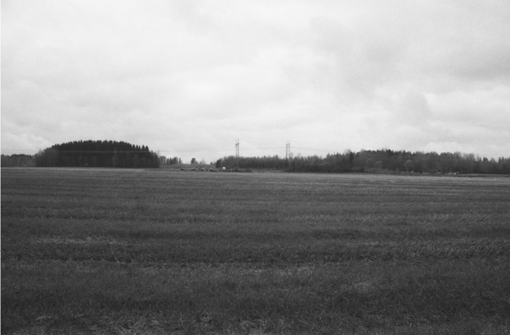
Kaivausalue nähtynä idästä päin.