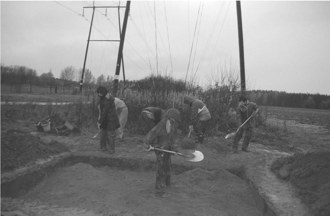
Kaivausalueen 1 täyttöä koko ryhmän voimin. Kuvattu etelästä.