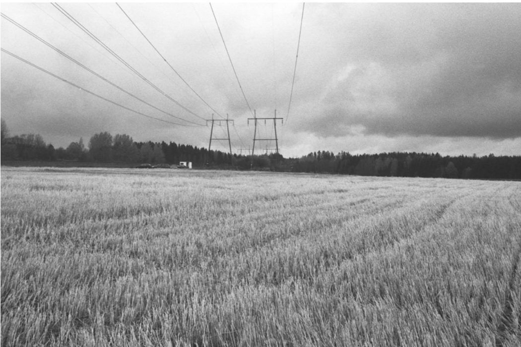
Kaivausalue nähtynä etelästä. Kuvaussuunta pohjoiseen.