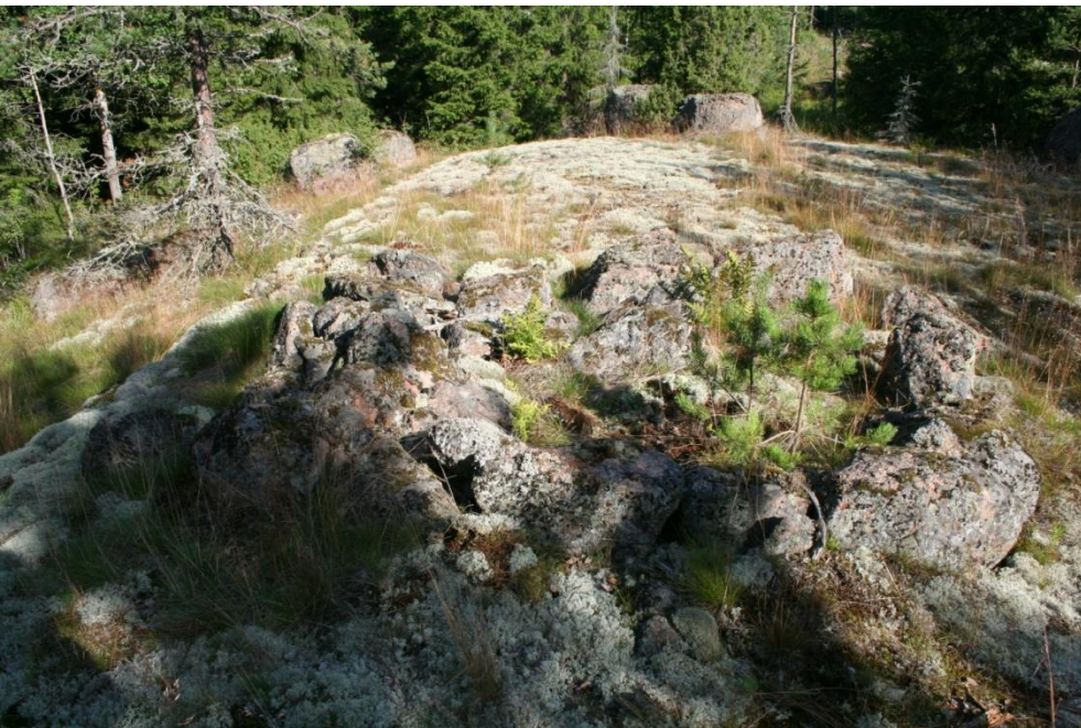
DG681:2. Kivirakenne. Idästä.