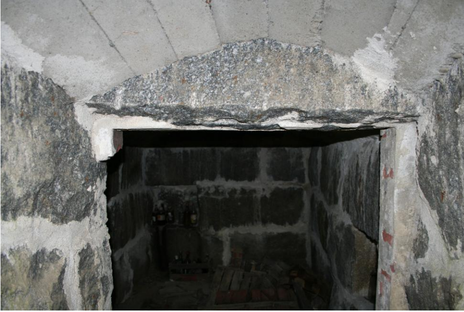
Kellarin sisäpuoli. Idästä.