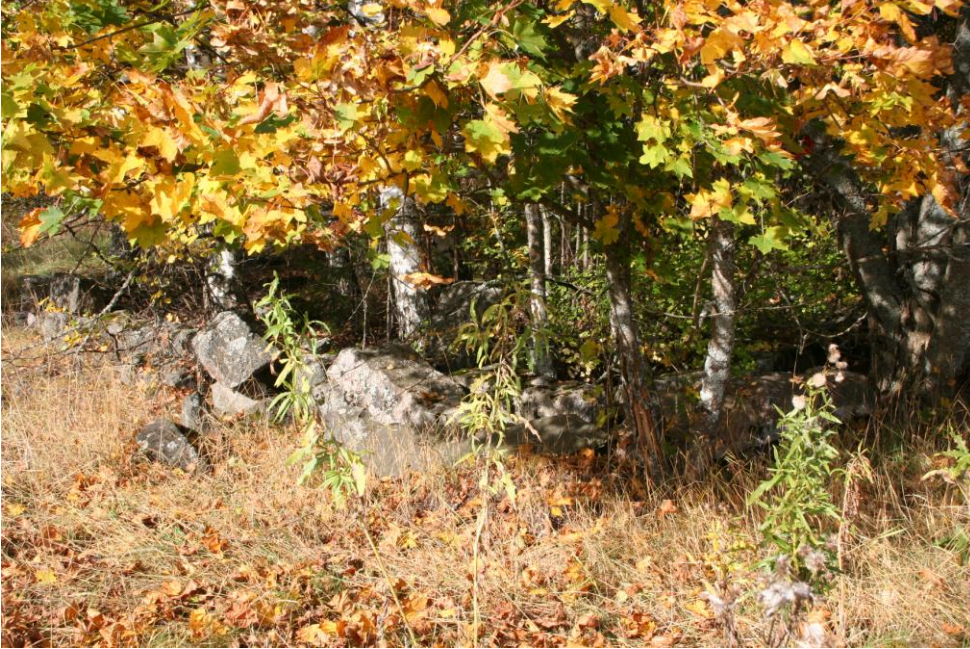
Talon rakenteita. Kaakosta.