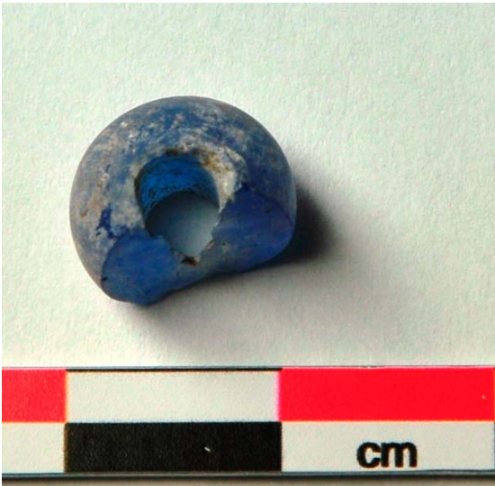
Kuva 4. Mikkeli Vuolinko. Inventoinnissa löytynyt rautakautisen lasihelmen katkelma, KM 38070:1. (DG905_5)