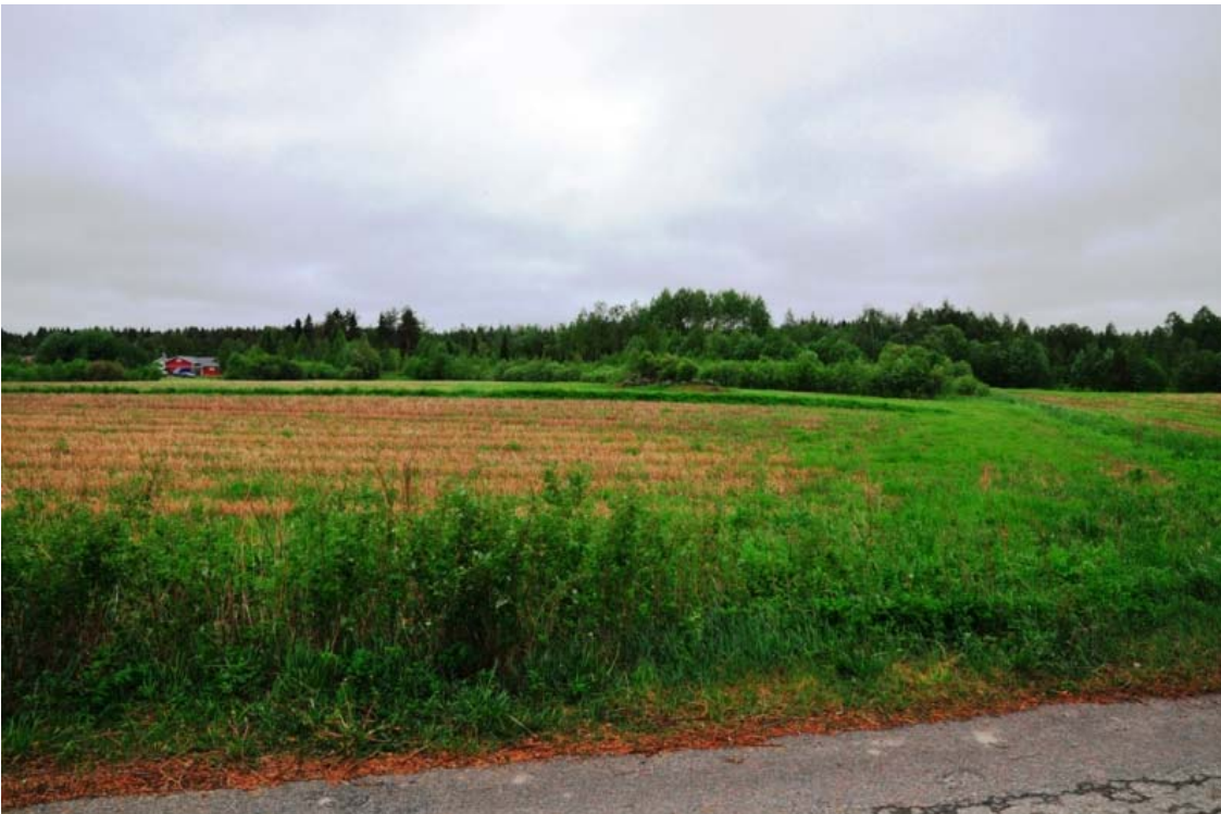
Kuva 2. Mikkelin Vuolinko. Peltoaluetta kuvattuna tieltä etelään. Keskellä kuvaa näkyy peltoraunio, joka sijaitsee kallioisen alueen kohdalla. (DG905_2)