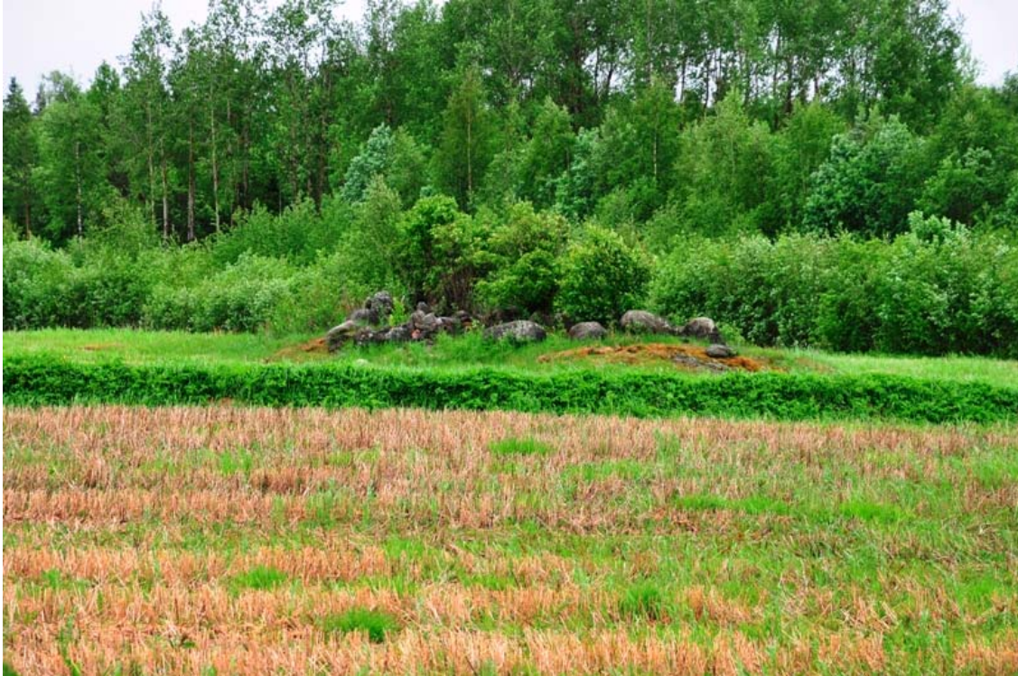
Kuva 3. Mikkeli Vuolinko. Peltoalueen keskellä sijaitseva peltoraunio kuvattuna pohjoisesta. (DG905_3)