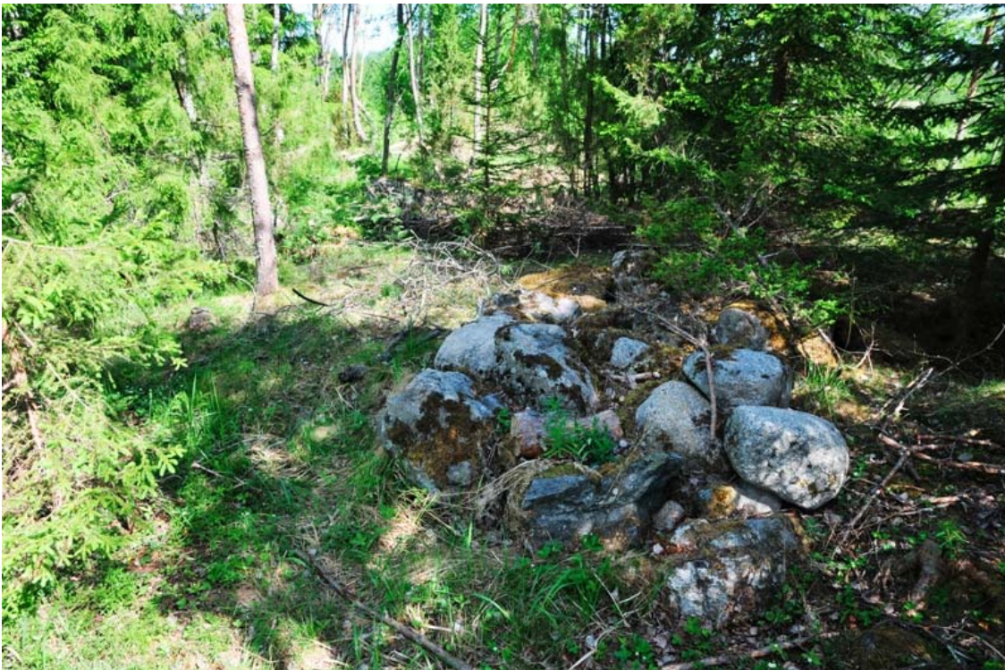
Kuva 4. Mikkeli Vuolinko. Peltoraunio nro 4 kuvattuna etelästä. Raunio sijaitsee kallion päällä hieman metsän puolella. (DG905_4)