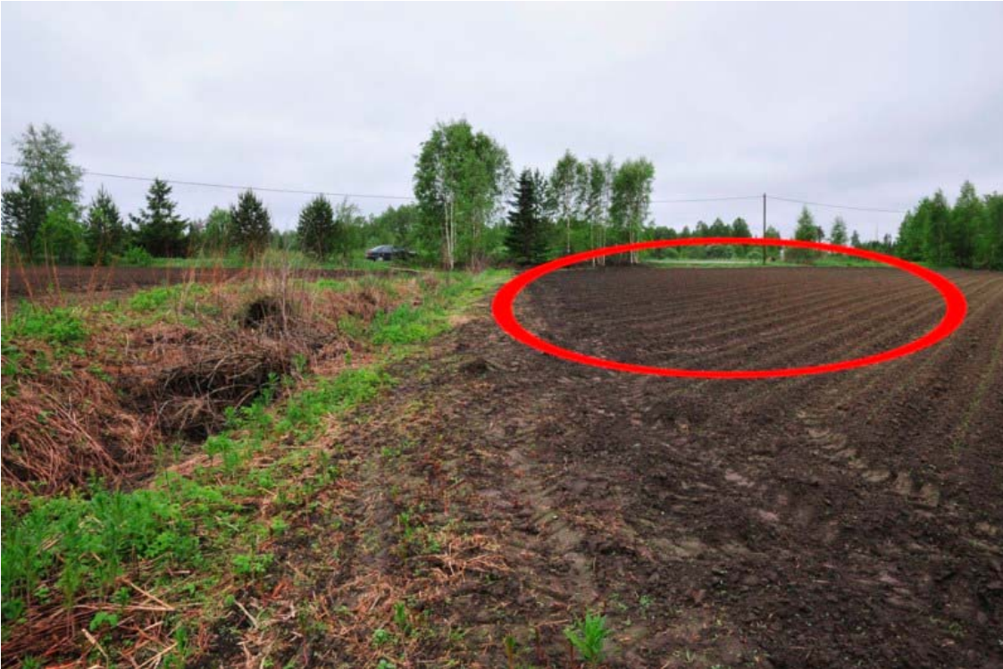
Kuva 1. Mikkelin Vuolinko. Helmi ja raha löytyivät kuvassa rajatulta alueelta, jonka eteläpuolitse kulkee pellon halkaiseva tie. Kuvattu koillisesta. (DG905_1)