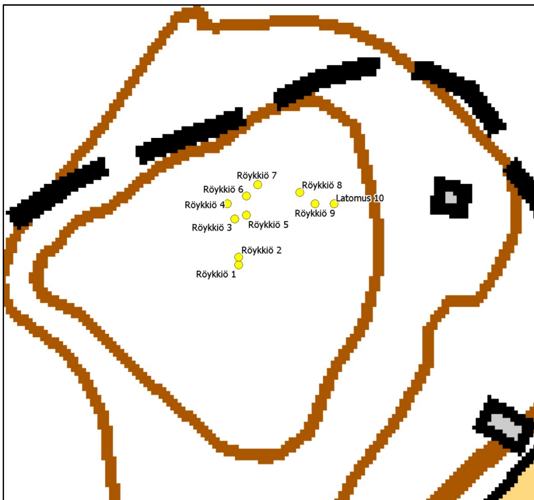
Röykkiöiden sijainti. Kiveykset on merkitty keltaisella pisteellä. Mk 1:1000.