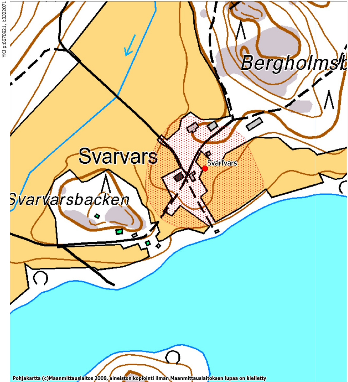
Peruskarttaote 201408 Karis Muinajäännösalue on rajattu punaisella

Muinisjäännöksen rajausta perustuu topografiaan, havaittuihin rakenteisiin ja pintapöiminnassa todettuihin löytöihin sekä vanhaan kartta-aineistoon. Kohteeseen ei kohdistu osayleiskaavasunnitelman perusteella rakentamista.