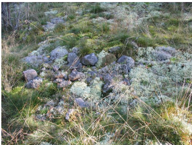
DG1162:3. Röykkiö 8. Lännestä.