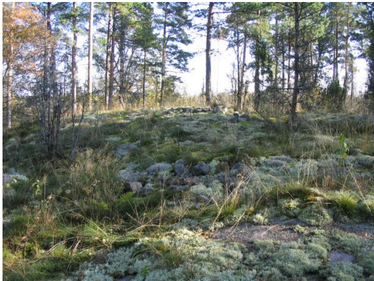
DG1162:2. Röykkiö 8, taustalla röykkiö 9. Lännestä.