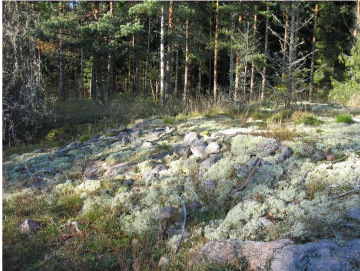
DG1162:1. Röykkiöt 1 ja 2. Lounaasta.