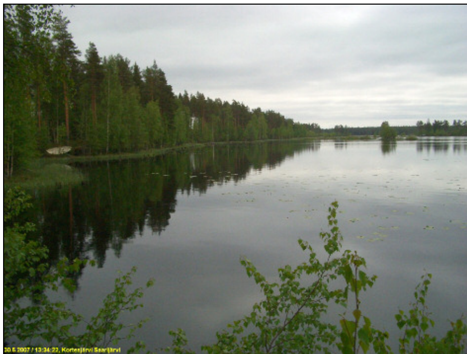
Itärantaa kuvattuna tutkimusalueen pohjoispäästä etelään.