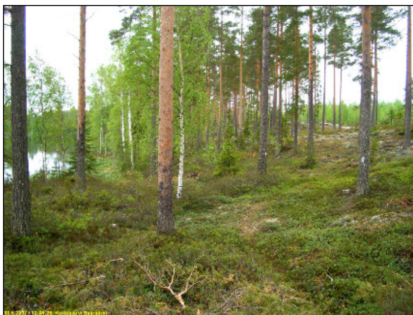
Saarijärven itärantaa kuvattuna pohjoiseen.