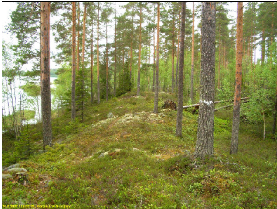
Itärannan keskiosan rannan "punkaa" – kapeaa moreeniharjannetta.