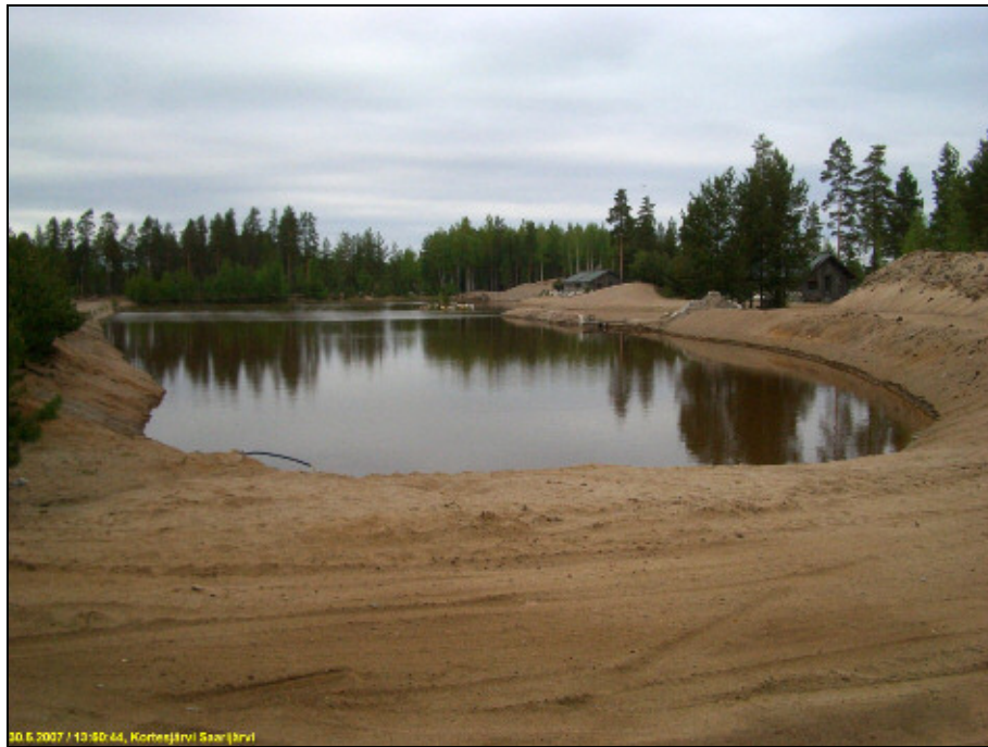
Länsirannan maisemoitua vanhaa hiekkakuoppaa. Kuvattu pohjoiseen.