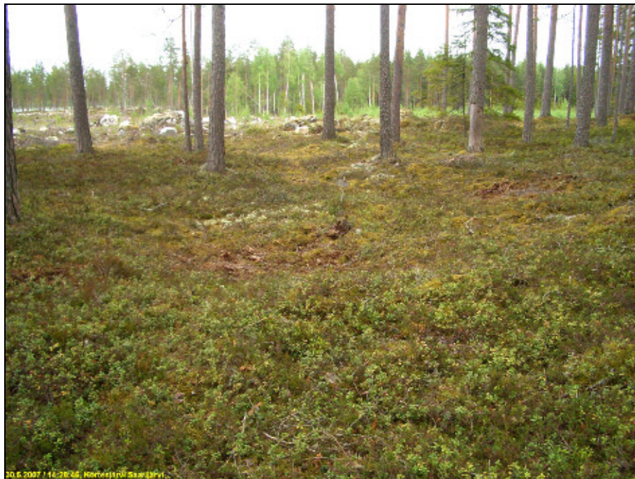
Alla asumuspainanne polun varressa, kuvattu länteen.