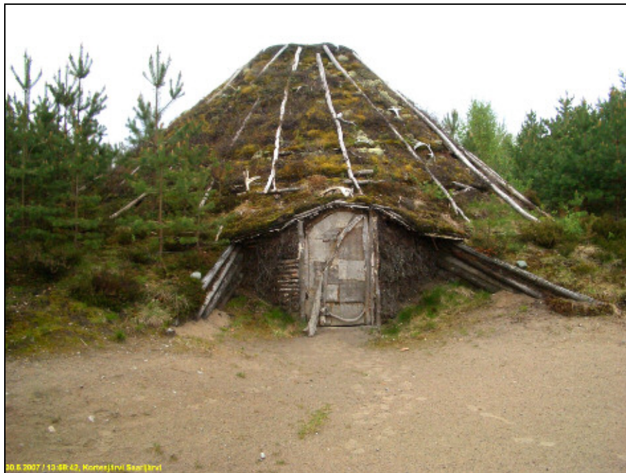
Kivikautisen asumuksen rekonstruktio Saarijärven länsirannan tuntumassa.