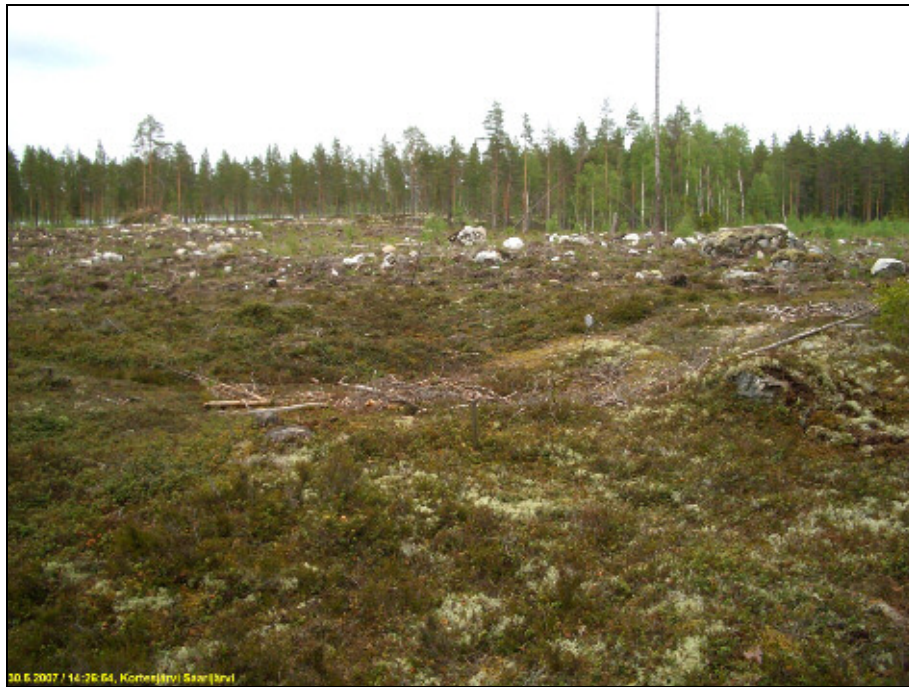
Asumuspainanne hakkuuaukean reunalla. Kuvattu koilliseen.