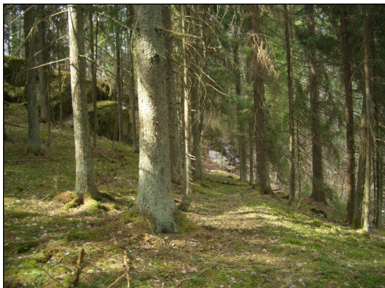
Tasannetta alueen kaakkoiskulmassa, purouoman länsipuolella.