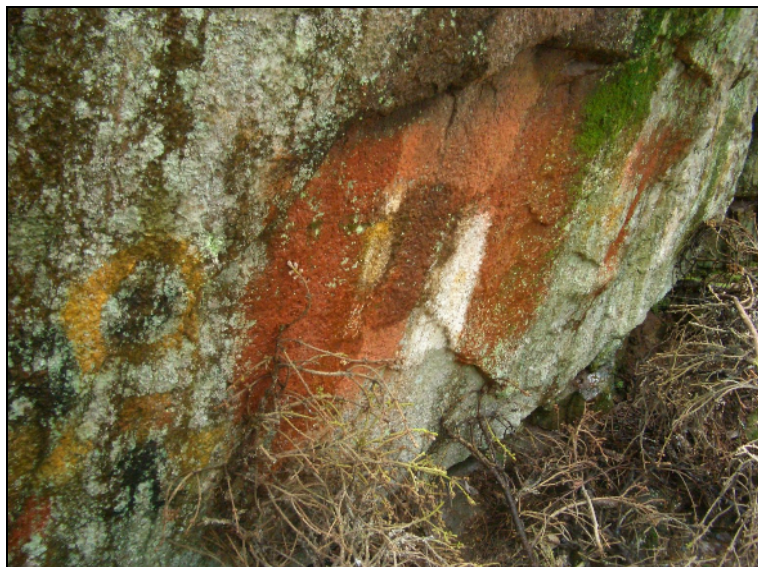
Edellisen "maalauksen" länsipuolella on suttaantunut maalaus. Kyseessä nykyajan maalaukset.