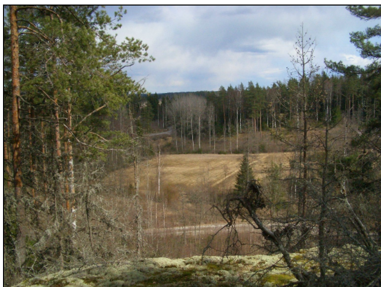
Näkymä alueen eteläreunan keskiosasta itään.