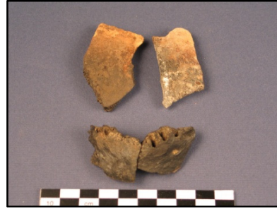
Luita: 2 palaa miehen kallosta, 2 alaleuasta.