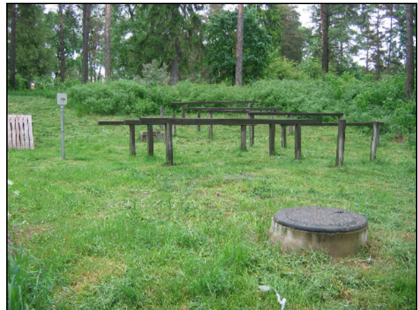
Alempi terassi jossa matonpesupaikka, oik, taustalla ylempi törmä ja sen asuinpaikka