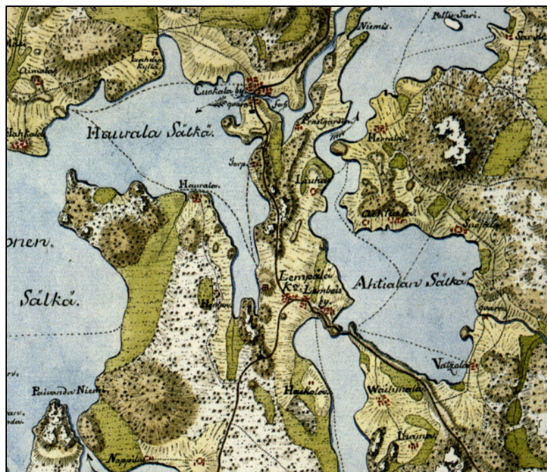
Alla: ote ns. senaatinkartasta 1800-1900 luvun taitteesta