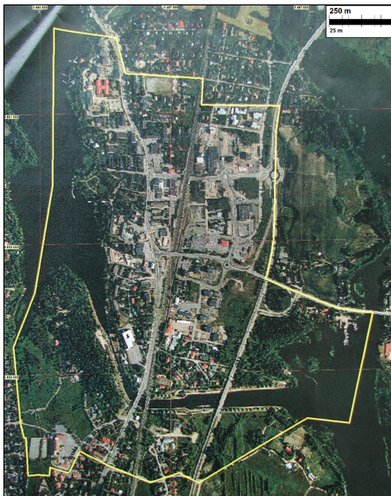
Kuva: Lempäälän kunta