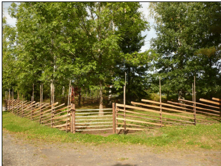
Kalmistoaluetta pihamaalla alueen keskiosassa.

Kuvaus: Kalmisto, josta on todettu sekä ruumis- että polttohautoja sijaitsee Turun - Tampereen -tien ja Valkeakoskentien liittymässä, niemen eteläosassa pihamaalla ja puutarhassa. Kalmistoa on ollut koko alueella koordinaattipisteiden välillä. Vuonna 1917 Valkeakoskelle johtavaa tietä tehtäessä havaittiin ruumiskalmistoon viittaavia löytöjä. Vuoden 1971 kaivausten yhteydessä alueelta todettiin myös polttokalmisto. Liittymän alueella on suoritettu massiivisia maansiirtotöitä, eikä alkuperäistä maanpintaa ole enää jäljellä. Kalmiston jatkuminen itään Lempäälä-Valkeakoski -tien suuntaisesti on mahdollista. Kalmistosta saattaa olla koskematon alue jäljellä itäpäässä tonteilla RN:ot 4:10, 1:229 ja erityisesti pienellä kummulla tontilla 3:15.