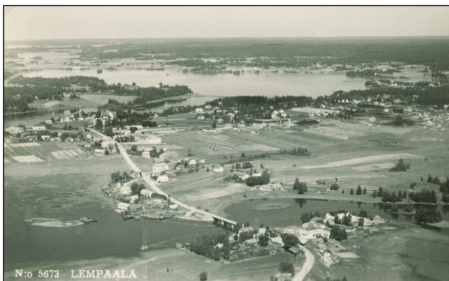
Lempäälän keskustaa idästä 1930-luvulla. Kirkko takana vas.