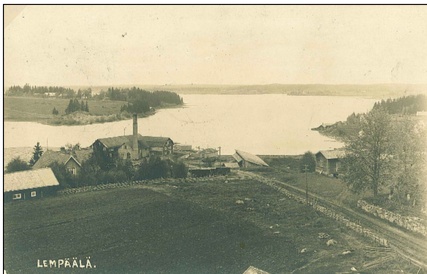
Rakennus vasemmalla rannassa jossa piippu. Alla sen jäänteet.