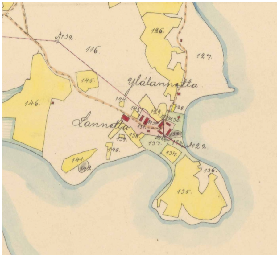
ote kartasta v. 1911