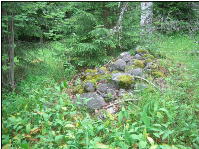
Peltoraunioita ja raivauskasoja. Yllä Ahvenniemessä, alla Linnaniemen pohjoispuolella