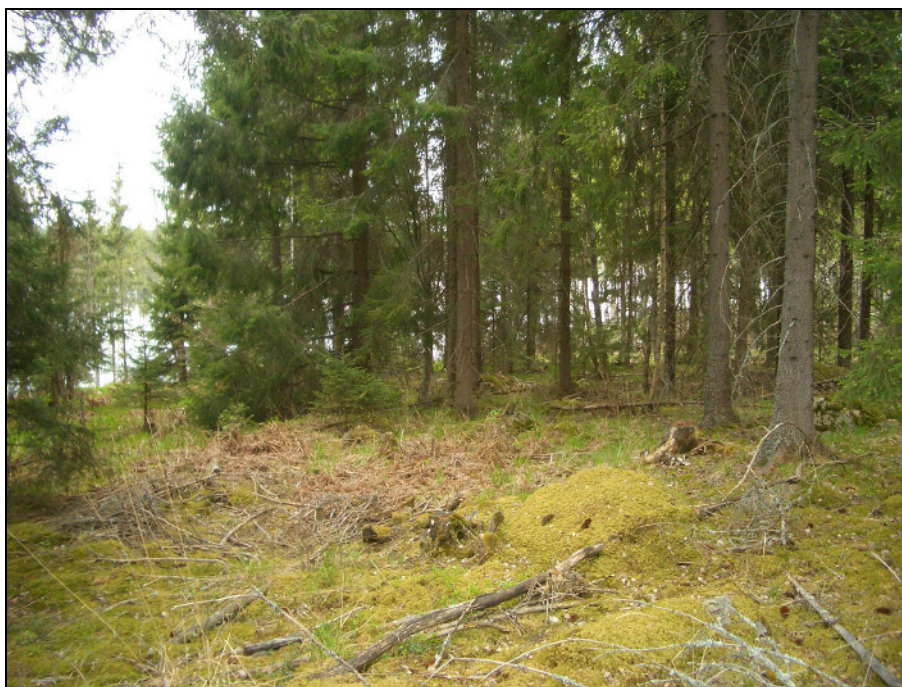
RA-aluetta kuvattuna sen koillisreunalta etelä-lounaaseen.