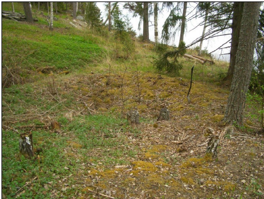
Maarakenne raviinin suun kupeessa. Kuvattu kaakkoon. Alla koilliseen.