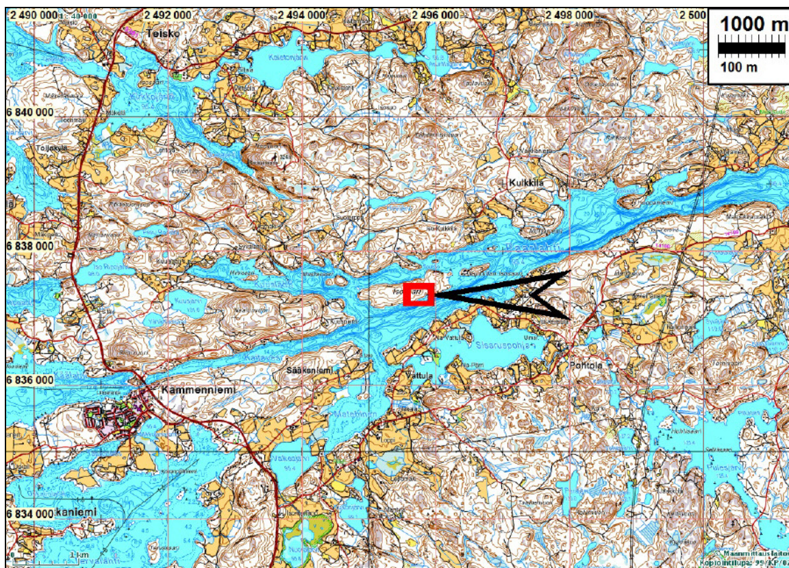
Tutkimusalue merkitty punaisella neliöllä.

Tulokset: Saarella ja sen lähialueella ei ole esihistoriallisia muinaisjäännöksiä. Lähin kivikautinen asuinpaikka sijaitsee n. 3,5 km lounaaseen (Tampere Isokartano). Saaren länsipuolella olevassa niemessä on autoitunut Kuusniemen vanha kylätontti. Saaren keskiosassa ei havaittu mitään esihistoriaan viittaavaa. Rakennuspaikan lounaispuolella, rannan tuntumassa havaittiin maarakenne, joka vaikuttaa olevan nykyaikainen.