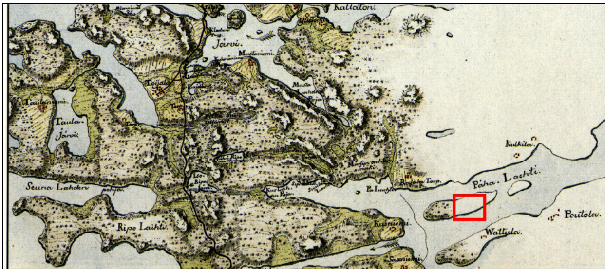
Ote Kuninkaankartasta 282, tutkimusalue merkitty päälle punaisella neliöllä.