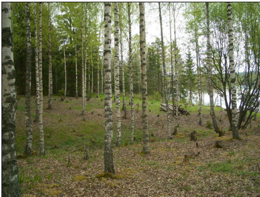
RA-alue raviinin takana. Kuvattu itä-kaakkoon.