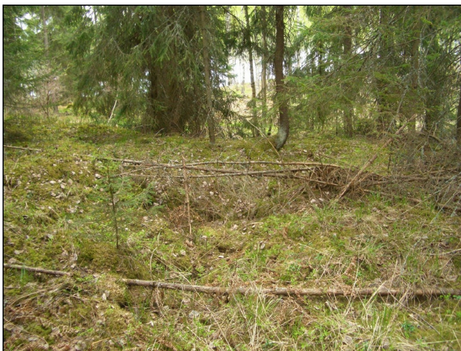
Pitkänomainen kuoppa RA-alueen pohjoisreunalla – ilmeisesti kuitenkin luontainen, kallionkolo.