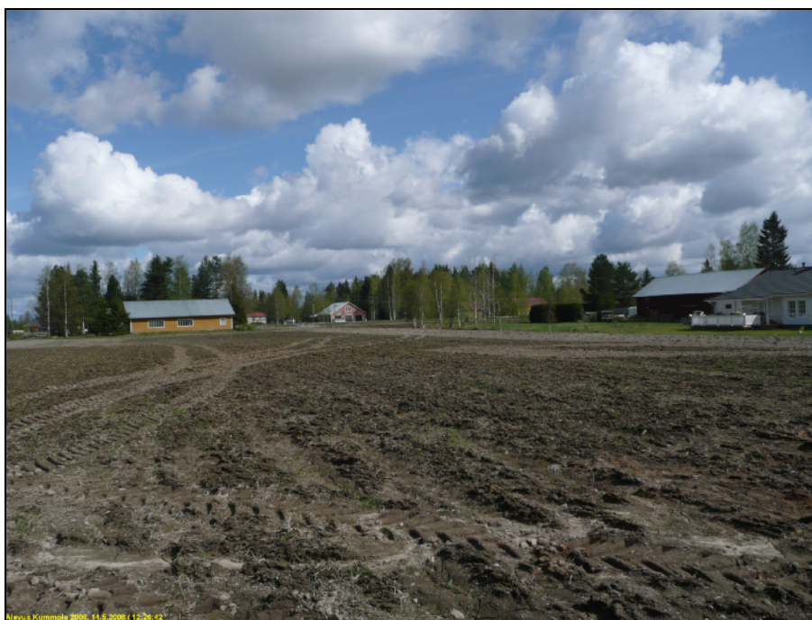
Kumolan kaava-alueen itäosa, kuvattu itään.