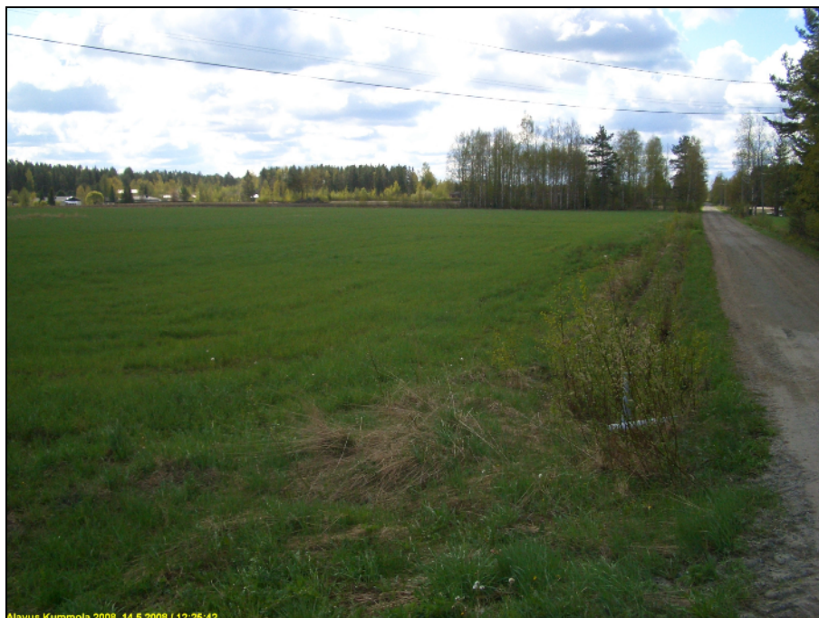
Tutkimusalueen pohjoisosaa kuvattuna etelään. Oikealla Kumolantie.