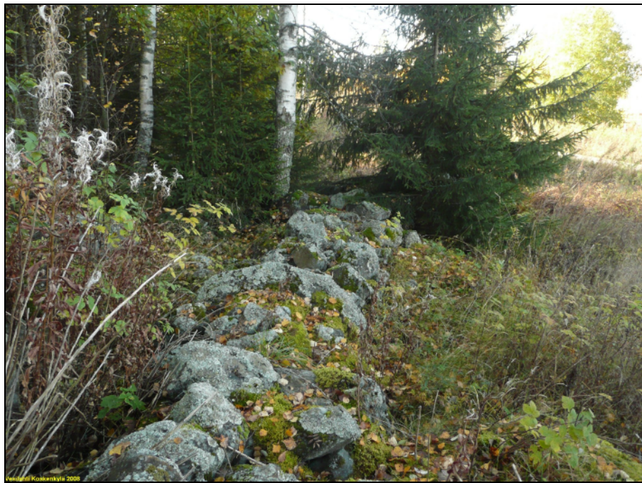
Kiviaita alueen lounaispäässä, joka mahd. liittyy vanhaan kylätonttiin.

Sijainti: Paikka sijaitsee Vesilahden kirkosta 6,0 km etelään. Huomiot: Isojaon toimituskarttojen 1784 mukaan alueella on ollut kylätontti, joka kyllä suureksi osaksi tuhoutunut mutta keski- ja eteläosiltaan mahdollisesti ehjä ja autoitunut. Asiaa ei tarkemmin tutkittu maastoinventoinnissa 2008. Alueella on kiviaidan pätkä, joka oletettavasti liittyy vanhaan ja autoituneeseen kylätontin osaan. Missä määrin alueella on säilynyt maakerroksissa vanhaan asutukseen liittyviä jäänteitä, ei ole selvitetty.