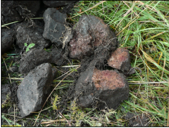
Palaneita kiviä kiukaasta