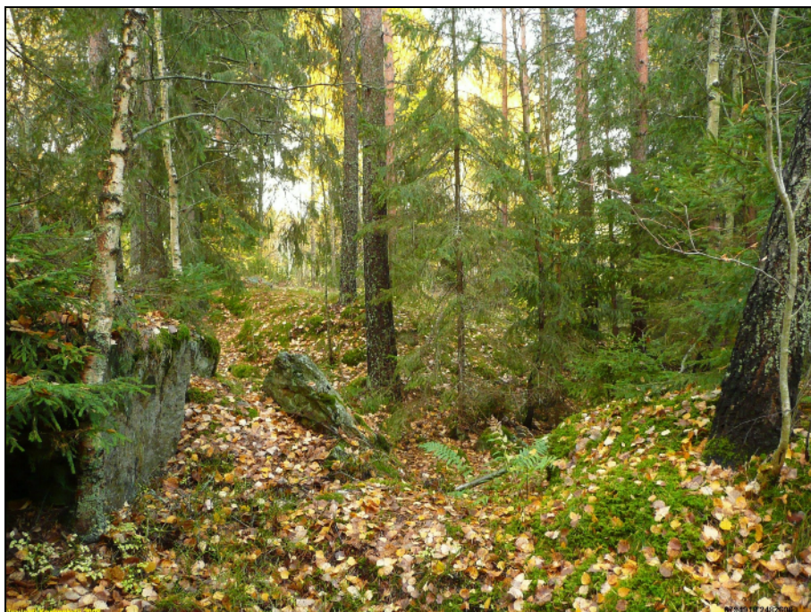
Sortunutta juoksuhaudan mutkaa varustuksen lounaispäässä.

Sijainti: Paikka sijaitsee Vesilahden kirkosta 6,0 km etelään. Huomiot: Alueella taisteluhautasysteemi jossa pesäkkeitä, bunkkereita ja yksi suojakaivanto. Suurelta osin ehjä kokonaisuus, pieniä osia tuhoutunut etelässä tien alle ja luoteessa maa-aineksen otossa. Varustukset ovat kauttaaltaan varsin rapistuneita ja sortuneita vaikkakin itse systeemi on eheä kokonaisuus pieneltä osin kokonaan tuhoutuneena.