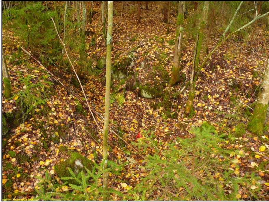
Juoksuhaudaa varustuksen eteläosassa, alla T Rostedt paikantaa pesäkettä alueen koillisosassa