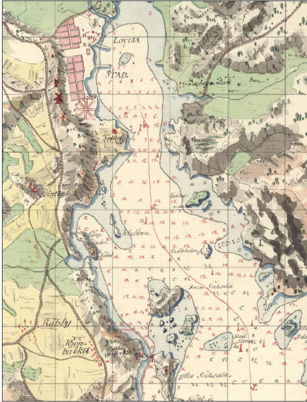
Kuva 2. Suunnittelualue hydrologisessa kuninkaankartastossa 1776 – 1805.

historiallisen ajan kiinteitä muinaisjäänöksiksi laskettavia kohteita joita ei ollut enää merkittyinä nykyisiin karttoihin mutta jotka kuitenkin edustavat historiallisella ajalla tapahtunutta ihmistoimintaa. Jos edellä mainittuja toimintapaikkoja saatiin karttoja vertailemalla kohtuullisesti paikallistettua, merkittiin tarkistettavat alueet peruskartaotteisiin kenttätyövaihetta varten.