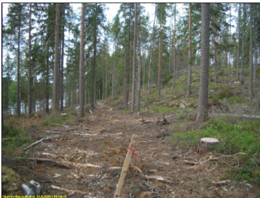
Lossivuoren kaakkoispuolella oleva tasanne, kuvattu luoteeseen.