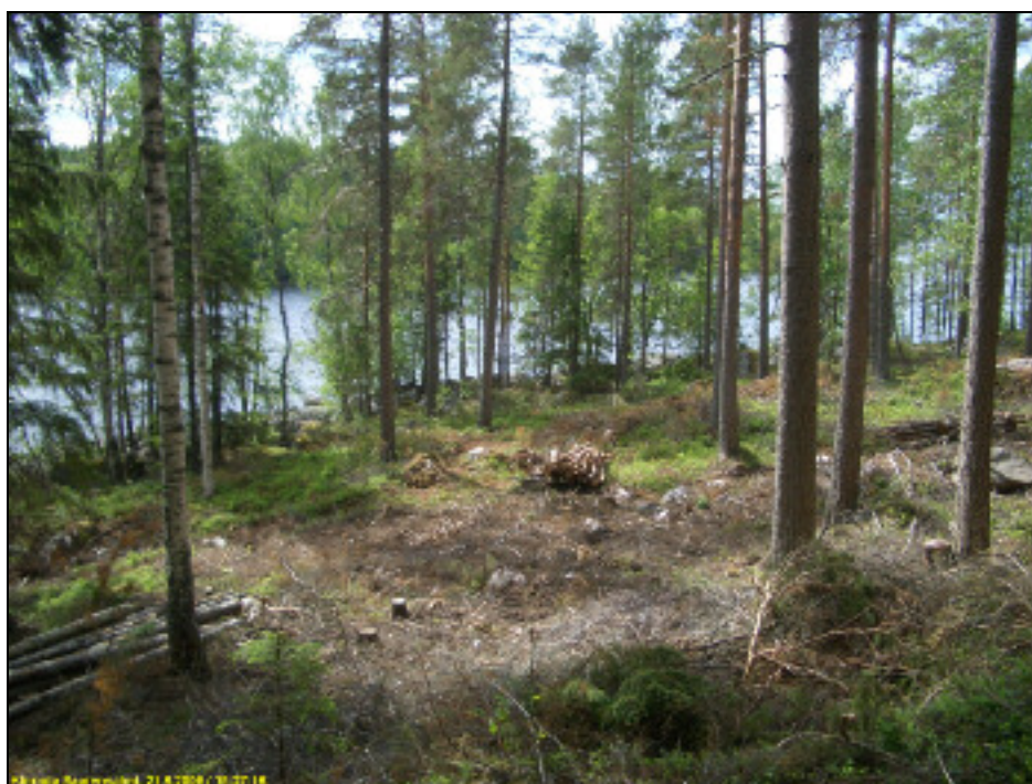
Lossivuoren alapuolella olevaa rantaa.