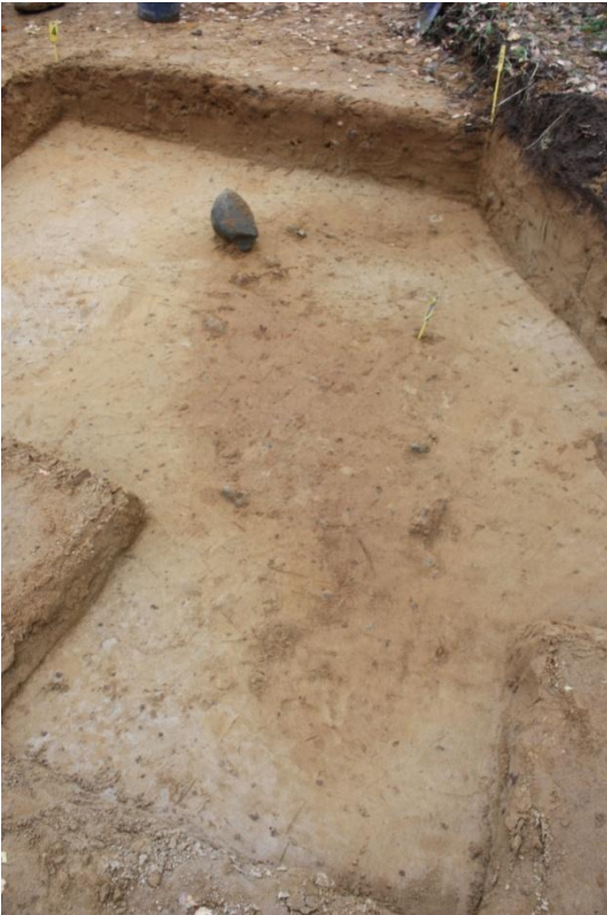
Alue A tasossa 3. Kuvassa ympäristöstään erottuva punertava likamaa-alue, johon löydöt keskittyivät. Kuvattu luoteesta.