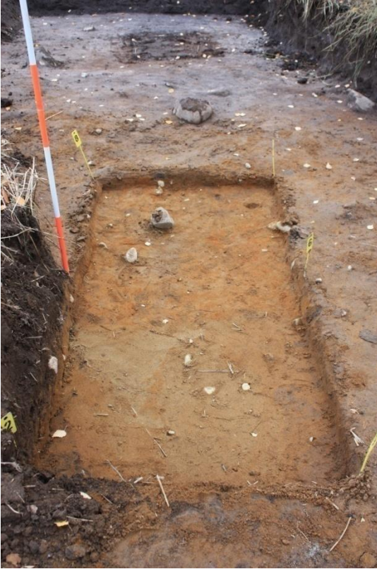
Alue B tasossa 1. Kuvattu luoteesta.