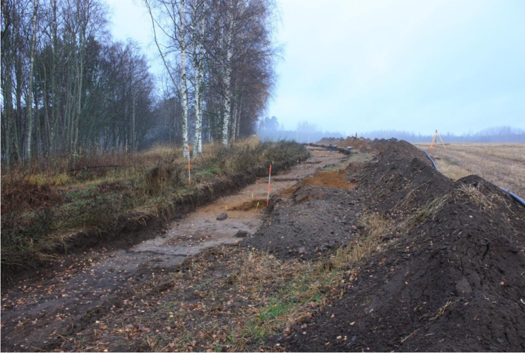
Tutkimusalueen eteläosa. Ojan eteläosassa alue B. Kuvattu kaakosta.