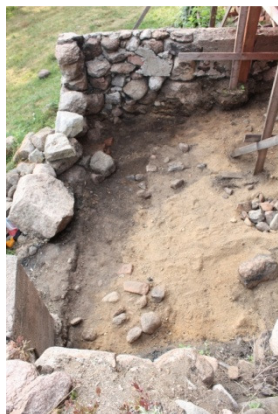
DG2251:7. Kaivausalueen pohjoisosa tasossa 3. Kuvattu lännestä.