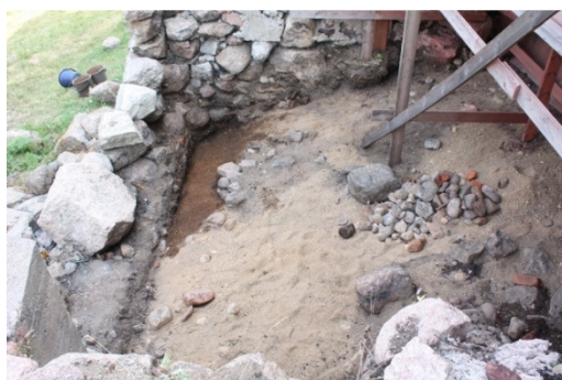
Vasemmalla DG2251:8, kaivausalueen koillisnurkka tasossa 4. Kuvattu etelästä. Oikealla DG2251:13 Kaivausalueen koillisnurkka tasossa 5. Muu alue kaivettu puhtaaseen pohjamaahan. Lännestä.