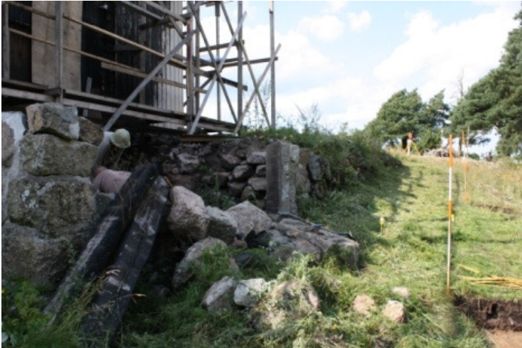
DG1134: 36 Vuonna 2009 otettu kuva kuistin sisäpuolelle tehdyn koekuopan kaivamisesta. Idästä.

Parin päivän mittaisen kaivauksen tuloksena kuistin sisäpuolinen alue saatiin tutkittua kokonaan. Aikaa tutkimiseen meni päivä oletettua pidempään. Tämä otettiin Vainionmäen yleisökaivauksen valmisteluajasta. Kuistin sisäpuolelta sekoittuneesta maasta löydetty arkeologinen aineisto muodostuu lähinnä palaneesta luusta, saviastian kappaleista ja sulaneista lasihelmistä, mutta joukossa on myös pronssikorujen katkelmia. Aineisto ajoittunee pääosin viikinkiaikaiseksi (800-1050 jKr.), mutta mukana voi olla myös vanhempien esineiden katkelmia. Lisätutkimuksia kuistin sisäpuolella ei tarvita.