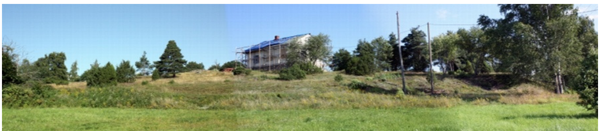
DG1134:1. Panoraama Rukoushuone-Kansakoulunmäestä kaakosta nähtynä. Kuva Museovirasto/Esa Mikkola 2009

Rukoushuoneen kaakkoispäädystä kasvaa joitakin herukkapensaita ja muita istutettuja puutarhakasveja. Mäen pohjoisosassa on useita vanhoja mäntyjä, joitakin pihlajia ja muita lehtipuita. Mäen koillisrinteen kasvillisuus on rehevämpää kuin mäen laella ja etelärinteessä, jossa on lähinnä kuivaa ketoa muistuttavaa kasvillisuutta. Mäellä kasvaa mm. kissankäpälää, ketokaunokkia ja ketomarunaa sekä arkeofyyttinä pidettyä mäkikauraa ( www.laitilanwalo.fi ). Mäen etelärinteessä kasvaa myös joitakin katajia ja yksittäisiä isompia puita. Mäki kuuluu Museoviraston arkeologian osaston muinaisjäännösten hoitoyksikön hoitokohteisiin.