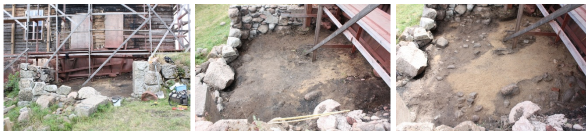
Vasemmalta oikealle DG2251:3 Kuistin alue pohjoista kuvattuna. DG2251:1 Kaivausalue tasossa 1. Lännestä. DG2251:4 Kaivausalue tasossa 2. Lännestä. Teräväkulmainen tumma alue on vuoden 2009 koekuoppa.

Tutkimusten tavoitteena oli poistaa Rukoushuoneen tulipalossa tuhoutuneen kuistin kivijalan sisäpuolinen sekoittunut arkeologisia löytöjä sisältänyt kerros sekä tarkastaa ettei alueella ollut säilyneenä alkuperäistä polttokalmistokerrosta tai muita arkeologisesti merkittäviä kiinteitä rakenteita. Kuistin alue oli kooltaan noin 4,5 x 4 metriä eli 18 m 2 . Tutkimusmenetelmänä oli tasokaivaus. Kohteesta 2009 laadittua yleiskarttaa täydennettiin sekä laadittiin kartta kaivausalueen talteenottoruutujärjestyksestä. Taso- tai profiilikarttoja ei piirretty. Kartta-aineisto on digitoitu ja tulostettu MapInfo-ohjelmalla. Löytöjen talteenotto toteutettiin neliömetrin kokoisissa ruuduissa, jotka noudattivat kuistin kivijalan suuntaa. Aiemmin luotua koordinaatistoa ei käytetty. Kaikki irrotettu maa-aines seulottiin pienimpienkin löytöjen talteen saamiseksi. Valokuvausdokumentoinnissa käytettiin ainoastaan digitaalikuvausta. Havaintomahdollisuudet olivat hyvät, vaikka rakennustelineet hieman häihtäisivätkin sekä kaivaustyötä että valokuvausta. Tutkimusten tuloksena kuistin alue todettiin täysin sekoittuneelta. Tästä huolimatta löytöjä saatiin talteen suhteellisen paljon. Ehjää kalmistokerrosta saattaa olla hieman säilyneenä kuistin kivijalan alla, sillä kivijalan perustuksia ei ole kaivettu kovin syväälle.