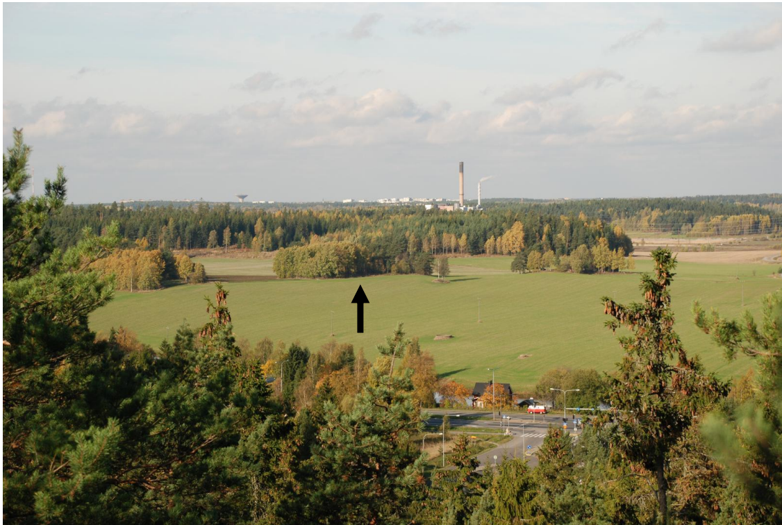
Kuva 1. Ravattulan Ristimäki kuvan keskellä (osoitettu nuolella). Kuvattu Muikunvuorelta luoteeseen.

Ristimäki muodostaa niemekemäisen metsäsaarekkeen peltoalueen keskelle, noin 200-250 m etäisyydellä Aurajoen uomasta luoteeseen. Ristimäki jakautuu nykyisin kahteen peltoalueen erottamaan metsäiseen kumpareeseen. Länsiosaa Ristimäestä nimitetään Särvän Ristimäeksi ja se on kooltaan noin 180 x 80 m. Tämän koillispuolella olevaa lähes pohjois-eteläsuuntaista mäkeä kutsutaan Ravattulan Ristimäeksi. Se on kooltaan noin 90 x 50 m ja sijaitsee korkeustasolla noin 22-24 m mpy. Alue kuuluu kokonaisuudessaan Aurajokilaakson kansallismaisema-alueeseen.