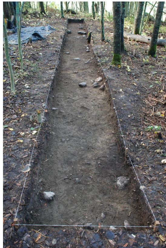
Kuvat 13 (vas.) ja 14 (oik.). Koeoja 2 ja taso 1 (vasemmalla) ja taso 2 (oikealla). Kuvattu etelään. Kuvat J. Ruohonen / TYAdigi19.26 ja TYAdigi19.38.

Kerroksesta esiin tulleet kivet keskittyivät pääosin tummemman maan alueille hautakuvioiden kohdalle. Näiden ulkopuolella osa kookkaammista kivistä oli puhtaassa