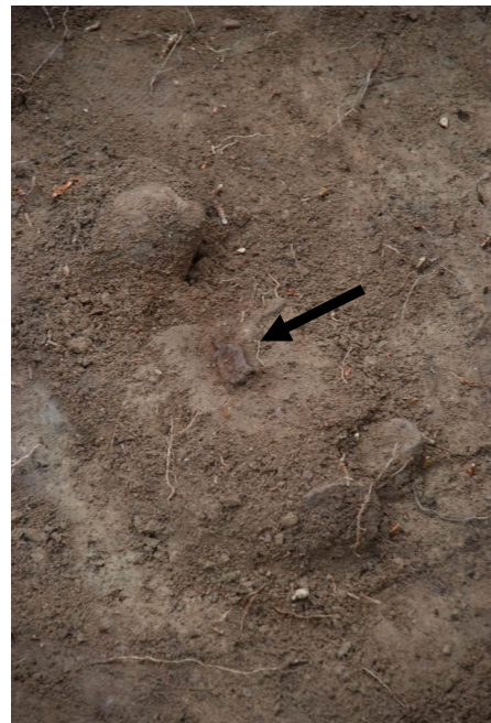
Kuva 20. Haudan 1/2010 keskivaiheilta esiin tullut pronssisolki (TYA 863:217) in situ . Kuvattu länteen.

Hautaustasossa haudan päädyissä havaittiin paikoillaan pystyssä kanta ylöspäin yhteensä kahdeksan (molemmissa päädyissä neljä kpl) kookasta rautanaulaa (:218-221 ja :225-228). Paikallaan pysyneiden naulojen perusteella oli mahdollista mitata arkun kooksi pituussuunnassa tasan 200 cm; arku kapeni toisesta päästään, sillä sen leveys päädyissä naulojen sijainnin perusteella oli noin 40 cm (lounaispääty) ja 34 cm (koillisipääty). Joidenkin naulojen varressa oli