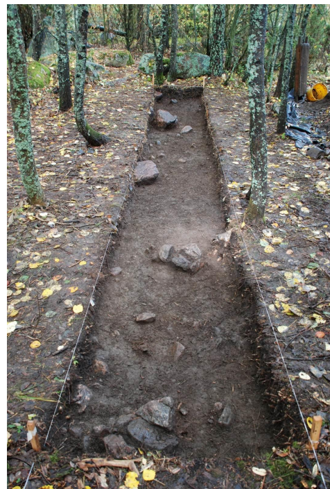
Kuva 8. Koeoja 1, taso 2. Kuvattu pohjoiseen. Etualalla kaksi kivettyä paalunsijaa.