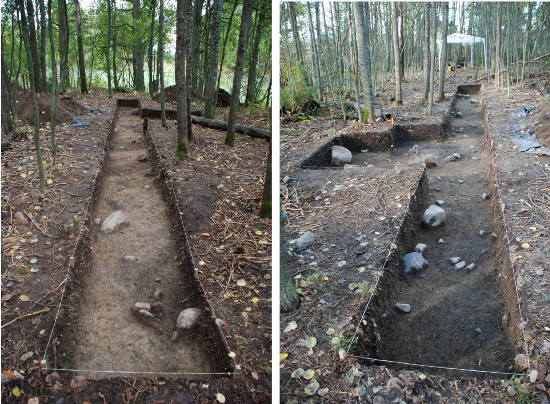
Kuvat 16 (vas.) ja 17 (oik.). Koeoja 2, taso 3 (noin 30 cm syvyys). Hautakuviot erottuvat vaaleanruskeasta hiekasta tummempina läikkinä. Koeojaa ei kaivettu tätä syvemmälle kuin laajennuksen alueelta. Kuvattu etelään (kuva 16) ja pohjoiseen (kuva 17). Kuvat J. Ruohonen / TYAdigi19.50 ja TYAdigi19.51.

Tasoa dokumentointia varten siivotessa löytyi kaivauskerroksen pohjalta irtolöytönä hautapainanteen 5 (=hautakuvion 6) kohdalta ( x = 166,81 , y = 797,78 , z = 23,48 ) tummanruskeasta täyteaasta viuhkamainen pronssispiraalikoriste (:182), jonka yhteydessä oli villatekstiiliä. Kyseessä on todennäköinen esiliinan tai viitan tms. kulmakoriste. Röntgenkuvan perusteella esineessä on kolme vierekkäistä kuusinkertaista spiraalia ja viiden lyhyen (3-4 kertaisia) spiraalin muodostama pääty. Yhdestä lyhyestä spiraalista (toinen kulma) puuttuu kappale. Pronssispiraali löytyi vain 33 cm syvyydeltä nykyisestä pintamaasta ja se lienee päätyntyt haudan täyttömaahan uudempaa hautausta vanhan päälle kaivettaessa.