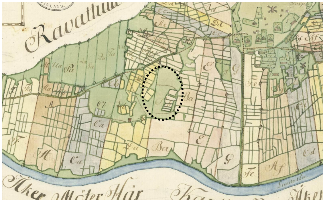
Kuva 2. Ote Jac. Stålströmin 1760-luvulla Ravattulan kylästä laatimasta isojakokartasta. Kylämäki karttaotteen oikeassa yläreunassa ja Aurajoki alalaidassa. Ristimäen arvioitu sijainti ympyröity. MHA A22:39/1-2, KA.

Toisin kuin moneen muuhun Aurajoen varren rautakauden lopun tai varhaishistorialliseen kalmistoon, Ravattulan Ristimäkeen ei liity tai siitä ei ole säilynyt mitään kalmistosta kertovaa perimätietoa, kuten tarinoita hautauksista, löydöistä tai kirkollisesta rakennuksesta. Kuitenkin paikan nimi – Ristimäki – on mielenkiintoinen, ja se saattaa pitää sisällään paikan luonteesta kertovan komponentin. Ristimäki -nimityksen tarkempi ikä ei kuitenkaan ole tiedossa.