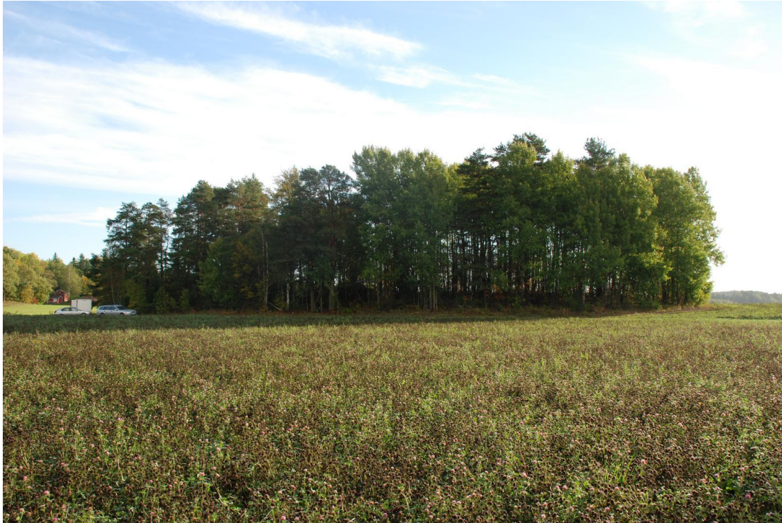
Kuva 4. Yleiskuva Ravattulan Ristimäestä. Kuvattu itäkoilliseen.

Noin 20-30 cm syvyydessä maa muuttuu pääsääntöisesti ruskeaksi-kellertäväksi hiekaksi. Paikkaa ei ole ainakaan 1900-luvulla käytetty viljelyyn, mutta paikallisten kertoman mukaan siellä on laidunnettu vielä 1970-luvulla.