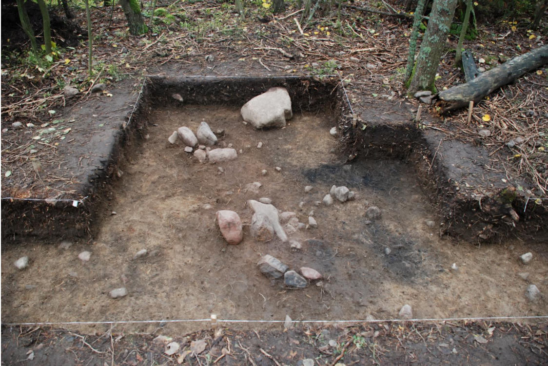
Kuva 18. Koeoja 2, laajennus tasossa 3,5. Hauta 1/2010 erottuu vaaleanruskeasta maasta punertavanruskeana kuviona. Pääosa kivistä keskittyy hautakuvion alueelle. Kuvattu länteen. Kuva J. Ruohonen / TYAdigi19.52.

Hauta erottui ympäröivästä kellertävänruskeasta maasta selvästi tummemman-punaisenruskeana noin 225 cm pitkänä läikkänä. Haudan pohjoispuolella läikän ulkopuolella ollut tummempi nokisen hiekan alue oli ohut ja sen alta tuli todennäköisesti puhdasta vaaleanruskeaa hiekkaa. Alueen luoteiskulmassa olevaa toista mahdollista hautaläikkää ei kaivettu syvemmälle. Haudasta poistettiin pienemmät kivet, mutta paikoilleen jätettiin lounaispuolella syvemmälle mennyt laakea kivi sekä haudan keskivaiheilla pituussuunnassa ollut, poikkileikkaukseltaan hieman kolmikulmainen kookas kivi.