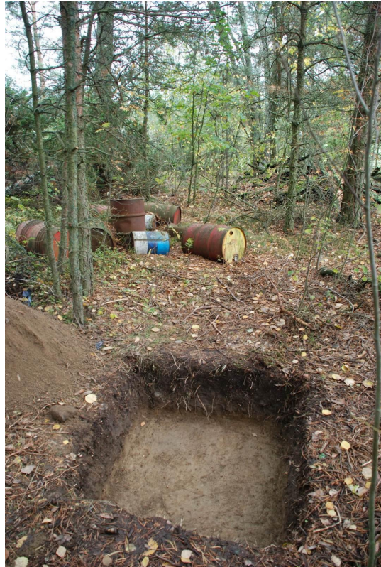
Kuva 25. Koekuoppa 4 pohjassa. Kuvattu pohjoiseen.

Koekuoppa 4 sijoitettiin koeokuopasta 2 noin 4,5 metriä koilliseen melko kivettömälle ja tasaiselle alueelle, tutkimushetkellä vanhojen öljytynnyreiden ja rakennusjätettä sisältävän kasan eteläpuolelle kohtaan x = 207,00-207,99 ja y = 800,00-800,99 .