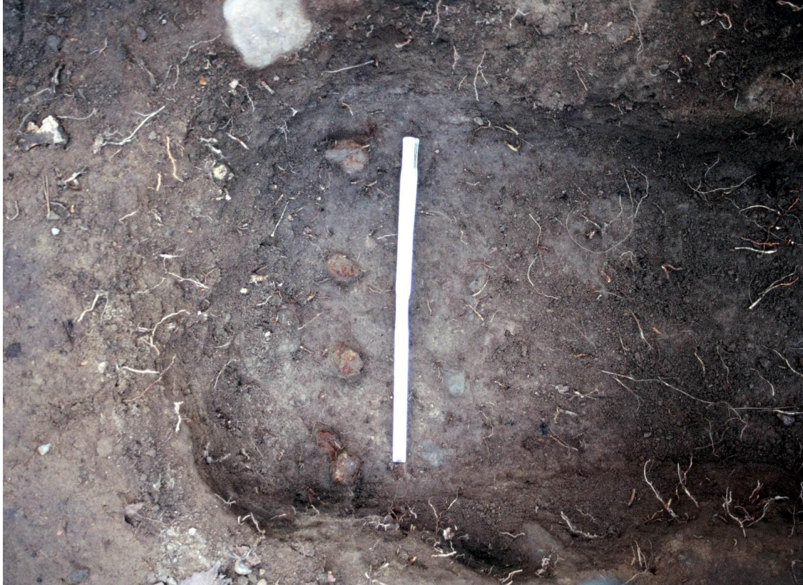
Kuva 21. Haudan 1/2010 lounaispäädyistä löytyneet neljä rautanaulaa (TYA 863:218-221) in situ .

havaittavissa puun syitä, joskaan arkkuun kuulunutta puuta ei muutoin ollut lainkaan säilynyt. Kaksi muuta rautanaulaa löydettiin lisäksi haudan keskiosasta (:222-223) ja yksi haudan keskiosasta mahdollisesti hautaustason alapuolelta läheltä puhdasta pohjamaata (:187).