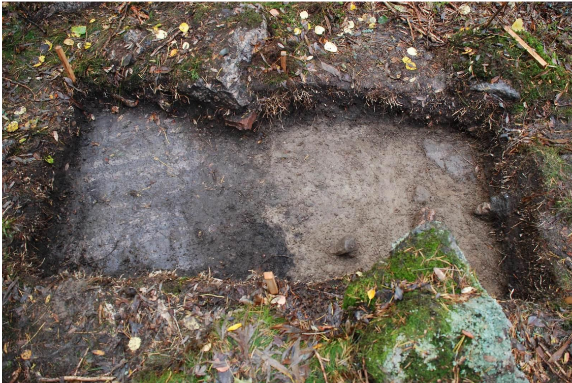
Kuva 22. Koekuoppa 1. Kuvattu etelään. Kuva J. Ruohonen / TYAdigi19.22.

Kuopasta saatiin löytöinä kaikkiaan 7 kpl palaneen saven kappaletta (TYA 863:237-239). Ruudusta 195/789 tuli esiin yksi palaneen saveen kappale (:237) länsiprofiilin läheltä noin 28 cm syvyydestä 25 cm lounaiskulmasta pohjoiseen vaalean hiekan ja tumman humuksensekaisen hiekan rajalta. Edellisen läheltä laajennuksesta (195/788) tuli esiin yhteensä viisi palaneen saven kappaletta (:238) noin 20 cm syvyydeltä tumman humuksensekaisen hiekan alaosasta. Yksi palaneen saven kappale (:239) löytyi lisäksi seulasta.