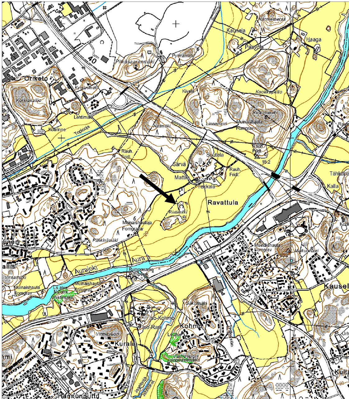
Kaarinan Ravattulan Ristimäen sijainti osoitettu nuolella. Ote digitaalisesta peruskartasta 1043 12 Littoinen (2007). © Maanmittauslaitos.