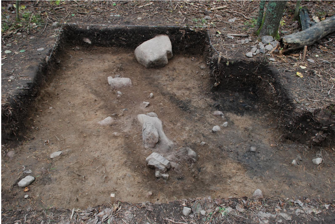
Kuva 19. Hauta 1/2010, välitason dokumentointi. Osa kivistä poistettu. Kuvattu länteen. Kuva J. Ruohonen / TYAdigi19.58.

Dokumentoidun tason jälkeen hautaa kaivettiin yksikkönä alaspäin. Kaivettava hiekka oli haudan täyttömaassa lähinnä ruskeaa sekoittunutta hiekkaa. Syvemmälle kaivettaessa haudan koillisosassa täyttömaasta löydettiin rautanaula (TYA 863:186). Haudan keskivaiheilla pituussuunnassa ollut kookas kivi (koko noin 65 x 30 x 20 cm) poistettiin, ja sen alta paljastui kaksijakoinen kupariseossolki, jonka yhteydessä oli myös orgaanista ainesta (:217). Myös muut haudan täyttömaassa olleet kivet poistettiin.