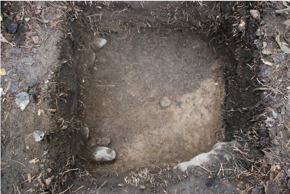
Kuva 26. Koekuopasta 6 esiin noin 35 cm syvyydessä esiin tullut lounais-koillissuuntaisen hautakuvion reuna. Kuvattu pohjoiseen.

Koekuoppa 6 kaivettiin noin 8,5 metriä koeajan 2 etelälaidasta kaakkoon kohtaan x = 161,00-161,99 ja y = 805,00-805,99 . Paikalla oli havaittavissa matalahko hautamainen lounais-koillissuuntainen painanne, jonka keskiosan kaakkoispuolella koekuoppa sijoitettiin.