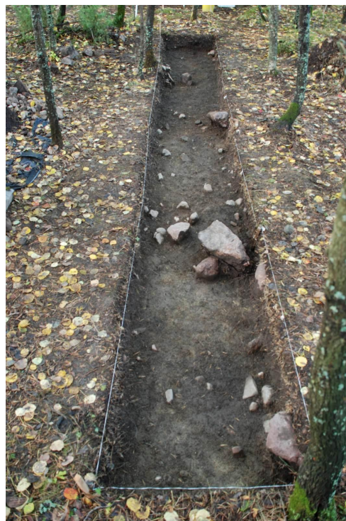
Kuva 10. Koeoja 1, taso 3. Kuvattu pohjoiseen. Kuva J. Ruohonen / TYAdigi19.47.

Koeojan löydöt (TYA 863:1-69) koostuivat pinnasta löytyneiden takonaulojen ohella keramiikan paloista, kvartsi-iskoksista, kivilaji-iskoksista, mahdollisen hioinkiven kappaleista sekä palaneesta savesta. Tunnistettavat saviastian palat olivat tekstiilipintaista ja viittaavat Kiukaisten keramiikkaan. Samaan myöhäiskivikautiseen tai varhaismetallikautiseen toimintaan liittyvät löydetyt kvartsi- ja kivilaji-iskosten kappaleet. Palanutta savea, josta osa oli selvästi savitiivistettä, löytyi alueelta kaikkein runsaimmin. Löytöjen levintä koeojan alueella oli melko tasainen.