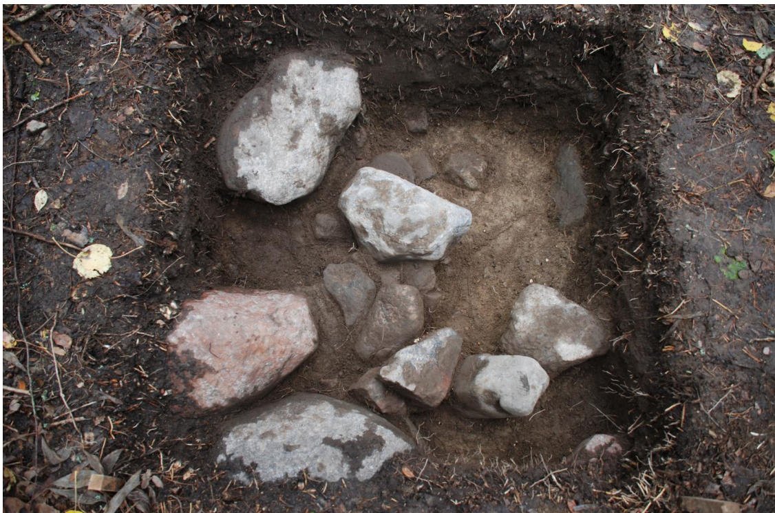
Kuva 25. Koekuopan 5 kiveystä. Kuvattu pohjoiseen. Kuva J. Ruohonen / TY Adigi19.49.

Stratigrafia ja havainnot: humuspitoinen, juuria sisältävä tummanruskea sekoittunut hiekka ulottui noin 35-37 cm syvyyteen. Kookkaita, nyrkinkokoisesta lähes päänkokoiseen olevia kiviä alkoi tulla esiin heti ohuen pintakerroksen alta. Humuspitoisen maakerroksen alta esiin tuli hieno, lähes kivetön vaaleanruskea ilmeisen puhdas kiviä sisältävä pohjahiekka, joka tiivistyi alaspäin mentäessä. Pienemmät kivet poistettiin syvemmälle kaivettaessa; osa kivistä ulottui puhtaaseen pohjamaahan asti. Kyseessä on mahdollisesti jonkin kivirakenteen osa, sillä maasto on lähiympäristössä lähes kivetöntä. Maanpinta koekuopan alueella oli 24,13-24,20 m mpy ja pohja koekuopassa 23,77-23,81 m mpy.