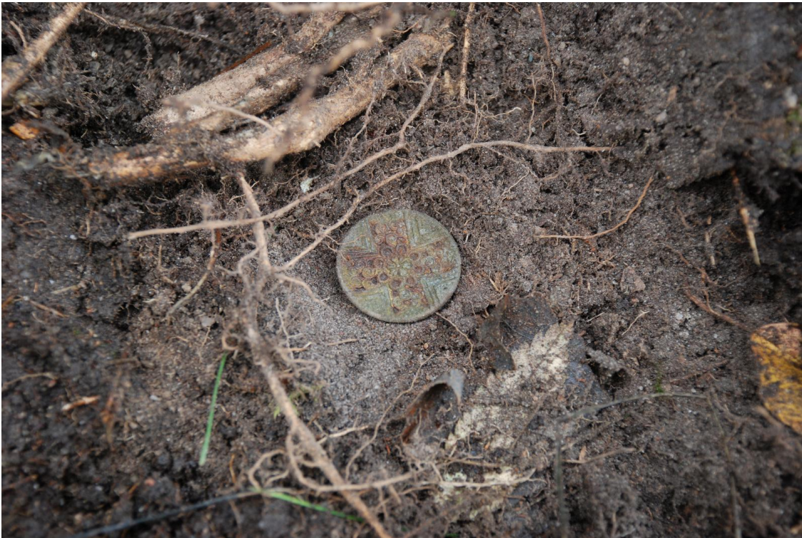
Kuva 27. Ristimäen keskivaiheilta tieuralta turpeen alta löytynyt ristikuvioinen koristenappi tms. (TYA 863:268) in situ .

Ravattulan halki kulkevalta tieuralta löydettiin heti turpeen alta noin 3-5 cm syvyydeltä vierekkäin kaksi pronssista metallinappia tai nappimaista koristetta (TYA 863:268 x = 196,03 , y = 809,80 ja z = 24,31 sekä TYA 863:269 x = 196,08 , y = 809,56 ja z = 24,30 ). Koristeellisissa esineissä on kuvattuna tasasakarainen risti, jonka keskellä kahdeksanlehydykkäinen kukkakuvio.