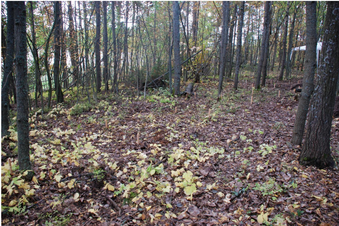
Kuva 12. Koeoja 2 ja sen laajennusalue paalutettuna. Kuvattu luoteeseen.

Saarekkeen reunoille kiviä on tuotu todennäköisesti pellolta. Eteläosan kaakkoislaidassa on laajempi noin 6 x 6 m laajuinen kiviraunio, tämäkin mahdollisesti pelloilta kerätyistä kivistä muodostunut raivausröykkiö. Alueen etelälaidassa, röykkiöstä kymmenisen metriä lounaaseen, havaittiin lisäksi mahdollinen ladon tai muun pitkänomaisen rakennuksen paikka. Saarekkeen lounaiskulmasta on otettu jonkin verran hiekkaa; hiekanotto on voinut tuhota muutamien neliömetrien osalta kalmistoaluetta. Ristimäen eteläosassa kalmistoalueella ja sen reunoilla havaittiin myös jonkin verran matalia maakiviä, jotka saattavat liittyä hautarakenteisiin.