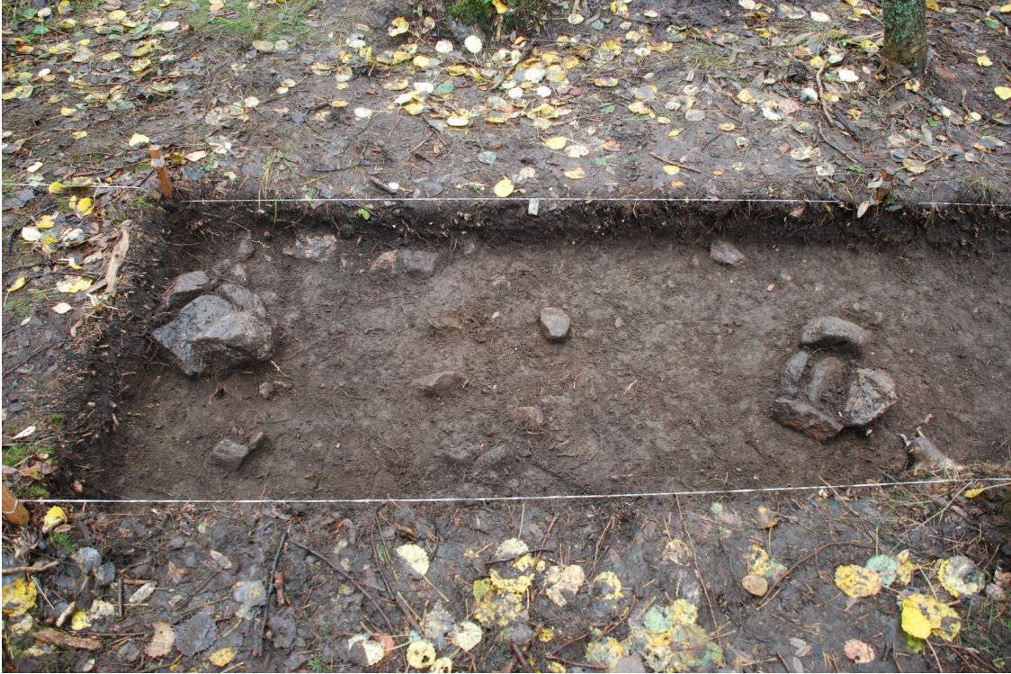
Kuva 9. Kivettyt paalunsijat ruutujen 191-192/796 alueella koeojassa 1 ja tasossa 2 (eteläisempi paalunsija 1, pohjoisempi paalunsija 2). Kuvattu länteen.

Nämä koostuivat kookkaasta tekstiilipainanteisesta saviastian pohjapalasta (:9) sekä kahdesta koristelemattomasta saviastian palasta (:10-11). Lisäksi kerroksesta löytyi 33 kpl palanutta savea (:12-26), jossa yhdessä havaittiin selkeä puupainanne.