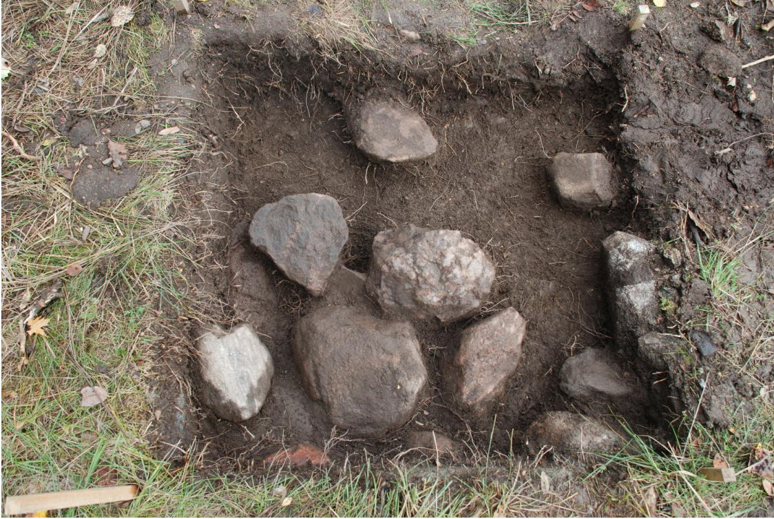
Kuva 24. Koekuopan 3 kiveystä. Kuvattu pohjoiseen.

Koekuopan löydöt (TYA 863:242-250) koostuivat lasitetun ja lasittamattoman punasavikeramiikan palasista, mahdollisista kvartsi-iskoksista sekä palaneesta luusta. Löydöt tulivat esiin aivan maanpinnasta rikkoutuneesta pintamaasta sekä noin 20-36 cm syvyydeltä kivien välisestä maasta. Kuopasta löydettiin myös resentti kiväärin hylsy.