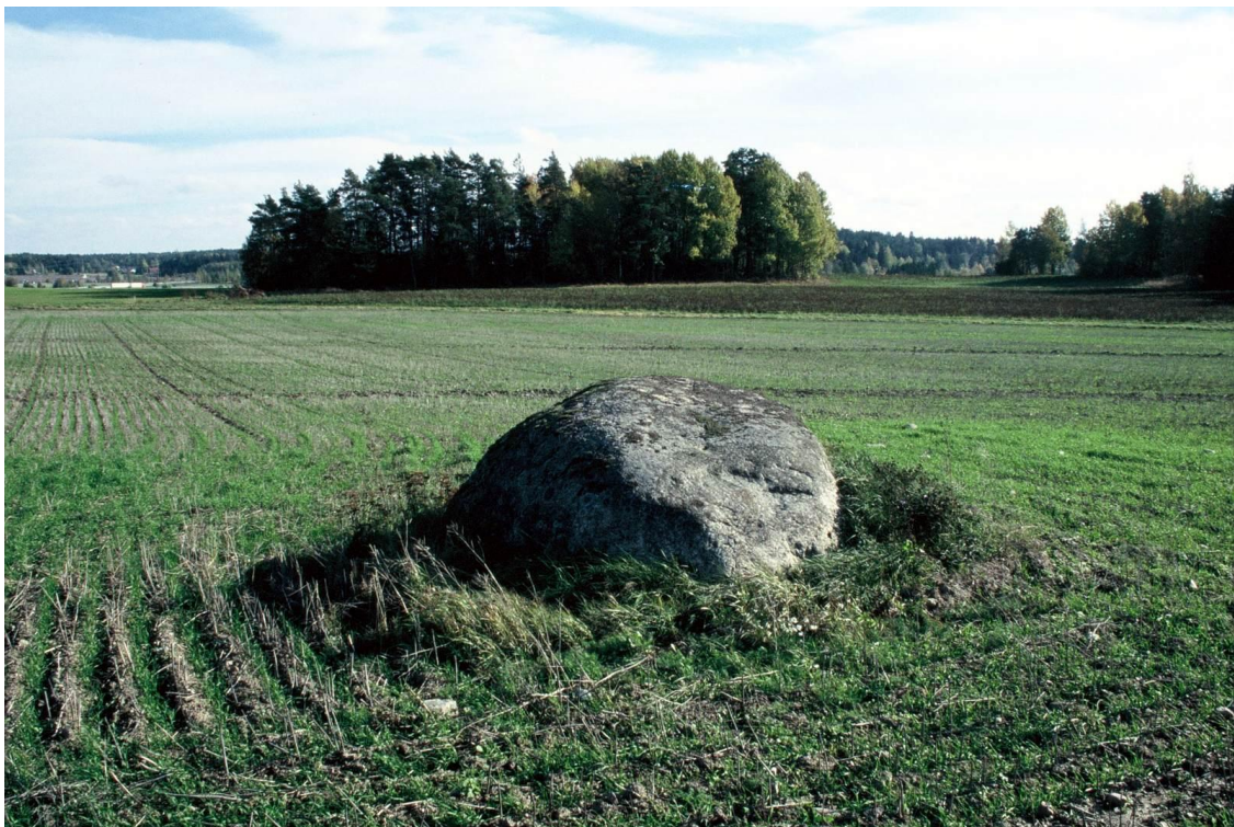
Kuva 3. Mattilan kuppikivi 1 ja tämän takana Ravattulan Ristimäki. Kuvattu itäkaakkoon.

Ravattulan Ristimäen ohella tutkimuslupa haettiin Ristimäen luoteiskulmasta noin 140 m länteen sijaitsevalle kuppikivikohteelle nimeltä Mattilan kuppikivi 1 (mj-rek. 202010027). Alkuperäisenä tarkoituksena oli tutkia kuppikiven ympäristöä pienellä tasokaivausalueella. Tutkimuksista tällä kohteella kuitenkin luovuttiin, sillä pelto kuppikiven ympärillä aivan kiveen asti oli raivattu viljelykseen eikä alkuperäistä maanpintaa kiven lähetyvillä ollut lainkaan säästynyt. Peltoalue oli lisäksi tutkimusten aikana viljelyksessä.