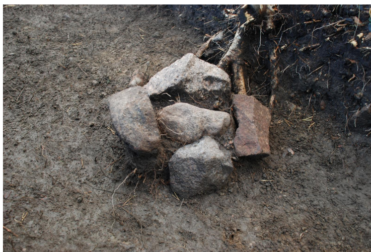
Kuva 11. Lähikuva kivetystä paalunsijasta 2 ruudussa 192/796. Kuvattu koilliseen.