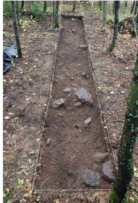
Kuva 7. Koeoja 1, taso 1. Kuvattu etelään.

Kerroksesta tulivat esiin löydöt TYA 863:9-26.