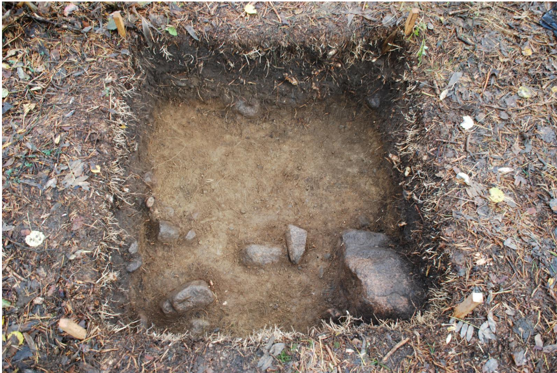
Kuva 23. Koekuoppa 2. Kuvattu pohjoiseen.

Kuopasta tuli esille löydöt TYA 863:240-241 (palanutta savea 3 kpl). Koekuopasta ei tullut esiin mitään rakenteita.