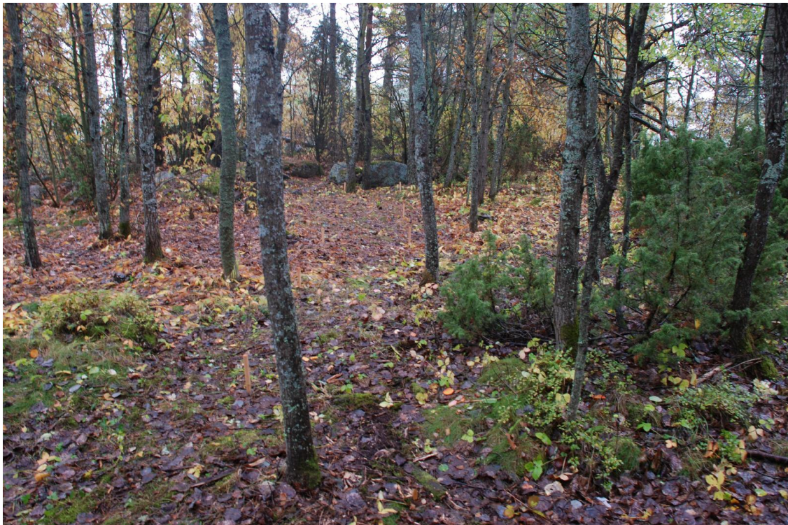
Kuva 6. Koeaja 1 paalutettuna. Kuvattu pohjoiseen.

Pohjaan kaivetuiksi tulkituille alueille tehtiin koepistoja asian varmistamiseksi. Kaivausten päättyessä pohjaan kaivamattomien kaivausalueiden pohjalle asetettiin suodatinkankaat ja kaikki alueet täytettiin entiselleen. Osa kaivausalueen rajoja merkitsevistä paaluista jätettiin paikoilleen, mutta niiden lisäksi kaivausalueiden päätyihin asetettiin maan sisään noin 20 cm pituista harjaterästä.