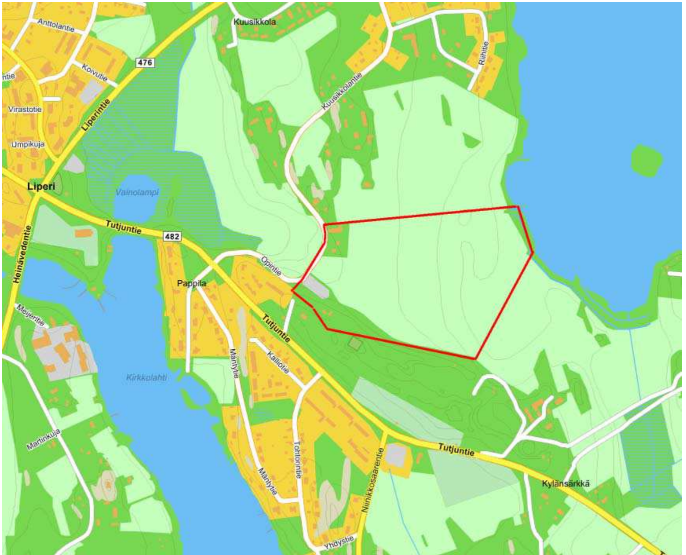
Kartta 2. Pietarisen kaava-alueen sijainti Liperin kylässä. Ei mittakaavassa.