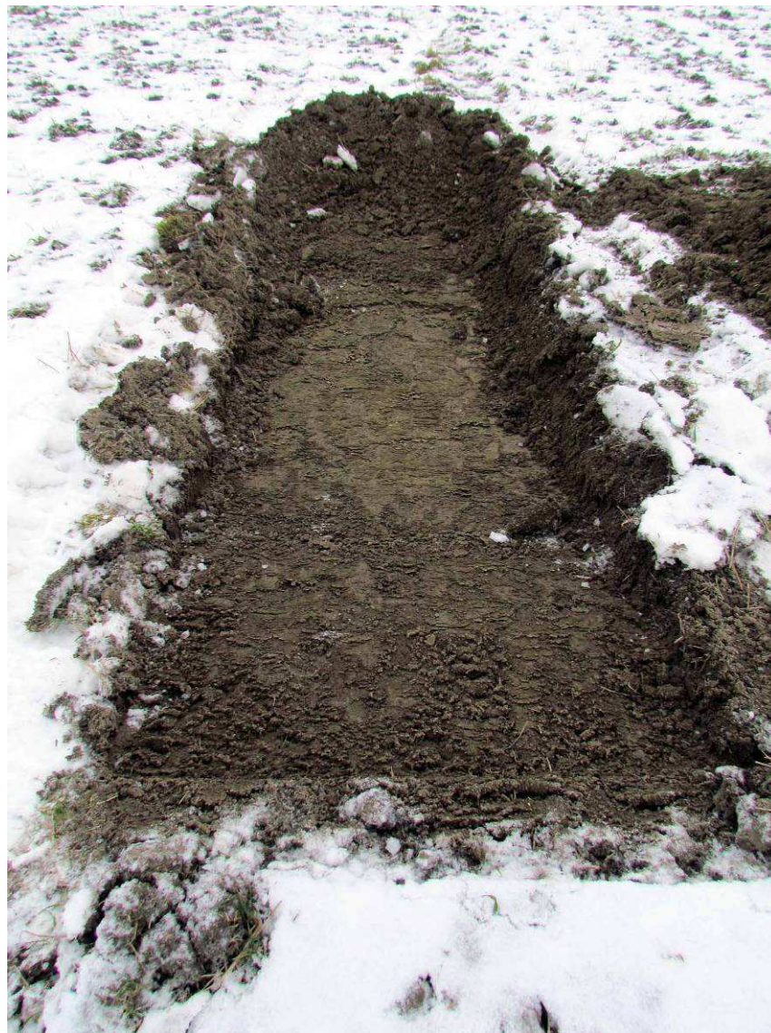
Kuva 3. Koekuopista paljastui peltomullan alapuolelta harmaa savi- maa.

Koekuoppien sijainti on esitetty selvityksen liitekartassa 1. Ensimmäisenä kaivettiin koekuopat 1 – 21. Koekuopat sijaitsivat kaava-alueen pohjoisosassa noin 10 metrin välein. Seuraavaksi kaivettiin koekuopat 22 – 28 noin 20 metrin etäisyydelle toisistaan peltotien eteläpuolelle. Tämän jälkeen kaivettiin koekuopat 29 – 38 kaava-alueen lounaisosaan. Viimeiset koekuopat 39 – 46 sijoitettiin korkeuskäyriä vastaan tutkimusalueen keskelle.