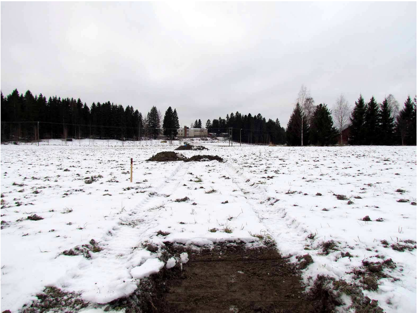
Kuva 2. Koekuopat sijoitettiin suoriin linjoihin joko 10 tai 20 metrin välein.