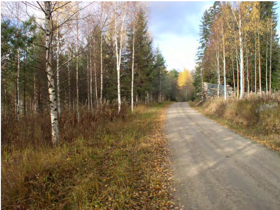
Selkienkangas. Asuinpaikka kuvattuna pohjoiseen. Löydöt KM 36363 on kerätty ojan seinämästä 5 m matkalla puupinosta kuvaajaan päin. Tien vasemmalla puolella tasannetta on noin 10 m leveydeltä tien ja rinte reunan välissä. Sinne kaivetuista koekuopista ei saatu löytöjä.