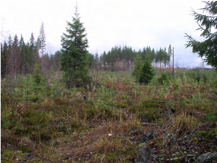
Pieni-Poikimo 1. Asuinpaikan pohjoista löytöaluetta kuvattuna etelälounaaseen kankaan koilliskulmassa olevalta kalliolta. Löydöt KM 36366:1 on kerätty äestysvaoista etualalta. Tihein löytökeskittymä on keskellä olevan kuusen tienoilla. Sen vasemmalla puolella taustalla näkyvä korkea mänty on eteläisen löytöalueen keskellä. Tie kulkee oikealla puhelinlinjan kohdalla.