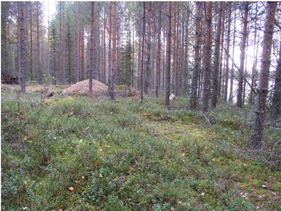
Lintuniemi. Löytöaluetta kuvattuna etelään. Keskellä on asumuspainanne ja sen oikealla laidalla muovikassi kenttälapion varressa koekuopan merkinä. Taustalla raivattu alue, ja sorakasa sen keskellä. Rinne alkaa nousta kuvan vasemmasta reunasta, ja laskee oikealla kohti rantatörmän reunaa.