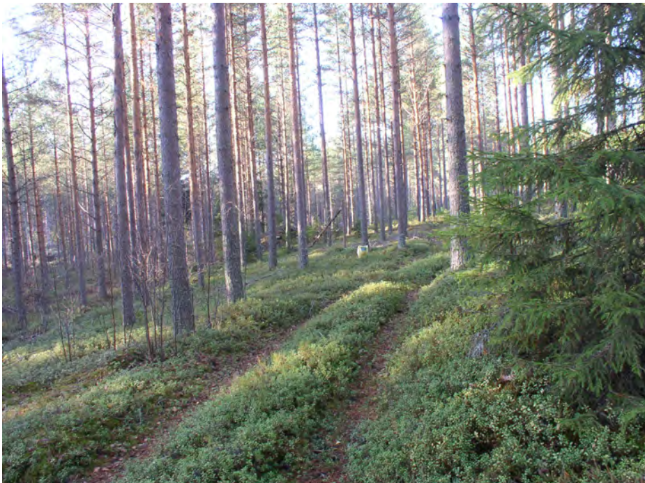
Oininginsalo 2. Asuinpaikkatasannetta kuvattuna tasanteen kaakkoispäästä traktoriuralta länsiluoteeseen. Kaakkoisin koekuoppa on kuvan keskellä (merkitty muovikassilla). Suole laskeva törmä näkyy vasemmalla.