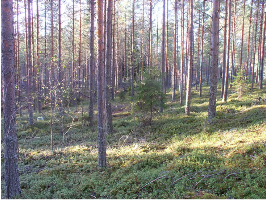
Oininginsalo 2. Asuinpaikkaa kuvattuna ylempää mäen rinteeltä länteen. Palaneen luun löytöpaikka on keskellä kuusen takana. Kaakkoisin koekuoppa on vasemmalla (merkitty muovikassilla).