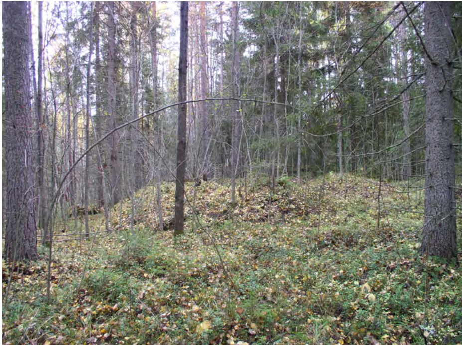
Keronlampi. Kumpareen länsilaidalla sijaitseva suuri tervahauta kuvattuna etelään.