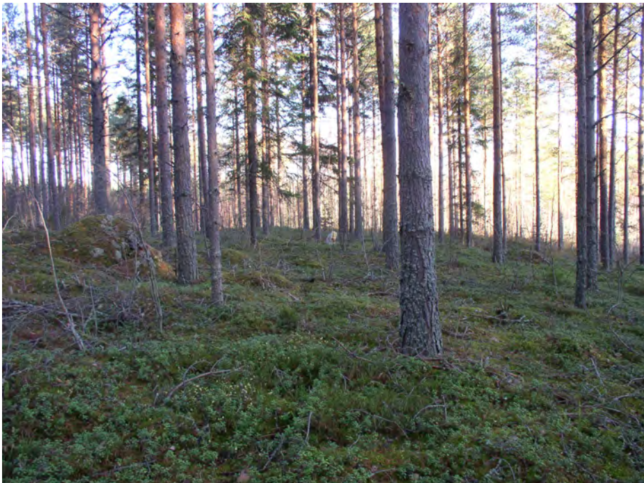
Oininginsalo 1. Asuinpaikkatasannetta kuvattuna itään traktoriuralta. Koekuoppa 1 on taustalla (merkkinä muovikassi). Koekuoppa 3 on kuvan keskellä, 5 m päässä vasemmalla näkyvästä kivistä.