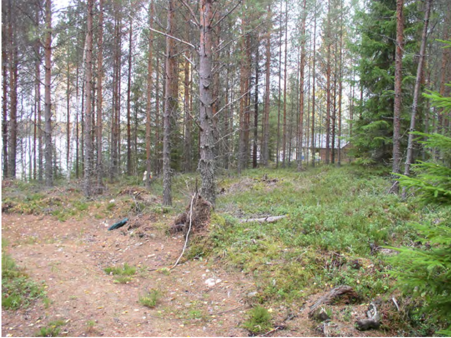
Lintuniemi. Löytöaluetta kuvattuna luoteeseen. Vasemmalla raivattu alue ja asumuspainanne. Tasanne jatkuu asumuspainanteesta oikealle. Taustalla näkyy saunamökki naapuritontilla. Sinne asti asuinpaikka ei näytä jatkuvan.