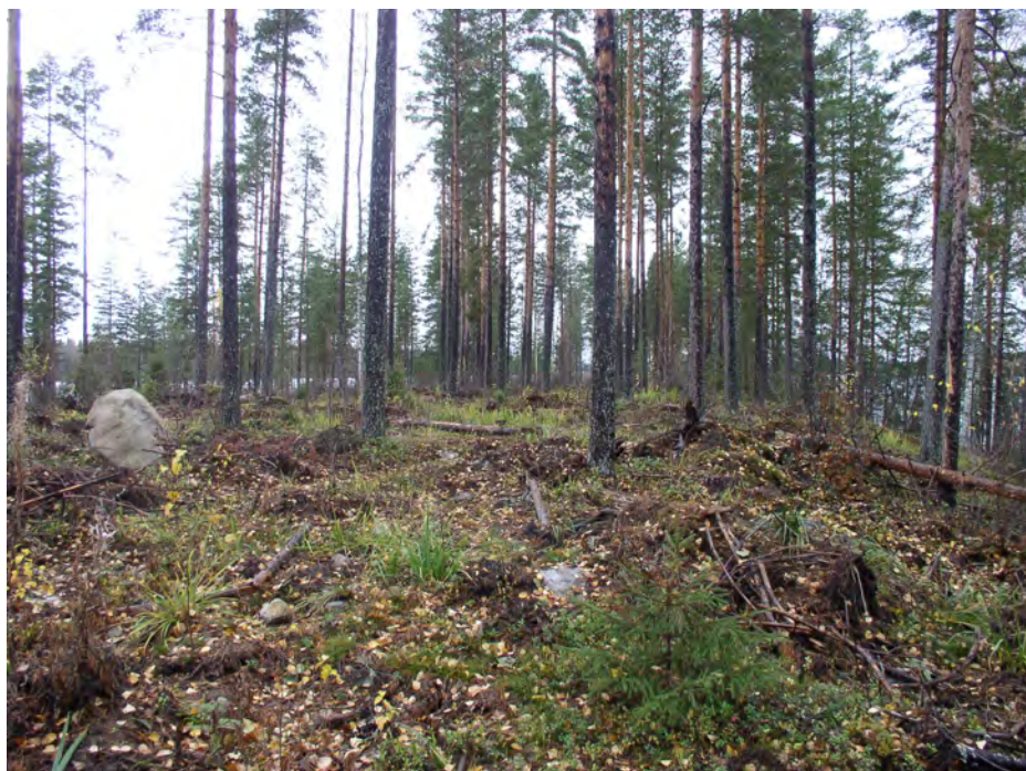
Pitkäniemi. Asuinpaikan eteläistä löytöaluetta kuvattuna pohjoisluoteeseen, niemen kärkeen päin. Maa on varsin kivistä. Tihein löytökeskittymä on etualalla kuvan keskellä. Vasemmalla oleva suuri vaalea kivi on sama, joka näkyy ylemmässä kuvassa taustalla, kuvan keskellä puiden välissä.