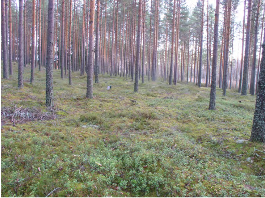
Oininginlampi 2. Asuinpaikan maastoa kuvattuna kaakkoon. Kuvan keskellä on karttalaukku koekuopan kohdalla asumuspainanteessa. Taustalla oikealla Oininginlampi ja sen takana harjanne, jolla sijaitsee asuinpaikka Oininginlampi 1. Taustalla vasemmalla näkyy puiden välistä harjanteiden välisessä notkelmassa oleva omakotitalo.