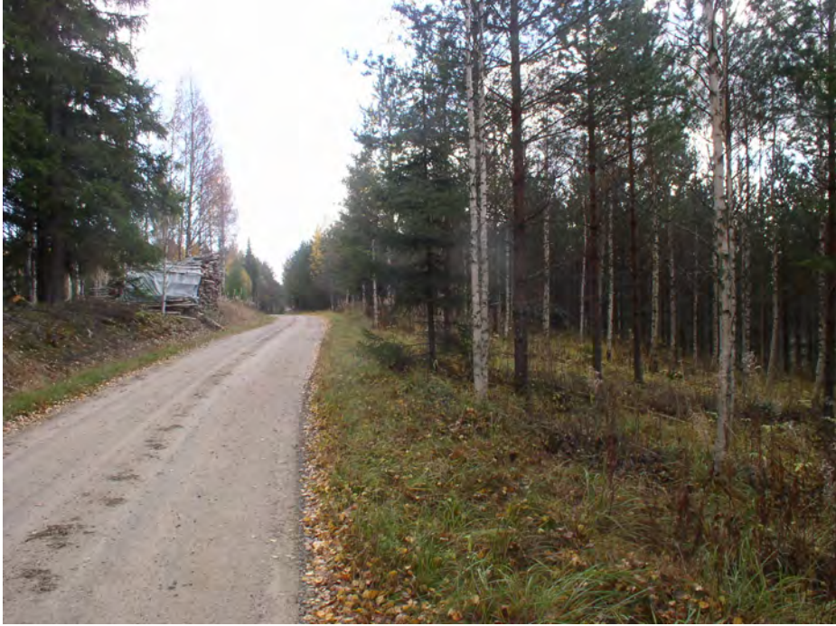
Selkienkangas. Asuinpaikka kuvattuna etelään. Löydöt KM 36363 on kerätty ojan seinämästä tien vasemmalla puolella olevan puupinon eteläpuolelta. Tien oikealla puolella rinte laskee kankaalta Haapalahden suon reunaan.