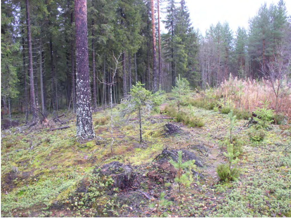
Pieni-Poikimo 1. Asuinpaikan eteläistä löytöaluetta kuvattuna etelään. Etualalla oleva runko on ensimmäisessä kuvassa näkyvä korkea mänty. Löydöt KM 36366:2 on kerätty äestysvaoista hakkuualueen puolelta. Vasemmalla rinne laskee kankaalta itään suolle.