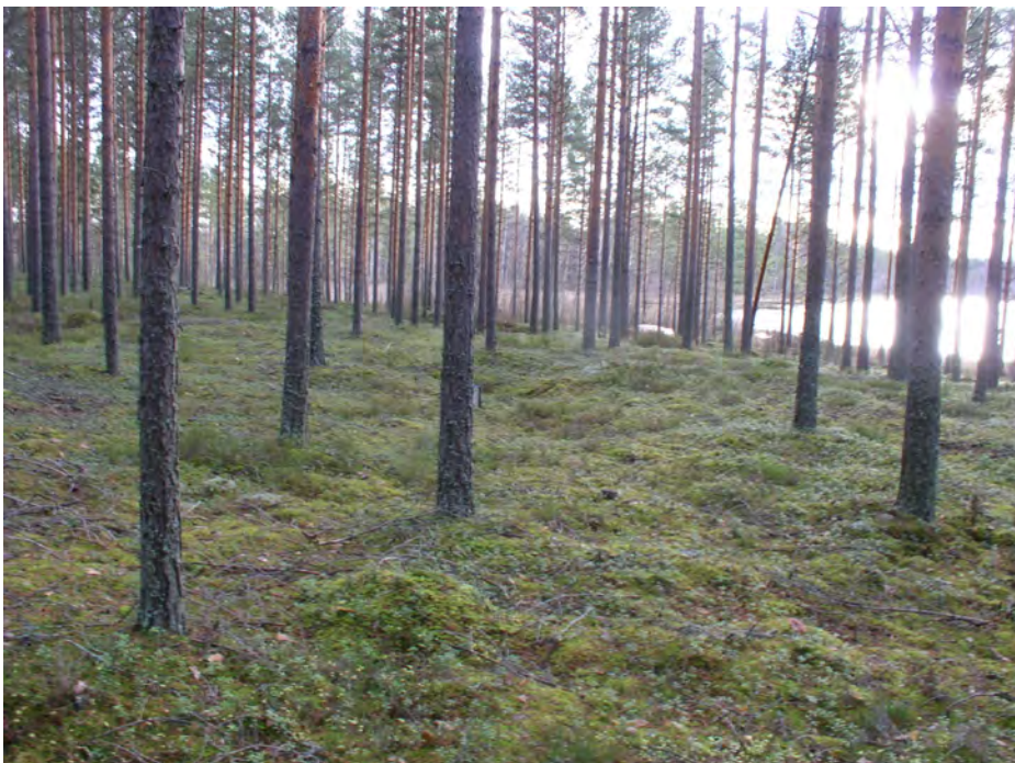
Oininginlampi 2. Asumuspainanne etualalla kuvan keskellä (koekuopan kohdalla oleva karttalaukku pilkottaa keskellä olevan männyn takaa). Taustalla näkyy Oininginlampi. Kuvattu etelään.