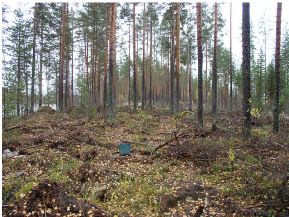
Pitkäniemi. Asuinpaikkaa kuvattuna laikutetun alueen luoteispäästä eteläkaakkoon. Etualalla on pohjoisempi löytöalue (KM 36359:4). Taustalla eteläisempi löytöalue (KM 36359:1-3), jonka keskellä on puiden välissä vaaleana näkyvä iso kivi.