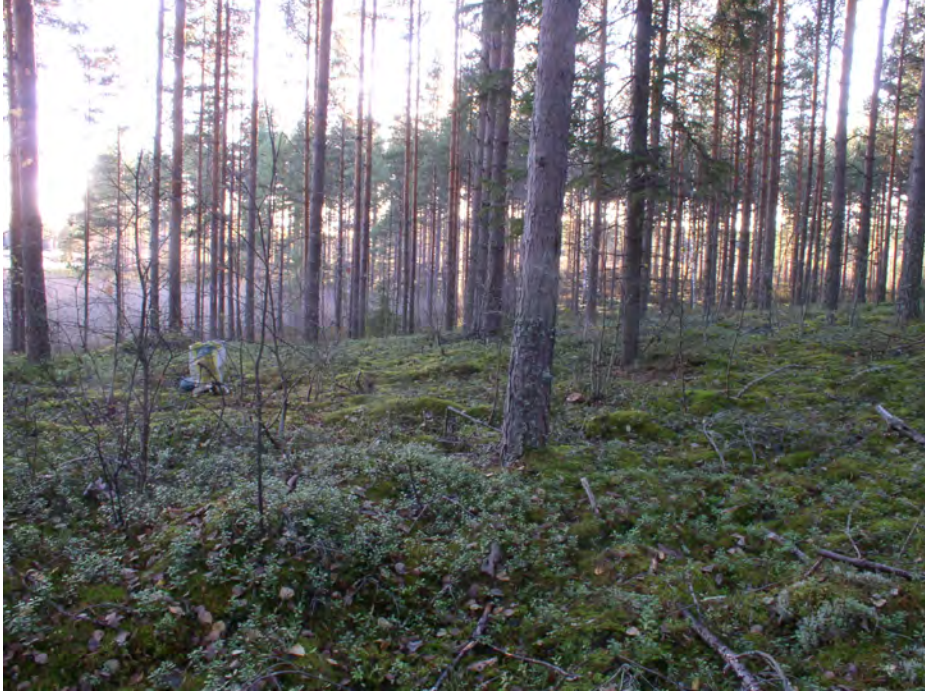
Oininginsalo 1. Asuinpaikkatasannetta kuvattuna etelälounaaseen. Koekuoppa 1 on vasemmalla (merkkinä muovikassi). Koekuoppa 3 on kuvan oikeassa reunassa. Tasanteen alla sumu nousee suosta. Taustalla näkyy lammen rantaan ulottuva matala harjanne.