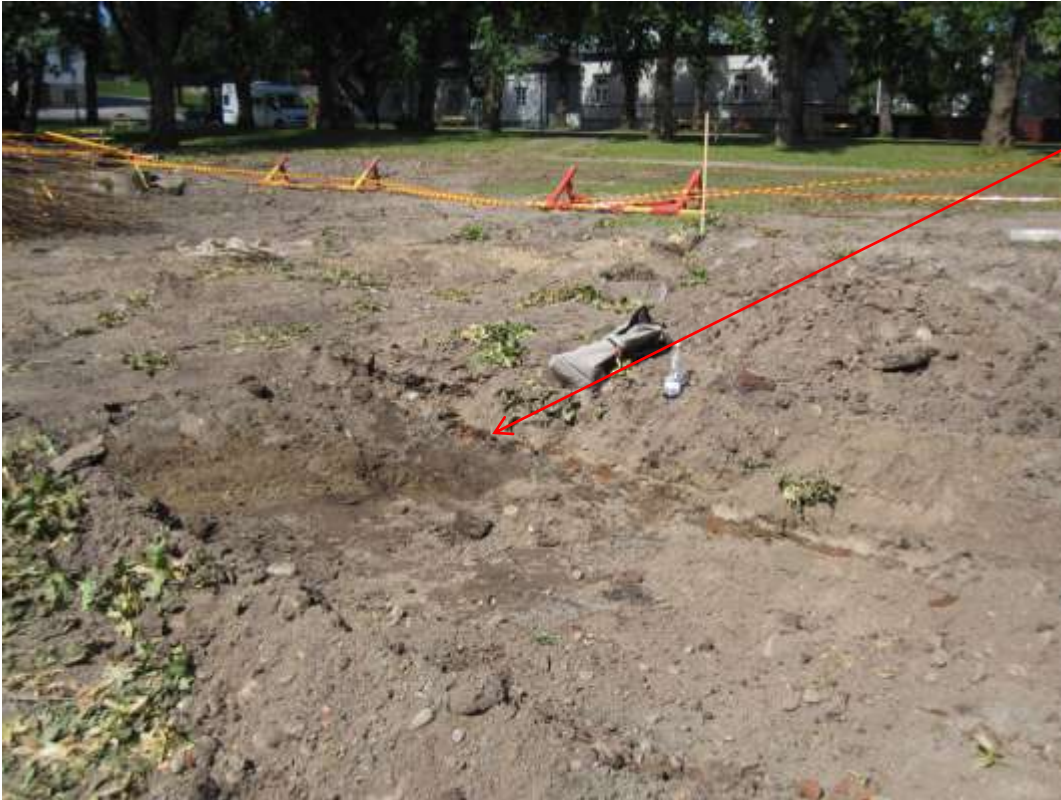
Tiilikerros, jonka alla tumma hiilensekainen kerros

KOEKUOPPA 2 n. 1,5m x 1,5m syvyys noin 50 cm. Sijainti katoksen kohdalla. Pinta kuoriutunut pois, kuopan reunassa suurikokoinen rakennuksen kivijalan kivi, jonka alla heti tiilimurskakerros, jonka paksuus on noin 20 cm, tämän alla likamaakerros, joka on noin 30 cm. Puhdas savi on noin 50 cm syvyydessä.