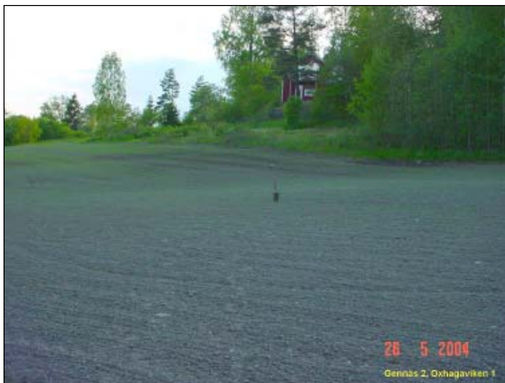
Kvartseja lapion ympäristöstä. Kuvattu luoteeseen.

Huomiot: Avoimesta kuivasta pellostä kvartseja suppeahkolta alalta. Paikan ajoitusarvio on sama kuin edellisen (Gennäs 1).