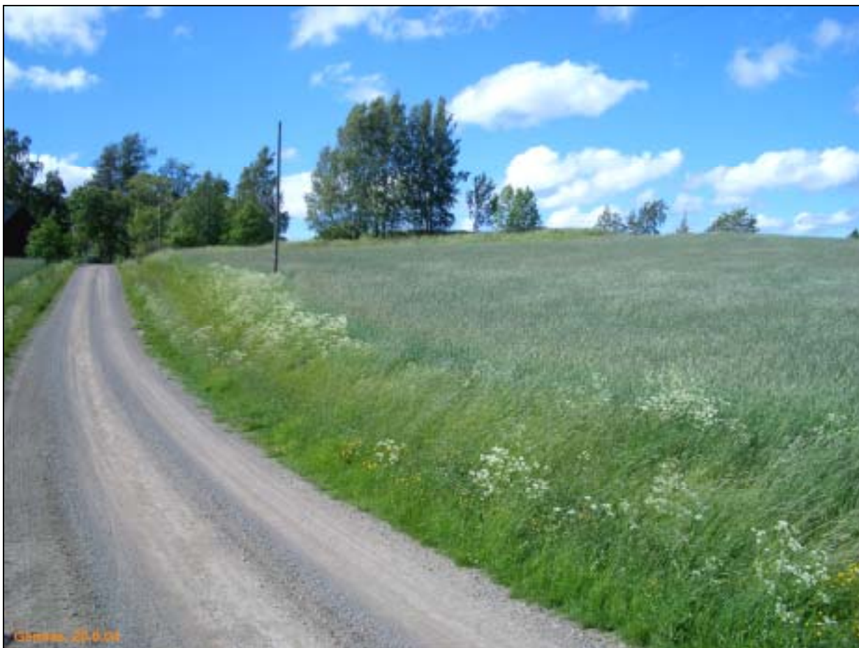
Rakennuksen paikka kuvan keskellä, pellon yläosassa olevan koivikon kohdalla. Kuvattu luoteeseen.