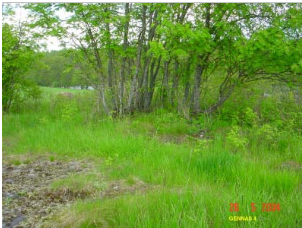
Kiukaan raunio kuvan keskellä pihlajan juurella.

Huomiot: Peltosaarekkeessa, sen itäosassa on kiukaan raunio. Kiukaan vierellä maaperässä on tiilen- ja laastinpaloja. Kiukaan koko on 3 x 2,5 m ja korkeus n. 50 cm. Tästä 7 m lounaaseen on pieni kiviraunio kooltaan 1,5 x 2 m ja korkeus n. 30 cm. Se vaikuttaa peltokivirauniolta. Rakennuksen jäänteet ovat maakirjakarttaan merkityn talon kohdalla ja siten peräisin 1600-luvulta.