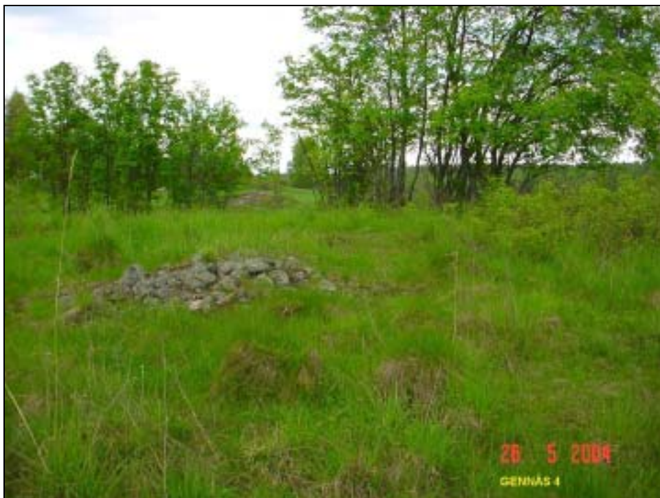
Kiukaan jäännös tai peltoraunio, taustalla oikealla toinen kiukaan raunio.