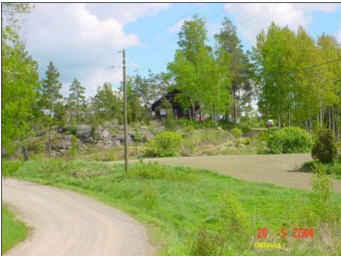
Asuinpaikka pellossa kuvan alalla. Kuvattu pohjoiseen