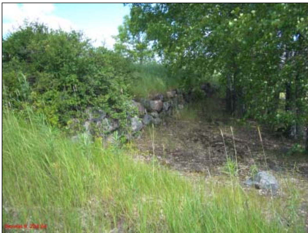
Rakennuksen pohjan kaakkoisreunan kivijalka. Kuvattu pohjoiseen.

Huomiot: Rakennuksen pohja on kooltaan 15 x 9 m. Sen pitkällä koillisreunalla on ehjä kivijalka, luoteisreunan ollessa lähellä kalliopaljastumaa. Pohjan ala on heinikkoista maakumpua. Pohjan koillispäässä on vanha betoninen aiv-rehusäiliö, joka on osin runnellut muuten ehjää rakennuksen pohjaa. Rakennuksen jäänteet ovat maakirjakarttaan merkityn talon kohdalla ja siten peräisin 1600-luvulta.