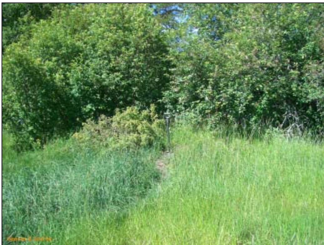
Kiukaan raunio kuvan keskellä pusikon reunassa ja osin alla. Kiukaassa palanutta kiveä ja tiilen paloja. Kiuas on 25 m puimalarakennuksesta pohjoiseen, kohdalla missä rinne alkaa laskea jyrkemmin länteen ja lounaaseen.

Huomiot: Puimalarakennuksen koillispuoleisella niityllä, rakennuksesta 15 m on kivijalan jäänteet, n. 6 x 5 m. Sen sisäpuolelle tehdyssä koekuopassa oli pinnassa tiilenpaloja multakerroksessa, jonka alla heikko tumma n. 15 cm paksu kulttuurikerros silttimaassa. Rakennuksesta 25 m koilliseen, pusikon reunassa on kiukaan raunio, jossa palanutta kiveä ja tiilen sekä laastin paloja. Kiukaan koko on 3 x 2,5 m ja korkeus n. 60 cm. Kiukaan ja kivijalan jäänteiden välille tehdyssä koekuopassa ei havaittu kulttuurikerrosta. Rakennuksen jäänteet ovat maakirjakarttaan merkityn talon, sekä isojakokarttaan merkityn rakennuksen kohdalla ja siten peräisin 1600-luvulta ja se on ollut paikalla vielä 1700-luvun lopulla.