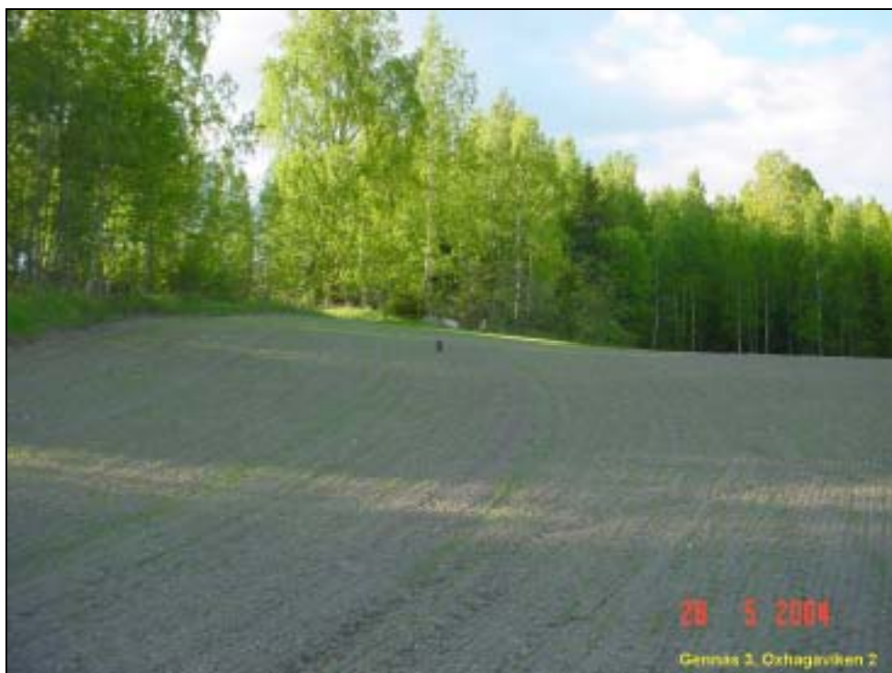
Asuinpaikka kuvan keskellä pellon yläosassa, lapion ympäristössä. Kuvattu pohjoiseen.