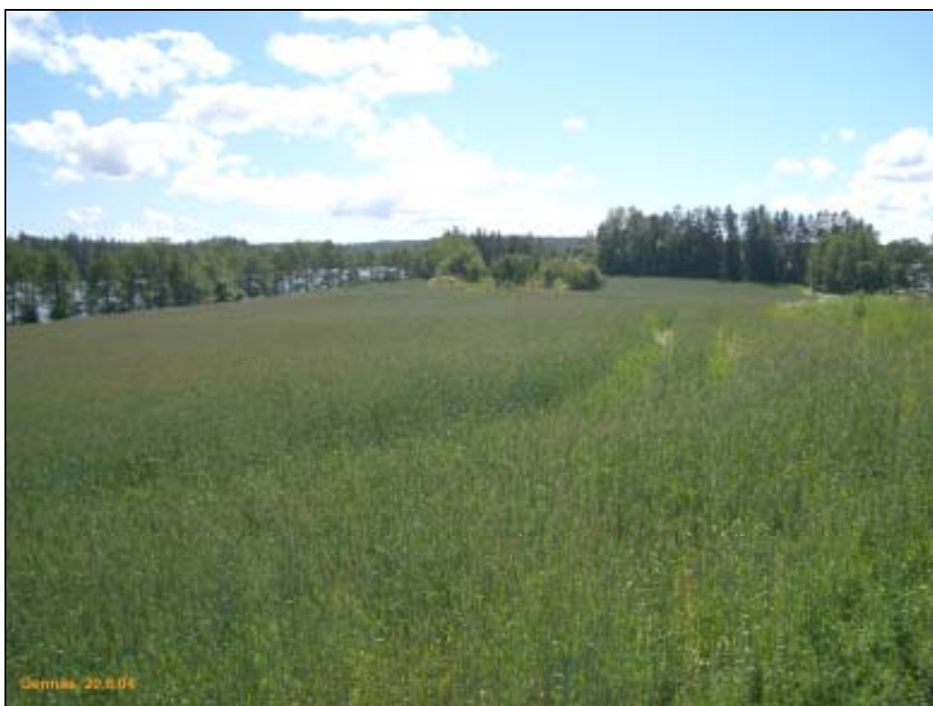
Gennäs 4 peltosaareke taustalla kuvan keskellä, kuvattu etelään tieltä.