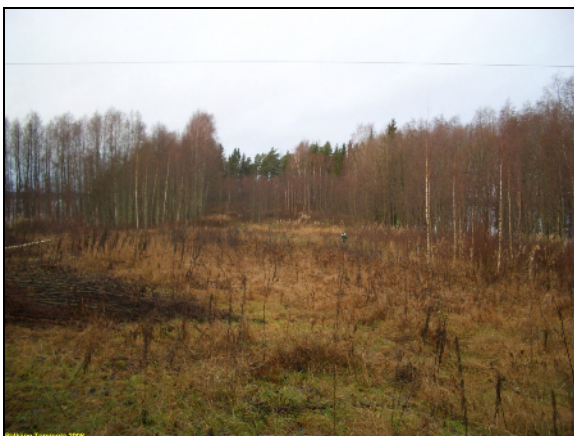
Puhdistamon N-puolinen pelto. länteen.