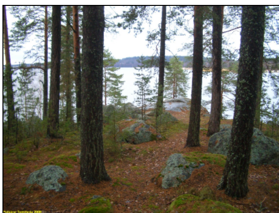
Niemen kärki, kuvattu luoteeseen