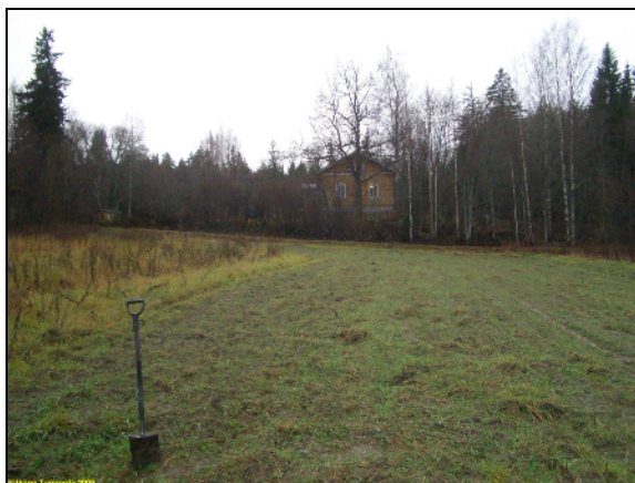
Takana Tommolän talo. Kuvattu etelään.