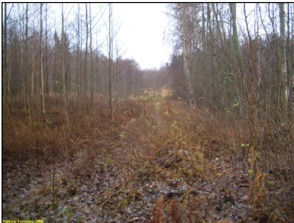
Niemen länsiosasta itään, vanhaa peltoa