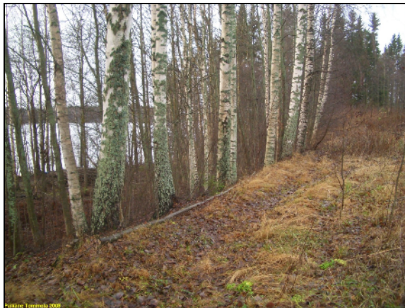
Länsiosan pohjoisrannan törmää