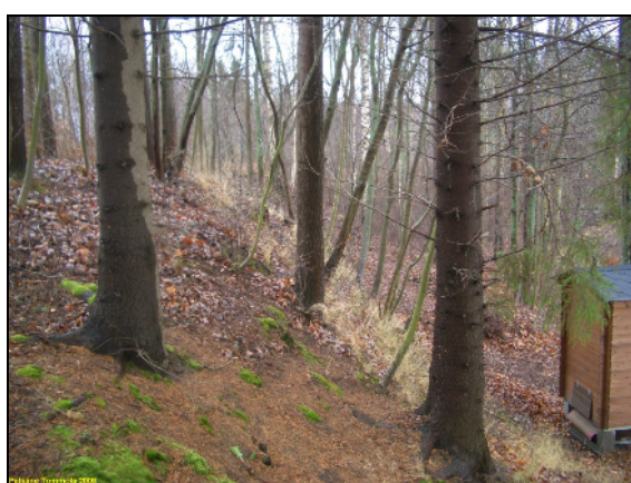
Niemen pohjoisrannan vanha törmä.