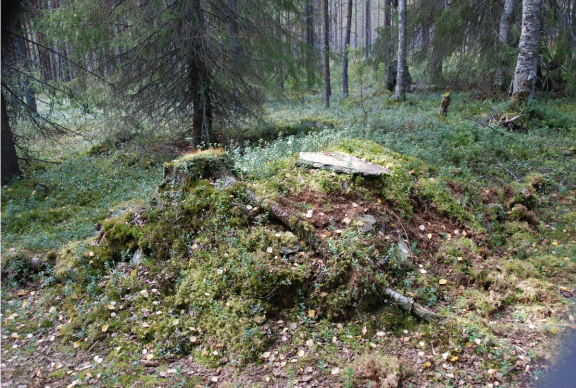
Kohde 3. Todennäköisesti tupasijan piisikiveys. Päälle nostettu laakakivi.