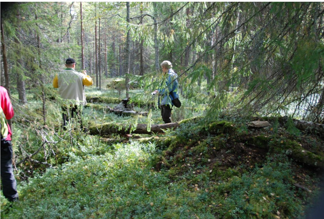
Kohde 4. Sammalpeitteinen jäännös kuvan oikeassa reunassa. Kyseessä on todennäköisesti tupasijan piisikiveys. Jäännöksen päällä ja ympäristössä on useita kaatuneita puita. Taustalla puiden takana näkyy kiveys 3.