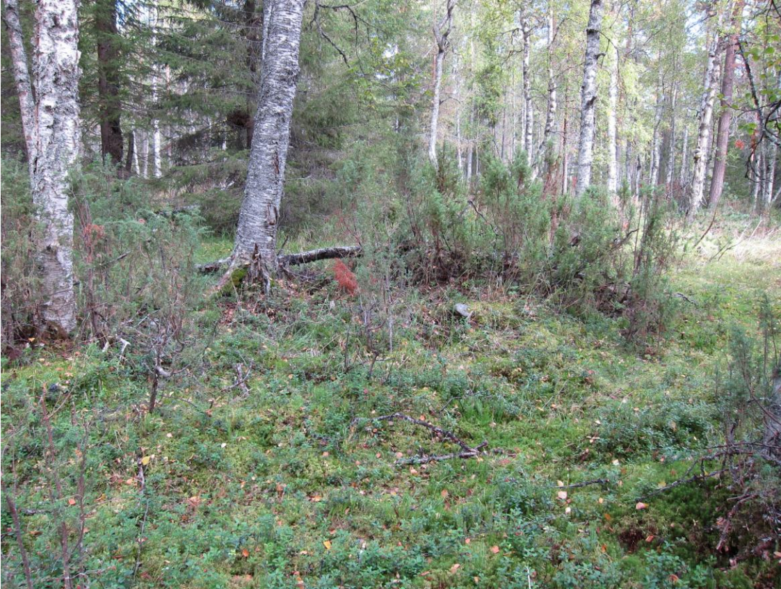
Kohde 1. Kiveys, jonka päällä kasvaa katajikkoa. Todennäköisesti tupasijan piisikiveys. Hieskoivuvaltainen ja aluskasvillisuudeltaan ruohovaltainen tupakenttä eroaa selvästi ympäristöstään. Lounaasta.