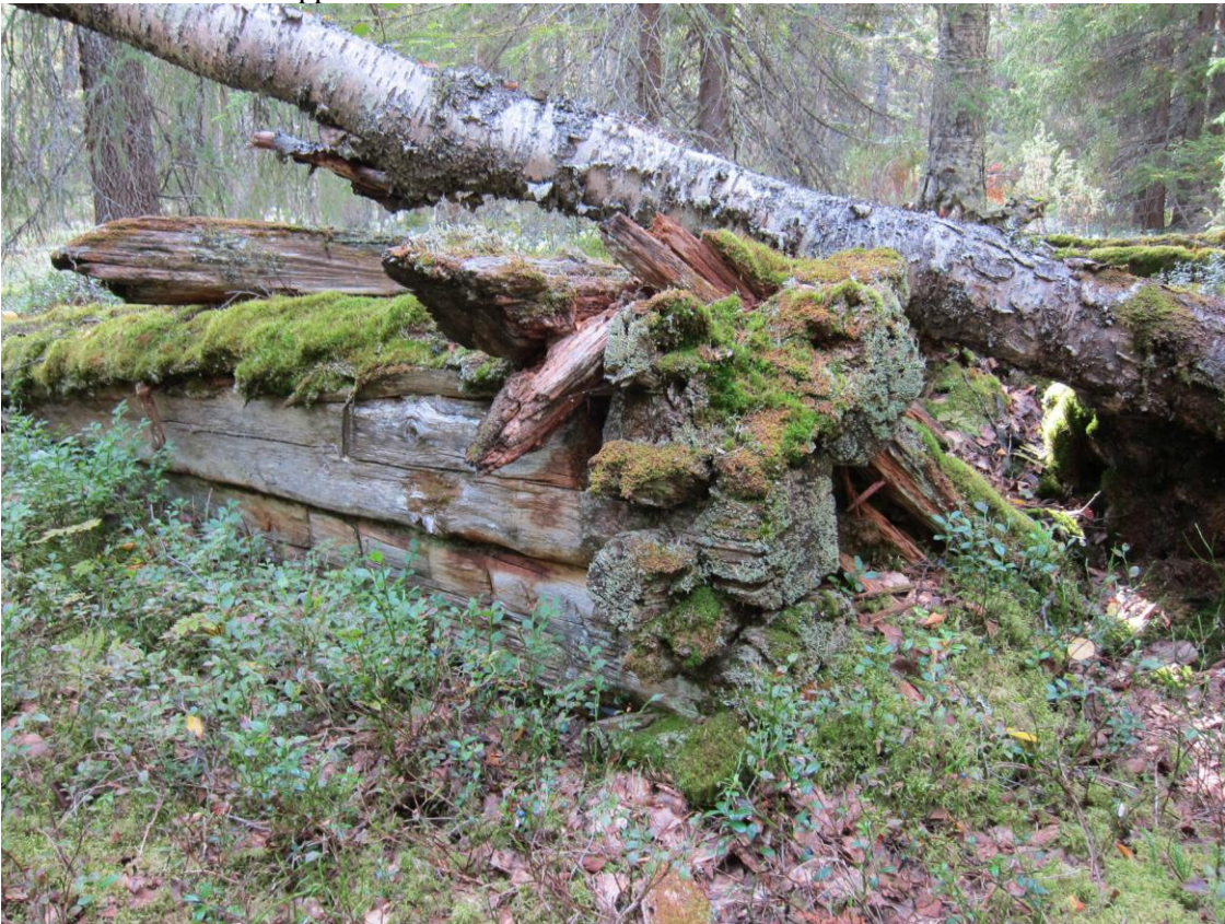
Kohde 5. Hirret salvottu koirankaulalla. Hirsien pää sahattu, päällimmäisissä kirveen jälkiä.