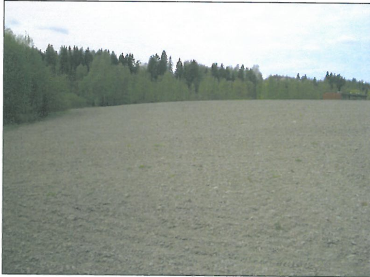
Alueen itäpäätä kuvattuna alueen koillisrajalta etelään, jokisuuta kohden. Alla samalta paikalta kuvattu lounaaseen, keskellä pellon takana Narvan vanha kylätontti.