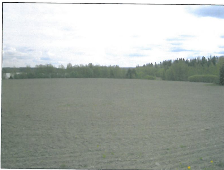
Tutkimusalueen peltoa kuvattuna kylätontin pohjoispuolelta itä-kaakkoon. Alla kuvattu itään kylätontin keskeltä. Tien molemmin puolin vanhaa kylätontin aluetta.