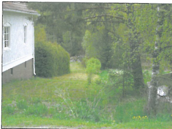
Kuvassa vanhan sillan kiviarkun rauniot (isojakokartalla itäisempi silta) ja oikealla sama kylätietä kuvattuna – vanha sillalle menevä tie nurmikkona.