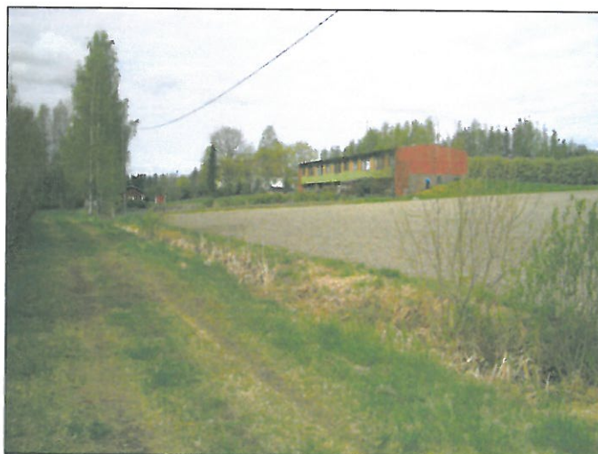
Kuvattu jokirannasta louteeseen. Kylätontti joesta nousevan töyrään laella.